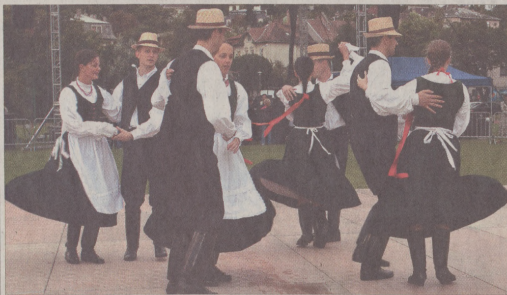
A Nyárbúcsúztató bál nyitótáncát a Bartók Táncgyűttes fiatal művészei adták elő

tal az előrejelzés nem tévedett. Sokan megijedtek és otthon maradtak, de a bál fő vendége, Demjén Ferenc soraival szólva: mi „itt vagyunk, ki tudja, kit ki hívott, mégis itt vagyunk, sokáig itt leszünk”. Elérkezett az évszakváltás ideje, amely nem csupán az iskolakezdést és a nyári