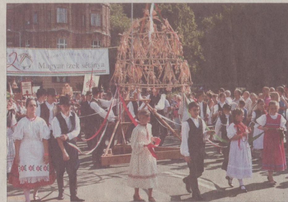
Az aratófelvonulás résztvevői a Budai Vár lábától indultak a Szent István Bazilika elé

Bár Magyarországon tortájának hivatalos felvágására csak este nyolc órákor került sor, az érdeklődő ingyenek a Gasztró sétányon már délelőtt megkóstolhatták az év süteményét. A magyaros ünnepet tükröző, és az augusztus 20-i ünnephez kapcsolódó verseny győztese ezúttal a Sulyán-féle szilvagombóc torta lett, amely rendhagyó formában ötvözi a magyar szilvát a csokoládéval és a marcipánnal.