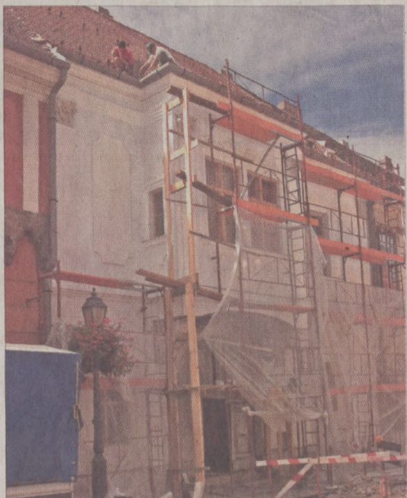
Restaurálták az Országház utca 22. szám alatti ház homlokzatát és a tetőszerkezetet is kicserélték

írásoknak már nem megfelelő lakások helyett az első és második emeleten, valamint a KÖH előírásainak megfelelően kialakított tetőtérben nagyméretű lakásokat építenek. Az elképzelések szerint a földszinten mesemúzeum, az emeleten az Attila út felőli oldalon egy cukrászda létesül. Háromszázmillió forintba kerül az Iskola u. 12.