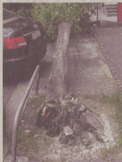
A korhadt gyökérzet már nem tartotta meg a fát

A területre fejlesztésének része a kereskedelmi ellátás javítása. Tavaly az Alagút utca 5. szám alatti élelmiszer áruház bérleti szerződése lejárt. Az Önkormányzat teljes felújítási kötelezettséggel adta bérbe helyiséget a CBA Budavár Kft. részére. Az új bérlő több mint kétszáz millió forintot költött az Önkormányzat tulajdonában lévő ingatlanra (portálok cseré-