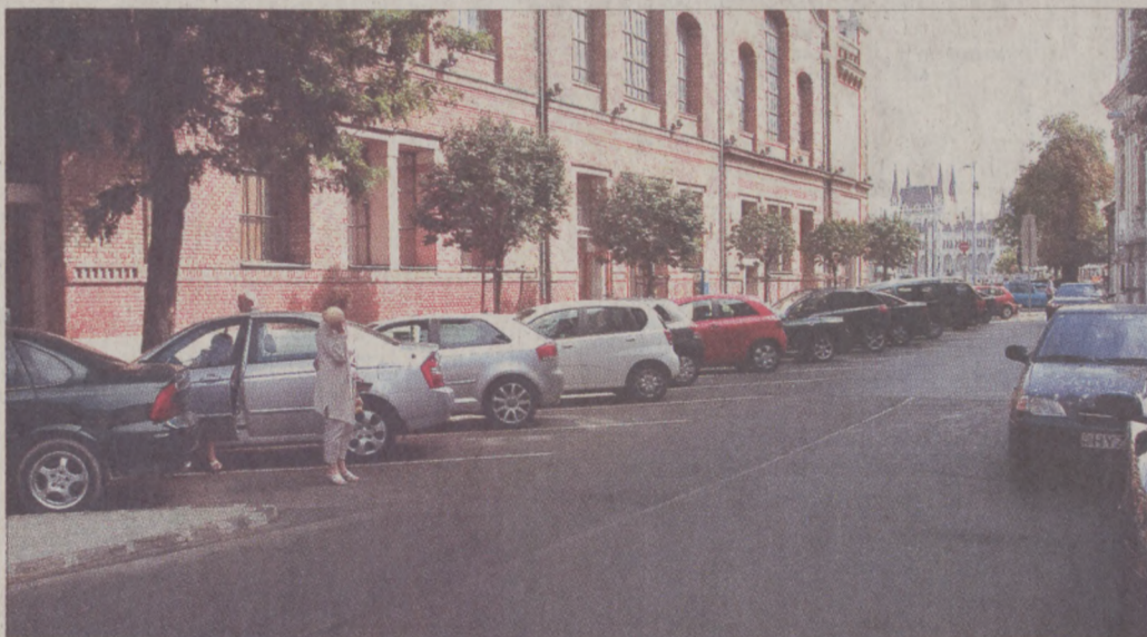
Befejeződött a Markovits Iván utca korszerűsítése

A Fővárosi Önkormányzat beruházásában várhatóan még ebben az évben megkezdődik a városbusz útvonalának felújítása a Dísz tér – Tárnok utca – Szentháromság tér szakaszon. A fejlesztéshez kapcsolódva a Budavári Önkormányzat beruházásában megtörténik a járda felújítása. Jó állapotú, kevésbé elhasználódott kövekre cserélik az útfelület kőburkolatát, míg a járdákat újraaszfaltozzák. Várhatóak kisebb szegélymódosítások, a parkolás elősegítése érdekében döntött szegélyeket építenek ki. Jövő tavasszal a Szentháromság tér – Hess András tér – Fortuna utca – Országház utca útvonalon folytatódnak a munkálatok.