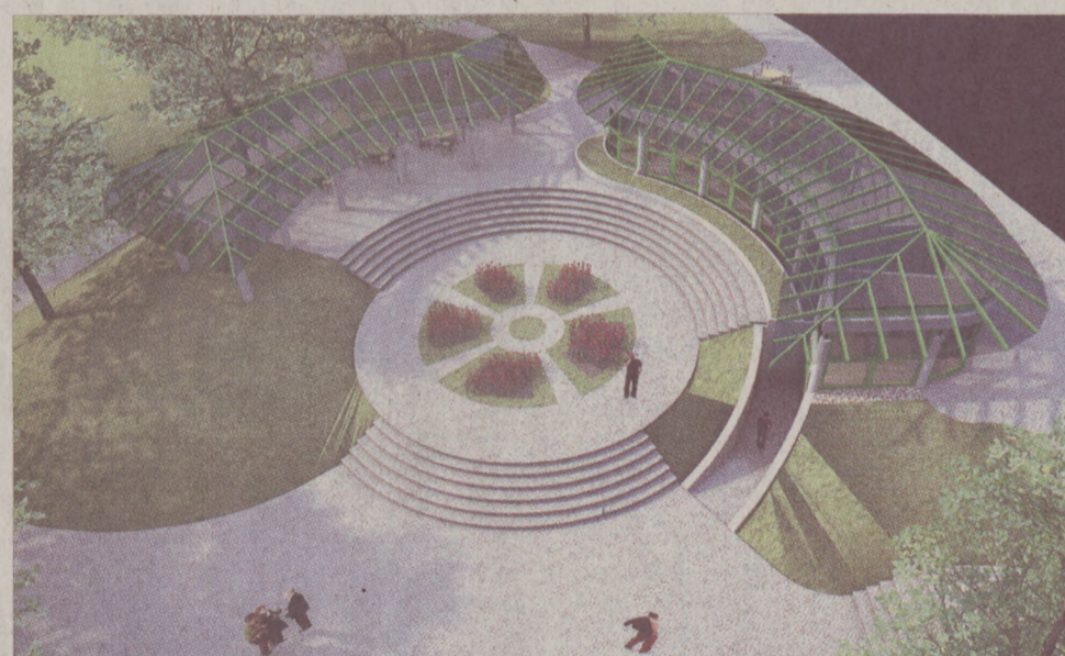
Az új pavilonok és a Déryné szobor környezetének látványterve a Horváth-kertben