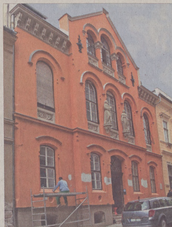
Rövidesen elkészül a Hunyadi utca 18. szám alatti épület felújítása

Az utolsó simításokat végzi a kivitelező a Halászbástya Jezsuita lépcső feletti tornyának helyreállításán. A munkálatok során a szerkezetileg meggyengült toronysisakot szétbontották, majd az építőelemek megerősítését követően visszaépítették. A korábban előforduló vízesedések megszüntetése érdekében elvégezték a kupo-