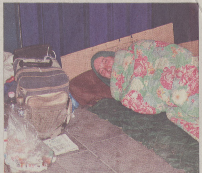
Szociális ellátópontokat alakítanak ki a fővárosban

Hatékonyan bizonyult a hajléktalanok körében kedvelt Vár környéki zugok, boltívek átalakítása. Ilyen volt a Jezsuita lépcsőnél, illetve a Lovas úton található menedékhely, amiket a műemléki szempontok betartásával úgy építettek át, hogy ne lehessen őket alvásra használni. Lezárta az önkormányzat a Hiltonhoz vezető lépcső alatti beugrót is, a következő feladat a Schüle lépcső rendbetétele. Szintén várható az érin-