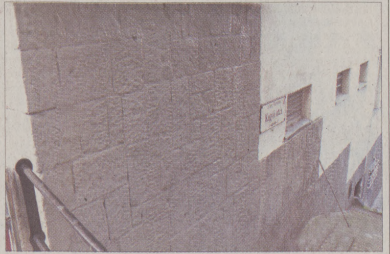
Megtisztított épület a Kagyló utcában

fiti bevonattal látták el. A graffiti-mentesítés - amelyet a Budavári Önkormányzat saját forrásból finanszírozott - mintegy 26 millió forintba került.