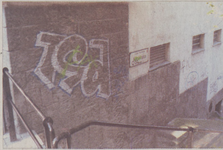
Októberben a Vízivárosban folytatódott a graffiti-mentesítés

Idén októberben a Vízivárosban folytatódott a falfirkák letakarítása. A közbeszerzési pályázaton kiválasztott Ifotech Clean Kft. munkatársai az Aranyhal, a Batthyány, a Csalogány, a Donáti, a Döbrentei, a Fiáth János, a Franklin, a Gyorskocsi, a Halász, a Hattyú, a Hunyadi János, az Iskola, a Kagyló, a Kapás, a Lánchíd, a Málna, az Ostrom, a Pala, a Szabó Ilonka, a Szalag, a Toldy Ferenc, a Várfok és a Vám utcákban, a Mária téren és a Szilágyi Dezső téren, valamint a Várkert rakpart vízivárosi részén takarították le a házfalakat. A letisztított felületeket úgynevezett anti-graf-