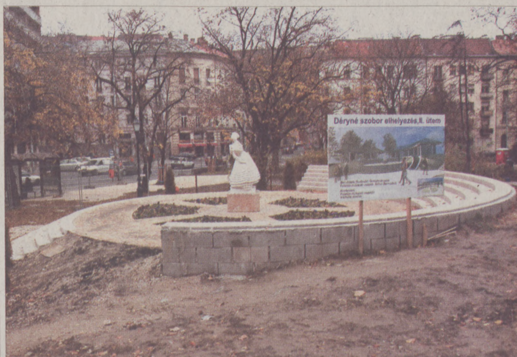
Rövidesen cserjéket, kúszónövényeket, fenyőféléket telepítenek a parkba

Jelenleg kertészeti munkák folynak a területen, a szakemberek a Déryné szobor mellett már látható virággyászokhoz hasonló további zöldfelületeket alakítanak ki, valamint a kedvező időjárásnak köszönhetően előrehozták a növénytelepítések egy részét is. A fűvesítésen kívül cserjéket, fenyőféléket, kúszónövényeket, valamint többször iskolázott facsometéket ültetnek. Megkezdődött