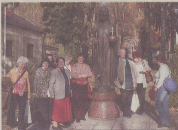
Budaváriak Lendván, a Szent István szobor körül

Még sűrű reggeli ködben indultunk egész napos kirándulásra a Mura mentén: Muraszombaton át Felsőlendvára.