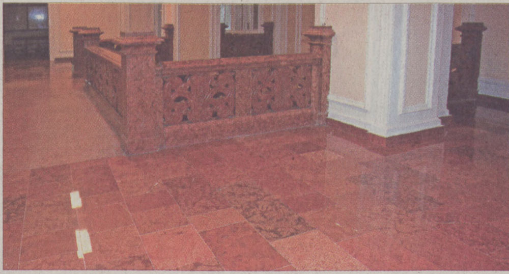
Vörös tadosi márvánnyal burkolták az épület felső fogadó szintjét