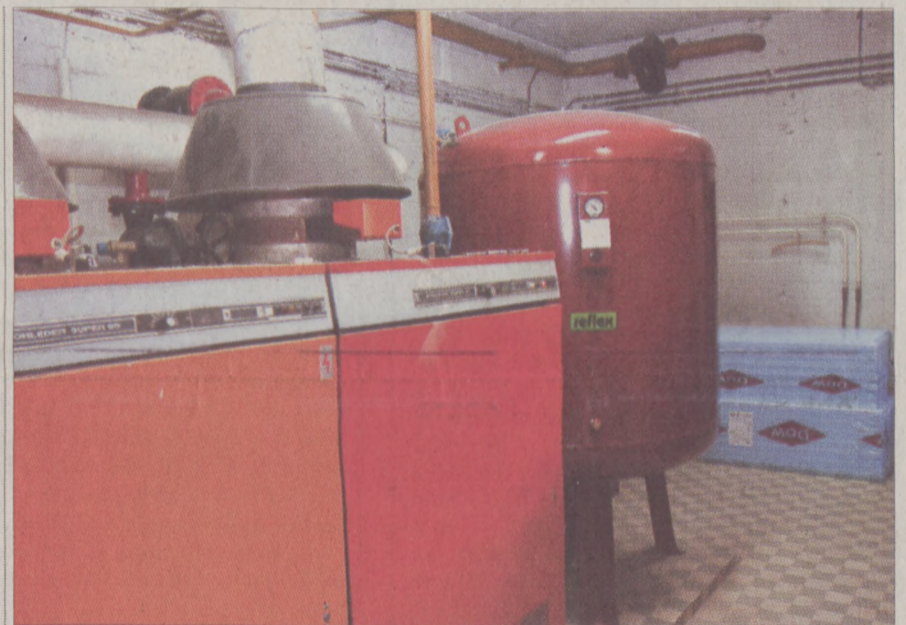
Az iskola energiaköltsége 25-30 százalékkal csökken

A beruházás befejeződött, a gyermekek az őszi szünet után már olyan iskolába tér-