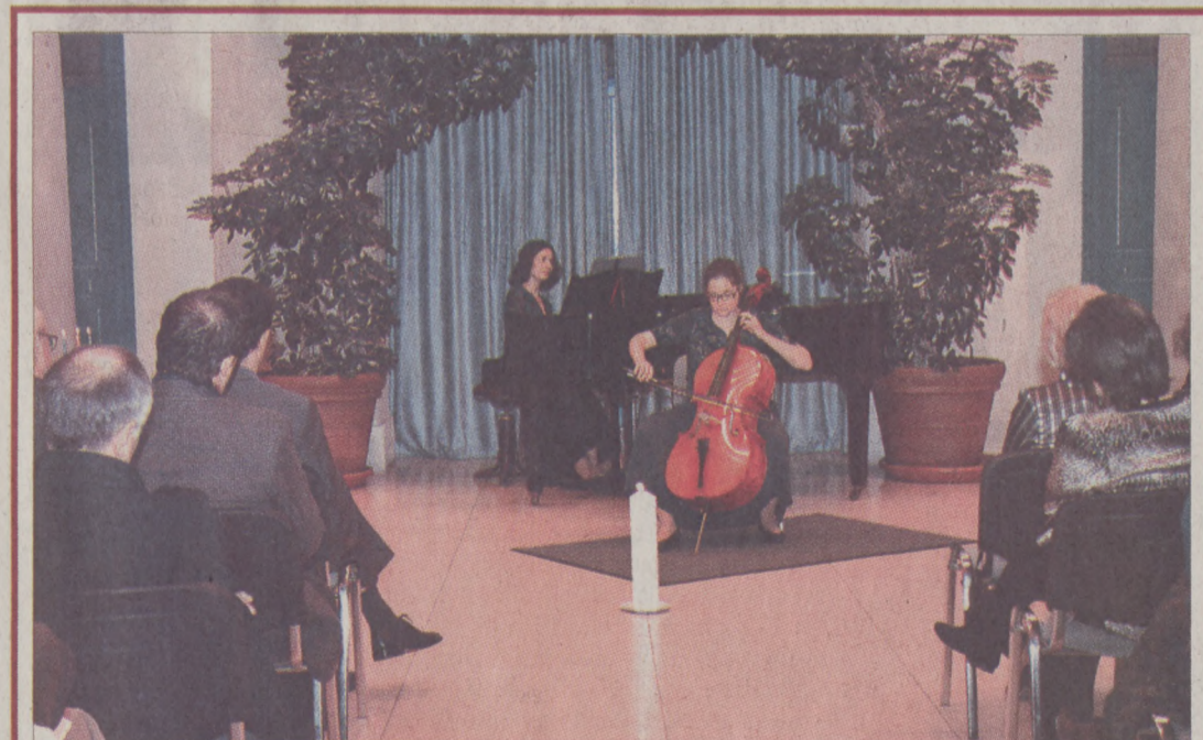
Jótekonysági hangversenyt szervezett november 14-én a Budavári Önkormányzat a Városháza aulájában a vörösiszap-károsult családok gyermekei javára. A koncerten a Magyar Örökség - díjas Kodály Zoltán Magyar Kórusiskola művésztanárai léptek fel. A hangverseny bevételét a Magyar Kármentő Alap számlájára utalták át.