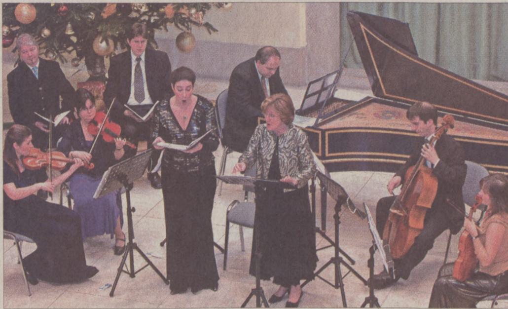
Az Orfeo Zenekar Kamaraegyüttese Esterhazy Pál: Harmonia Caelestis című művéből adott elő részleteket

Az atya a távoli példázat nyomán napjaink társadalmának képét festette le. -Épülő országunkban akadnak, akik mindentől hasznot akarnak húzni, akik vádolnak – mondta –, de szerencsére élnek még közöttünk reménykedők. A többség számára kizárólag a rohanás, és a vagyonszerzés