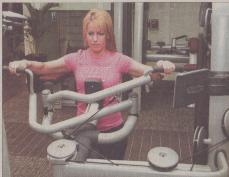
Életmód központja szeretne válni az új létesítmény