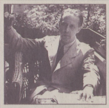
A városrész Márai Sándor írásainak tükrében