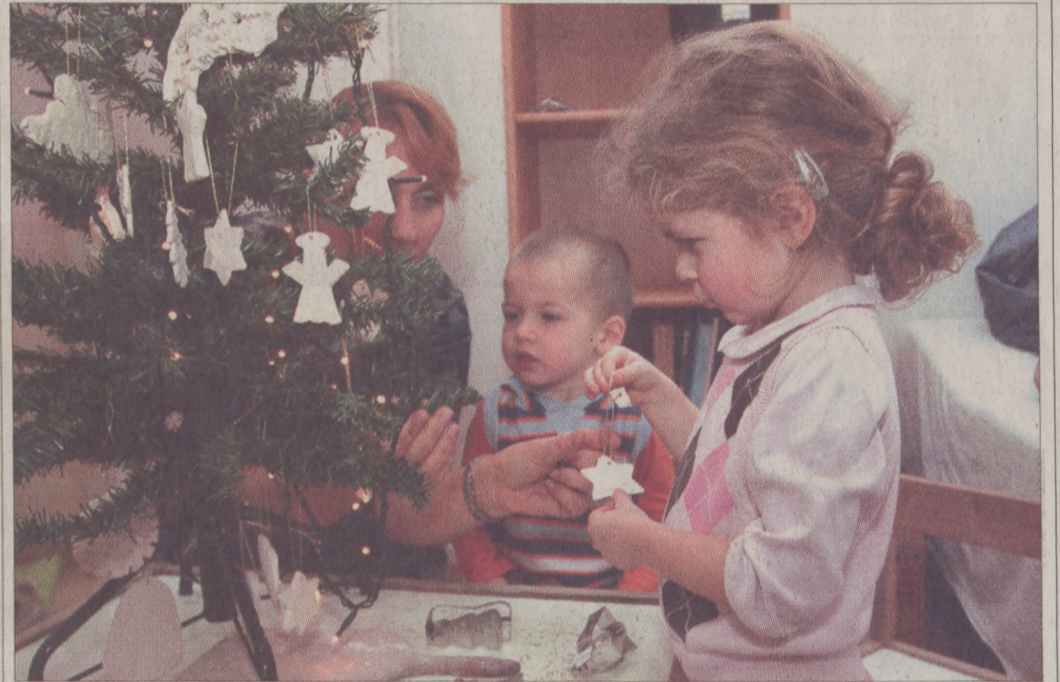
Komplex fejlesztést nyújt a kisgyermek számára a Kincs-Ó Alapítvány

– A korábbi, heti kétszeri foglalkozásokról szeptemberben át kellett térni a heti egyszeri alkalomokra, idén ugyanis az egészségügyi tárcától egyáltalán nem kaptunk támogatást és a cégek sem tudják a mostani gazdasági helyzetben anyagiakkal segíteni munkánkat; viszont a gyermekek szülei sem terhelhetők már tovább – jegyezte meg Kesz-