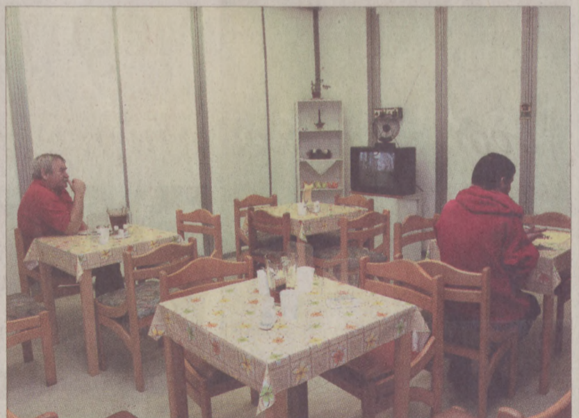
Hajléktalanok gyógyulásához nyújt segítséget az új menedékhely

A rehabilitációra váró betegeket a Batthyány téren működő orvosi rendelőlől irányítják az új létesítménybe, ahová azok kerülhetnek, akik nem igényelnék állandó szakfelügyeletet és képesek magukat önállóan ellátni. A komolyabb műtétek után lábadozókat továbbra is a Batthyány téren évek óta működő tizenhat ágas lábadozóban látják el.