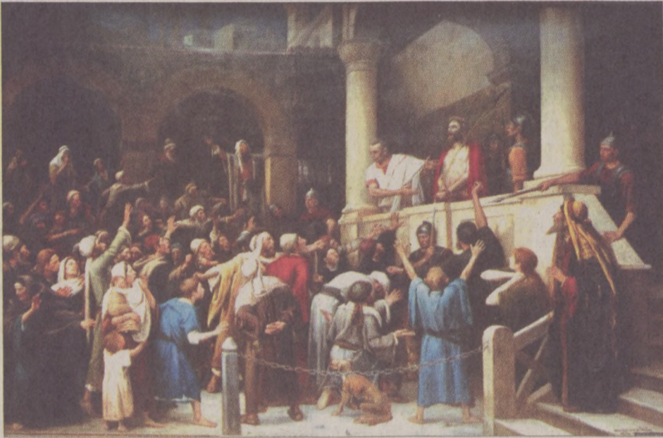
Munkácsy Mihály: Krisztus Pilátus előtt

A hazai tájak és viseletek, a nép mint romlatlan nemzetalkító erő megjelenítése ekkor, a 18. század végén, a 19. század elején vált általánossá. A század közepére ez a törekvés, a jellegzetesen magyar figurák ábrázolásában teljesedett ki. Megjelent a táncoló paraszt, a búsuló betyár – mint