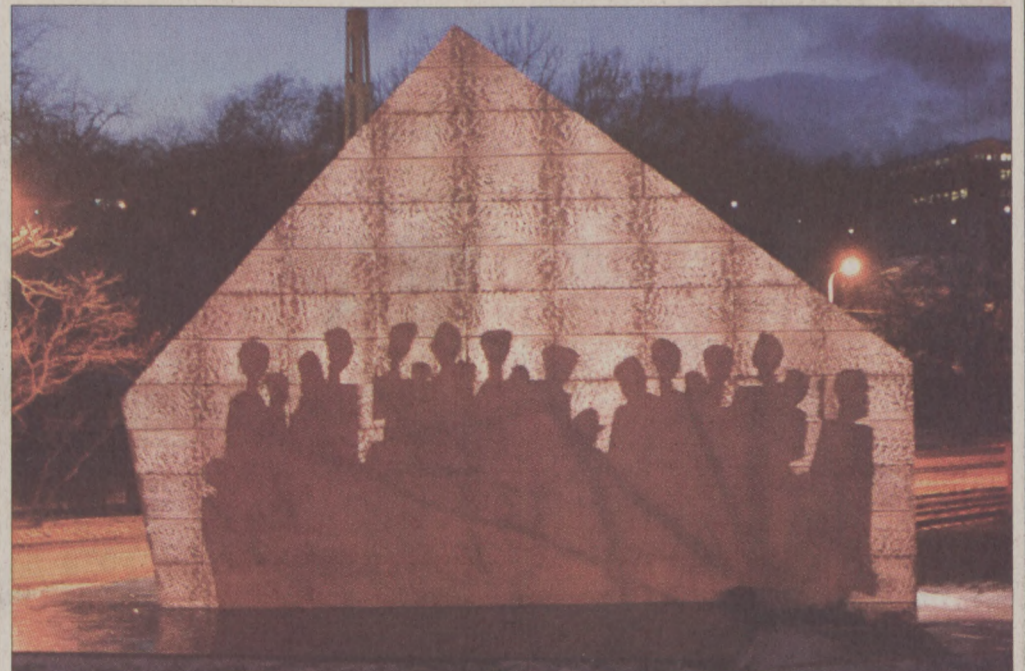
A Szarvas téren nemrég felavatott Kitelepítettek szobra is díszkivilágítást kap

Kivilágítják esténként az V. kerületi Fővám tér, a Március 15-e tér, a Károly körút, továbbá a Kálvin téri metrókijárók is „diszító jellegű” világítást kapnak. A VII. kerületi Kazinczy utcai ortodox zsinagóga is díszkivilágítást kap, ahogy a VIII. kerületi Baross Gábor szobor, a IX. kerületi Csarnok tér és a XII. kerületi Sota Rusztavelli szobor a Virányos úton.