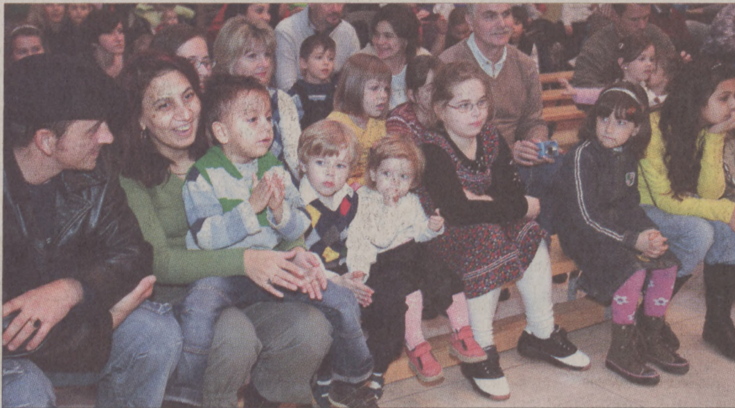
A háromgyermekes családoknál 99 ezer forinttal csökken a személyi jövedelemadó