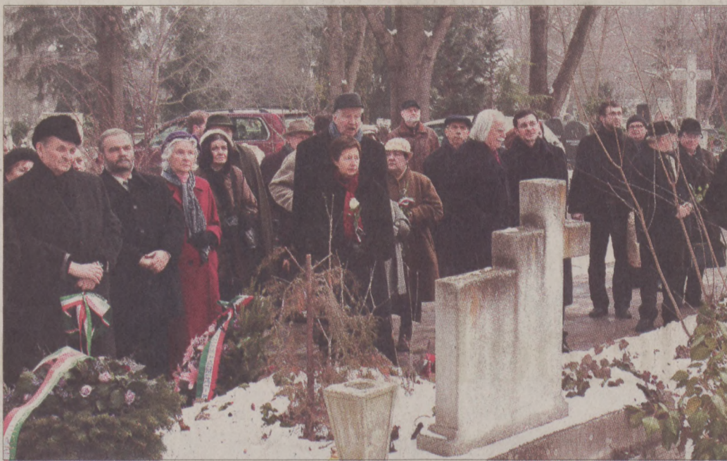
A Farkasréti temetőben rokonai, barátai és tisztelői emlékeztek a legendás könyvkiadóra