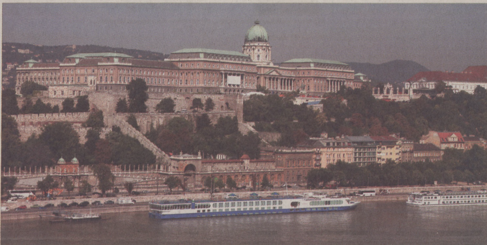
Az új Széchenyi tervhez kapcsolódó programok között a Várnegyed rehabilitációja is szerepel