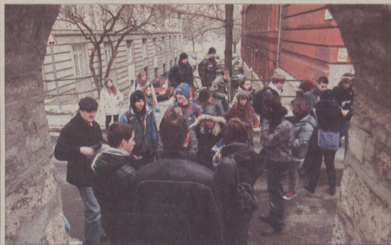
Az uniós programban résztvevő diákok a Várba is ellátogattak

A két éves nemzetközi projekt harmadik találkozására itt, a Petőfi Gimnáziumban került sor január 30. és február 4. között, melynek során a hat ország diákjai témák szerint munkacsoportokba szerveződtek. A tapasztalatsere eredményéről a budapesti projekthét végén minden csoport beszámolt, ám az igazi munka még hátravan: a megbeszélések alapján a nem-