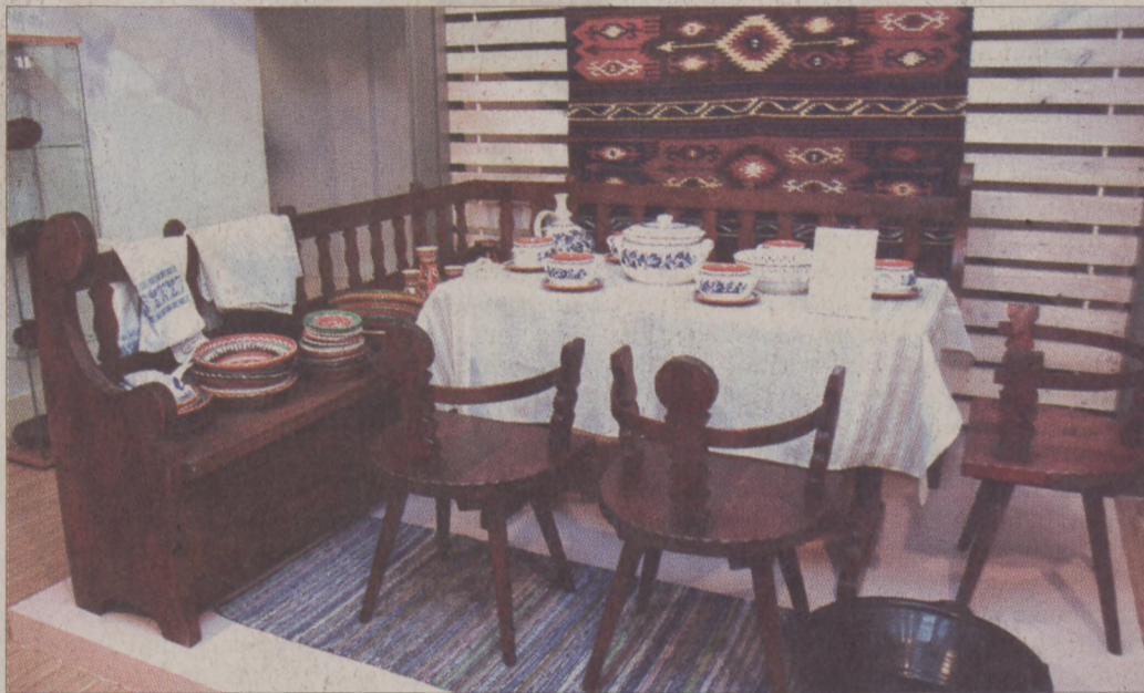
Hétszázötven négyzetméteren mutatják be népi iparművészet legszebb tárgyait

Lesznek kiállítások is, sok más mellett a Hagyo-