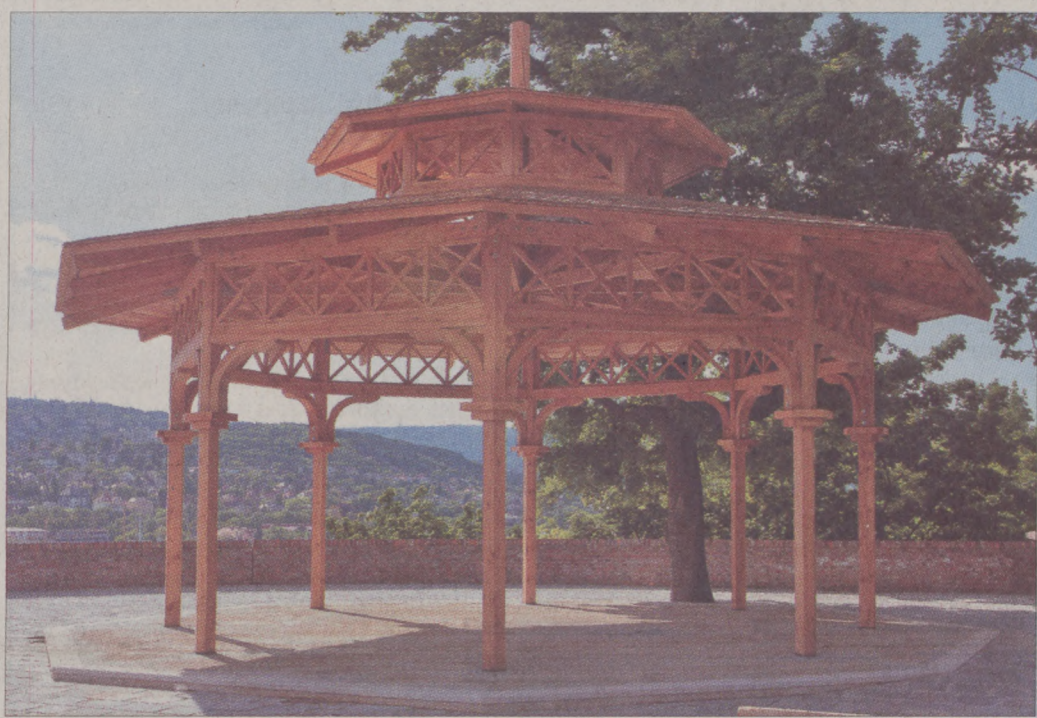
Az eredeti faszkeretű pavilon korbú mását építette vissza az Önkormányzat a Savanyúleves rondellán

A törökül Eksi as Kuleszi-nek, magyarul savanyú lének nevezett bástyát a XVII. században alakították ki, itt kapott helyet a várvédő ágyúk egy része. Buda visszafoglalása után egészen a XIX. századig a védmű része maradt, majd az 1800-as évek elején a sétányhoz csatolták. A századfordulón ezen a ponton építettek fel azt a nyolcszögletű kioszkot, amelyben vasárnaponként térzenét, illetve jótékonysági programokat rendeztek. Ötven évvel ezelőtt a kioszkot egy modern pavilon váltotta fel, ami már vendéglátó helyként működött.