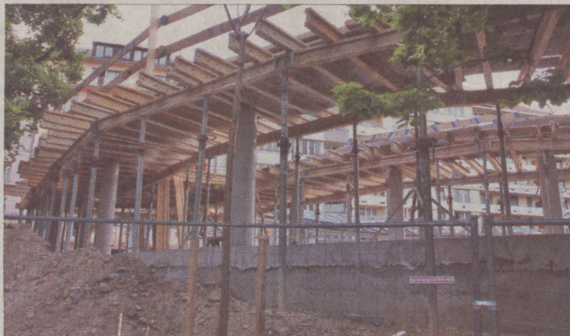
Szerkezetkész az új pavilon

felsővezetéket tartó konzol alapozása az előzetes felmérésekhez képest gyengébb. Az önkormányzat ezért úgy döntött, hogy a járókelők biztonságát szem előtt tartva saját költségén megerősíti az oszlopalapot. Csak ezt követően folytatódhatott az új, ívelt alaprajzú, acél és üveg kombinációjú elegáns épület kialakítása. A szerkezetépítéssel már végeztek, a következő lépés az üvegelemek beemelése, hamarosan megkezdődik. Az épületben újságos és egy kávézó kap majd helyet, az alagsorban kerekesszékekkel is használható nyilvános illemhelyeket alakítanak ki.