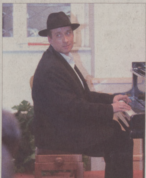
Grego formabontó koncerttel lepté meg a közönséget

Liszt nagyon szerette Beethoven, gyakran vezényelte a műveit, köztük a „kilencediket” is. Annak idején valamennyi Beethoven-szimfóniából készített zongoraátiratot, de a 9. szimfóniá-