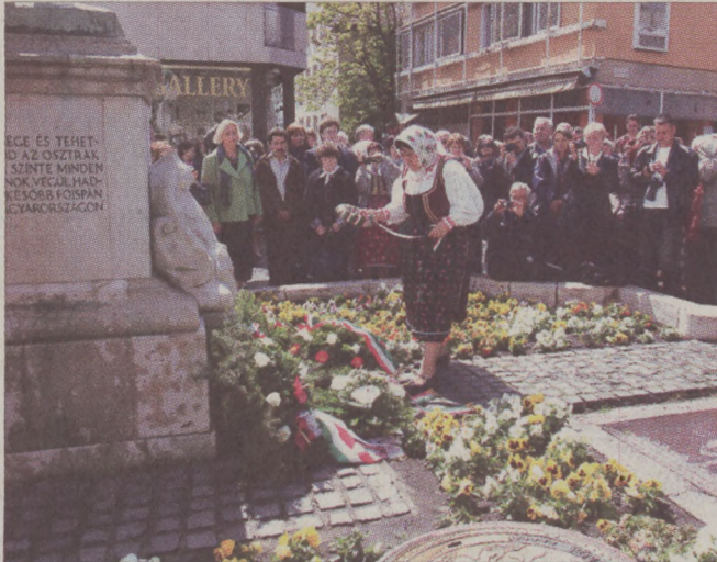
A székelymentő Hadik András szobrát virágokkal halmozták el

Egész napos kulturális programsorozattal emlékezett a bukovinai székelyek hetven évvel ezelőtti hazatérésére a Bukovinai Székelyek Országos Szövetsége. A Mátyás templomban hálaadó szentmise, a Magyar Kultúra Alapítvány székházában fotókiállítás és emléklés, Szent István szobra előtt koncertek és folklór-