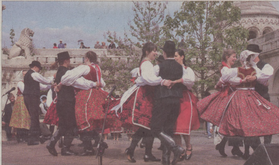
Nagyszabású folklórműsorral ünnepelték meg a hazatérés napját a hagyományőrző bukovinai néptánc- és népdalcsoporthoz a Szent István szobor mellett felállított szabadtéri színpadon