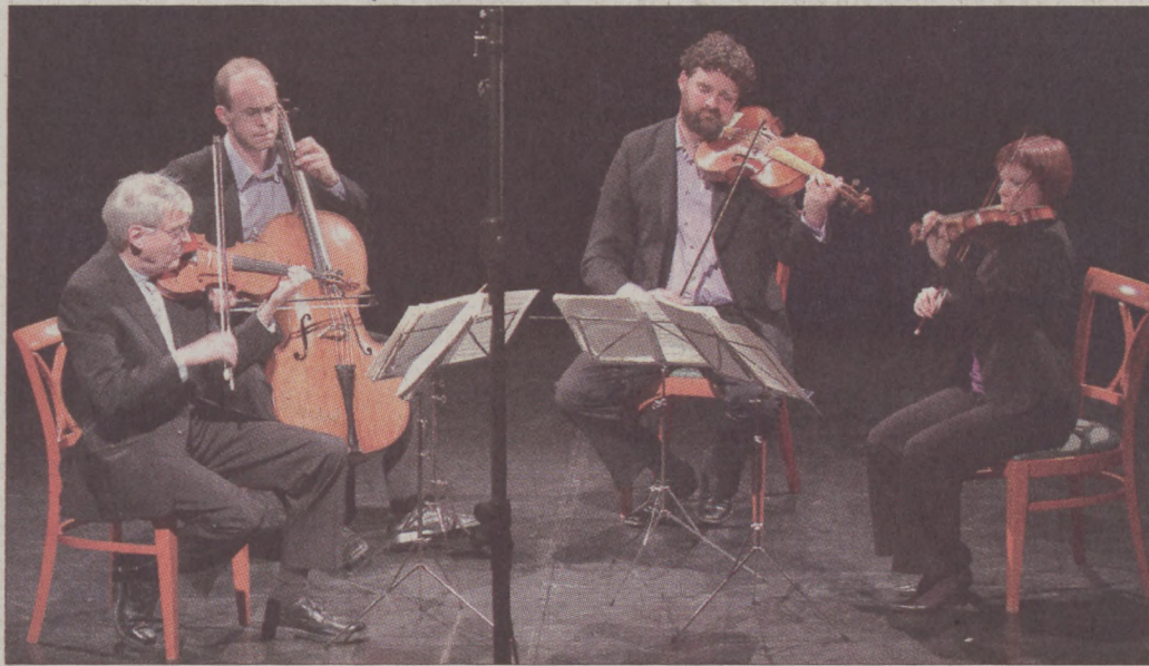
A régizene hívei a Salomon Quartetnek tapsolhattak a Nemzeti Táncszínházban

– Liszt kora gyermekkorától Beethoven búvóletében nőtt fel. „A Beethoven név szent a művészetben” – fogalmazott 1840-ben a német mester V. szimfóniájából készített zongorapartitúrájának előszavában. A Liszt által terjesztett legenda szerint Liszt egyik első bécsi hangversenyén 1823-ban Beethoven is jelen volt, és a koncert után