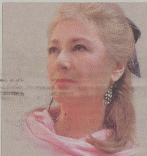
Sass Sylvia operaénekes

Nemrég mesterkurzust tartottam Rómában. A városban sétálva egyre jobban éreztem azt a varázst, amely annak idején Róma Toscajaként két éven át a bűvkörébe vont. Az Angyalvár, a Tevere