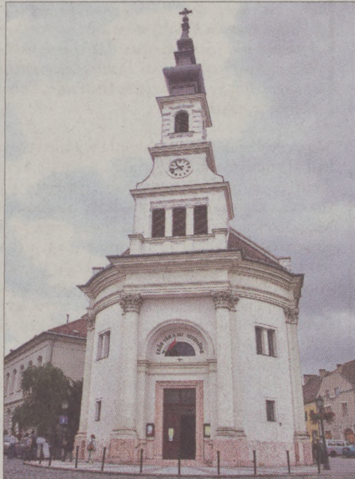
Helyi védelmet kapott a Bécsi kapu téri neobarokk evangélikus templom és paplak is

2007 októberére, az épített környezet helyi védelméről szóló rendelet megalkotása óta immár negyedik helyen helyez helyi védelem alá az önkormányzat kerületi értékeit. Helyi védelmet kapott a Bécsi kapu téri neobarokk evangélikus templom és paplak, az Uri utca 60. (Tóth Árpád sétány 34.) szám alatt található neobarokk lakóház, illetve a Várkert rakpart 16. (Döbrentei utca 22.) szám alatt lévő historizáló, neogótikus, kes-