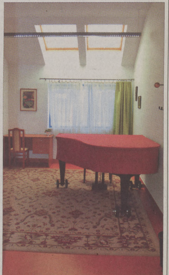
A tetőtérben zenetermeket alakítottak ki a zeneiskola számára