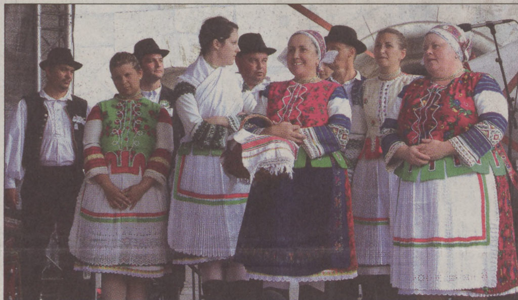
A Zoboraljáról érkezett folklorcsoport népdalokat, lakodalmas feldolgozásokat adott elő a könyvünnepe.

Tandori Dezső a tiszteletére rendezett ünnepség végén kalapemeléssel búcsúzott a közönségtől. Mint mondta, „megemelem kalapomat mind azoknak, akiket fordítani szerencsém volt, azoknak, akiktől a magyar nyelvet tanultam, s azoknak, akik segítettek abban, hogy most itt lehetek”.