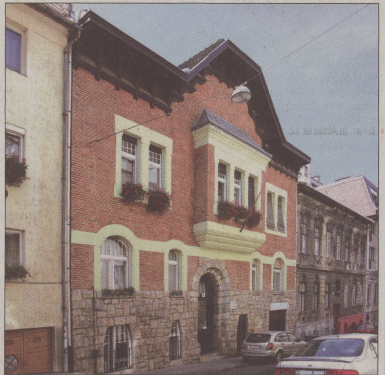
A Gellérthegy utca 13. szám alatt Ripka Ferenc egykori főpolgármester lakóházába is betekinthetnek az érdeklődők a Kulturális Örökség Napjain

A család jelenleg is gyűjti a Ripka Ferenchez, illetve egykori lakóháza-