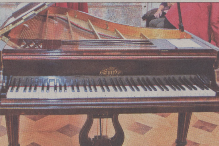
A Liszt-korabeli Erard zongora