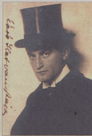
Az utolsó mecénás

Önzetlenségét Tersánszky Józsi Jenő is nagyra becsülte: „Magam részéről az ő lehetőségeivel, millióival és külsejével, valljam be, mit tennék?... időmet mulatókban, kártyatermekben herdelném, legföljebb medvedadásra ruccannék ki