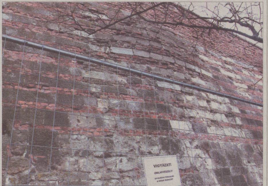
A várfal teljes felújítása több milliárd forintba kerülne

Elsősorban az alapfal állékonyságát nem befolyásoló esztétikai problémáról van szó, azonban a magasból esetleg lezuhanó falazó elemek könnyen balesetet okozhatnak, ezért az önkormányzat a hibák elhárításáig körbekerítette az érintett falszakaszokat. Ez