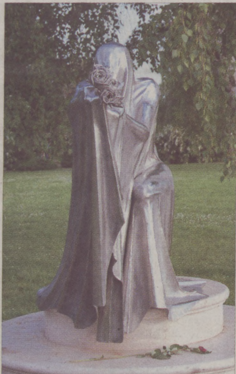
Árpádházi Szent Erzsébet - Vác