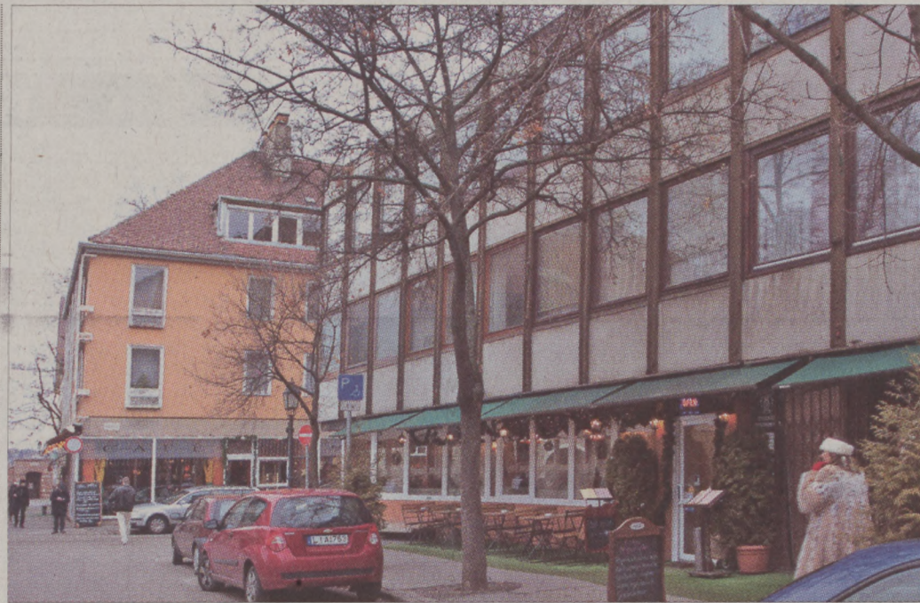
A Fehér Galamb vendéglő helyén ma a Hadik kávéház üzemel

Az üzlet jól ment, így 1912-ben sikerült megvásárolnia egy házat a közelben, a Szentháromság és az Uri utca sarkán. Itt, az alsó szinten 1856 óta működött a Fehér Galamb vendéglő; nevét a