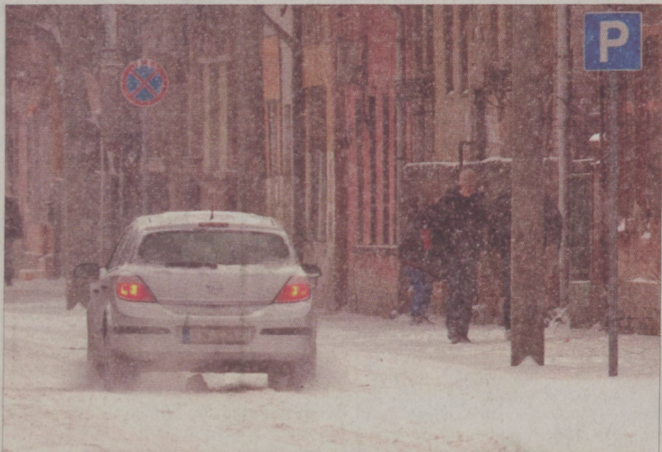
Veszélyes is lehet a dermesztő hideg és az erős havazás, mindenkitől nagyobb odafigyelést igényel

Szintén a társasház kötelessége a jégcsapmentesítés, ezt ugyanis a tűzoltóság nem végzi el az ingatlan tulajdonosok helyett. Nem jelent megoldást az előszeretettel alkalmazott „Vigyázat jégcsap és hóomlás veszély” szövegű tábla kihelyezése sem, a figyelmeztetés ugyanis nem helyettesíti a veszélyhelyzet elhárítását, azaz baj esetén a társasház nem kerülheti el a felelősségre vonást.