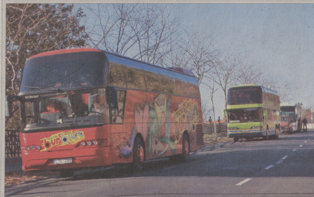
Ez végre megszűnhet

Ha támogatást nyer a Budai Vár és környéke közlekedési hálózatához kapcsolódó közösségi közlekedés fejlesztési pályázat, akkor kitéltetők a Várból a turistabuszok és megoldható lesz a Hunyadi és a Palota út tehermentesítése. A fejlesztési tervek között szerepel egyebek mellett a gépjárműforgalom korlátozása és a közösségi közlekedés korszerűsítése is. A Budavári Önkormányzat elkészítette a megvalósítási tanulmányt, amit lakossági fórumon mutattak be a Városbázán, ezt követően a Képviselő-testület rendkívüli ülésen ellenszavazat nélkül elfogadta a Budai Vár és környékének közlekedését érintő tanulmány-tervezetet.