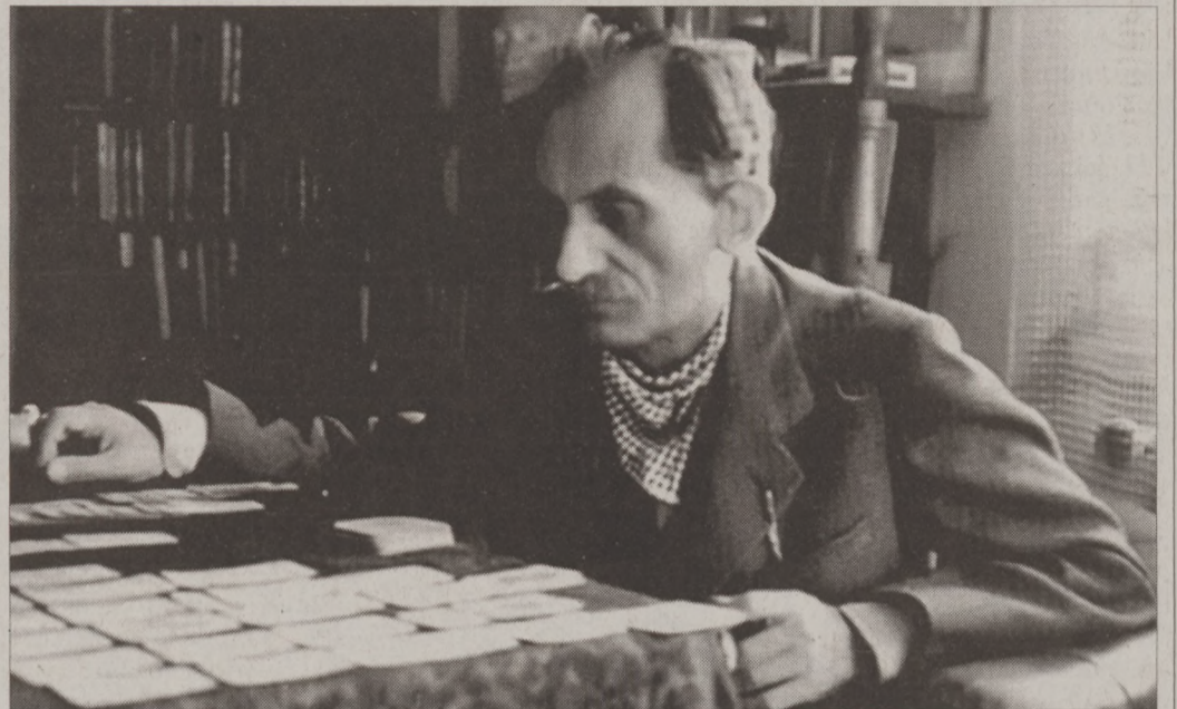
Babits irodalmi hagyatékából több fotót és első kiadású könyvet is megtekinthettek az érdeklődők

A hagyaték több különálló egységből áll, a kéziratok, autográf jegyzetek és a levelezés mellett értékes könyvanyagot is tartalmaz. Részbe többek között a Babits korai verseit tartalmazó Angyalos könyv, amely nevét a Török Szofi által a borítóra festett Vittorio Carpaccio mű másolatáról kapta.