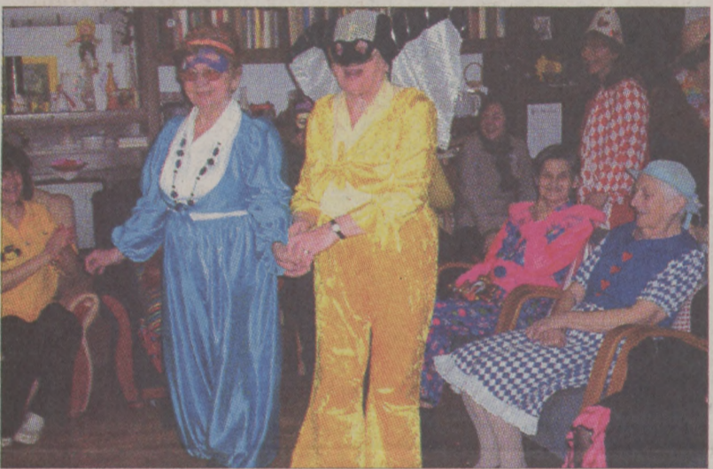
Vidám maskarások a Roham utcai Idősek Klubjában

A felvonulást és a műsort követően farsangi fánk, forralt bor, illetve tea várta a klubtagokat, majd megszólalt a zene, és elkezdődött a tánc. r.a.