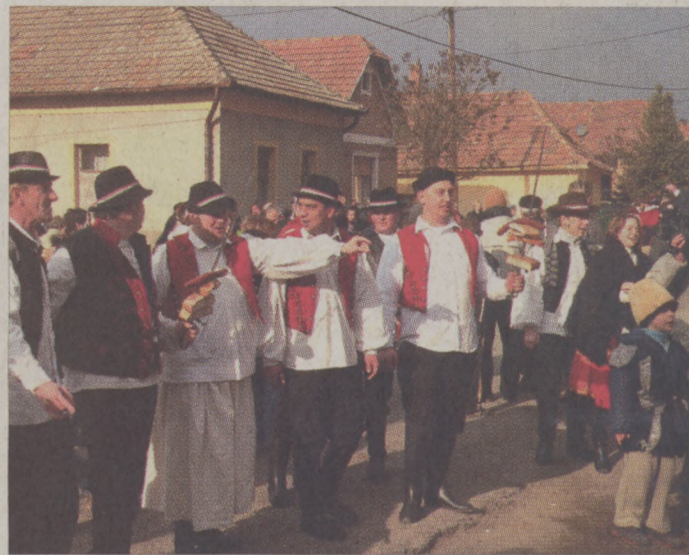
Házról házra jártak a jókívánságmondó legények

Dramatikus játékok. A farsangi szokások másik jellegzetes és ugyancsak változatos csoportját alkották a dramatikus játékok. E játékok helyszíne többnyire a fonó, tollfeszítő, disznótor volt. Világszerte, így a magyar nyelvterületen is