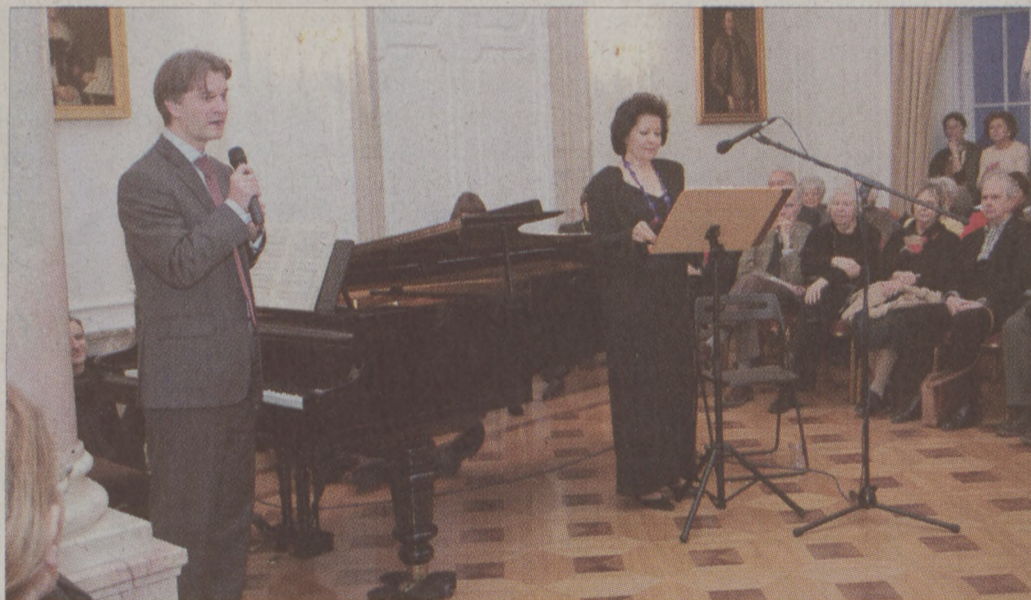
A szerelem volt a téma a Budavári Zenei Szalonban