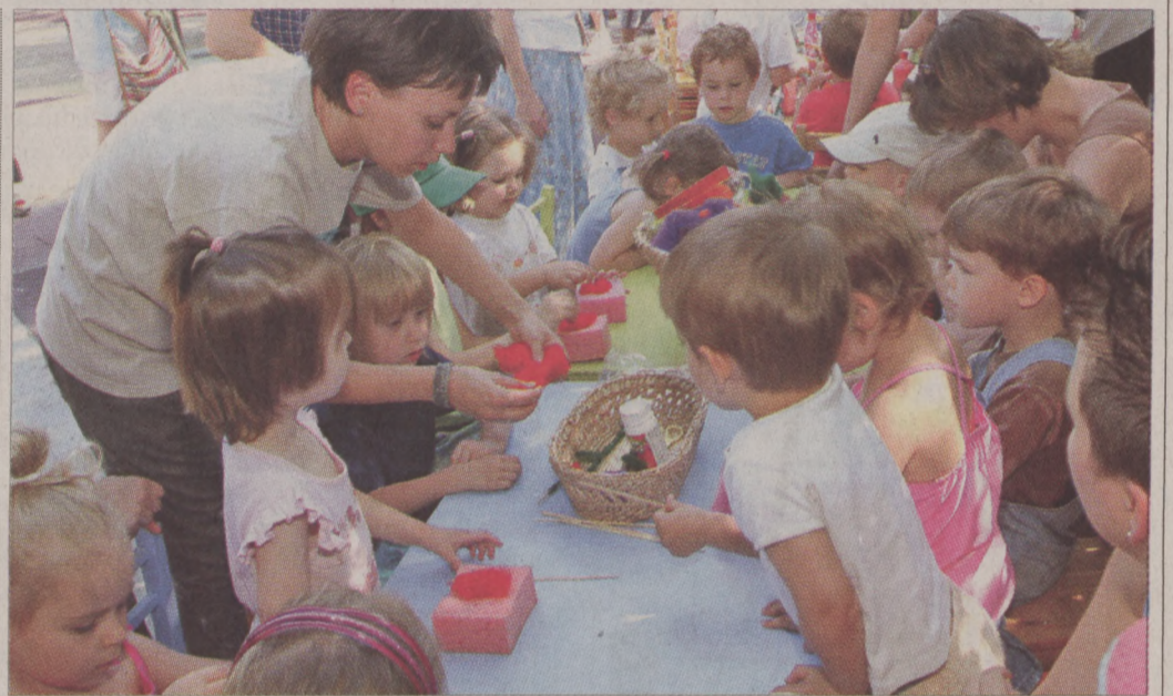
A gyerekek ezután is a megszokott intézményekbe járhatnak