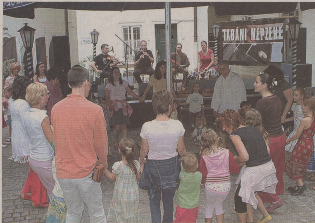
A tánc-házmozgalom idén ünnepli megalakulásának 40. évfordulóját

A tánc-házmozgalom kezdetén a négy legismertebb táncgyűjtés vetélkedett egymással. A komoly szakmai viták ellenére úgy döntöttek, rendszeresen összejönnek és egy zártkötű klubest keretében, maguk között szabadon táncolnak. Mi a