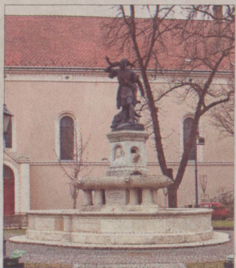
Rövidesen elkezdődik a Corvin téri kút felújítása

Tavasszal megújulnak a kerületi játszótérek is, a Mária téren a már meglévő mellé egy újabb, nagyobb gyerekek számára is használható, kétszemélyes hinta kerül és a fejlesztés részeként a játszóeszköz környezete öntött gumiburkolatot kap. A Naphegy téren, a Toldy utcában és a Mária téren az uniós szabvány szerinti felújításokat is elvégzi az önkormányzat, míg a Donáti utcai játszótéren a gyerekek által elszeretettel mászásra használt, lépcsőszerűen kialakított akácronkós támfal egy részét cserélik ki. Új fitness sporteszközöket is kihelyeznek a játszótérekre. A cél az, hogy az erősítésre, nyújtásra és lazításra egyaránt használható modern gépekkel, a kisgyerekekkel a játszótérre érkező szülőket is megmozgassák.