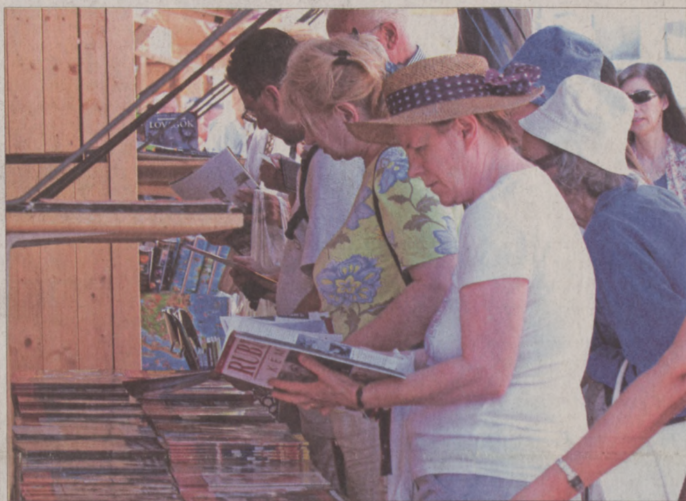
Idén is számos könyvkiadó újdonságaiból válogathatnak majd az érdeklődők

A nyitónap estéjén az Operettszínház művészeinek jóvoltából Huszka Jenő műveiből csendülnek fel az ismert dallamok. Huszka a magyar operettmuzsika egyik klasszikusa, akinek nyomán világhírvé vált a magyar operett. Szombaton este az idén 60 esztendő Rajkó Zenekar lép a közönség elé, az együttes tagjai az évszázados hírű cigányzenész-dinasztiák ősi zenei tehetségét és hagyományait őrzik. Vasár-