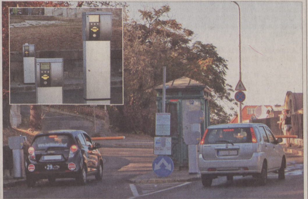
Az új rendszámfelismerő rendszerrel csökkenthető a Várba engedély nélkül behajtó gépkocsik száma

Mindezek miatt szükségessé vált egy új rendszer kiépítése, amely várhatóan az év végére készül el teljes egészében. A folyamatos átállási, építési időszak alatt a behajtási rendszer tesztüzem-módban működik, a Budavári Kapu Kft. a zökkenőmentes működés érdekében a kapukhoz kezelőszemélyzetet biztosít, akik segítik a ki- és a behajtást. A kiépülő új rendszerrel a Várnegyed színvonalához minőségben, technikában és kezelhetőségben is méltó rendszer jön létre, amely hosszú távon biztonságosan üzemeltethető. Lényege az a professzionális rendszámfelismerő rendszer, amely valamennyi ki- és behajtó autót