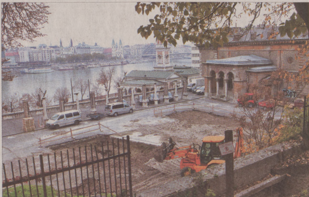
A beruházási területen jelenleg az előkészítő munkálatok folynak

Az engedélyeztetési eljáráshoz szükséges régészeti feltárás második üteme – 1998 és 2000. között már dolgoztak a területen a Budapesti