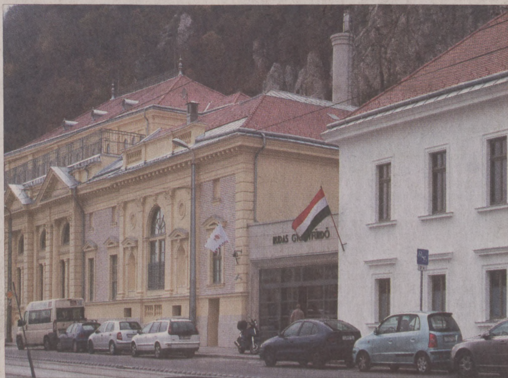
A homlokzat felújításán kívül a fűtést, a szellőztetést és a világítást is korszerűsítették a fürdőhöz tartozó épületekben

közi terület egykor utca volt. Ma már ez a folyosó nem szétválasztja, hanem összeköti a két épületet: az előcsarnokban egy új büfét is kialakítottak, amit a fürdőben tartózkodók, illetve a fürdő területén kívül várakozó vendégek egyaránt használhatnak. A mintegy félmilliárd forintos beruházást 393 millió forinttal támogatta az Európai Unió Európai Regionális Fejlesztési Alapja.