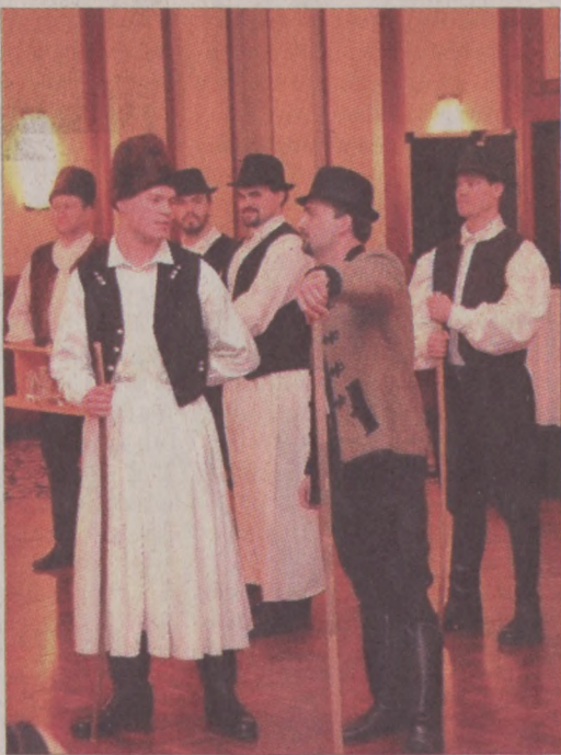
Advent első vasárnapján a Bartók Néptáncgyűttes lép fel

Kevésbé ismert a Bölcsőcske nevű betlehemes játék, amelynek bemutatására kerülő részlete Mária és József szálláskeresését jeleníti meg. Szereplői lányok, egyikük Mária, aki a bölcsőt vitte, a többiek az angyalok, akik gyertyával kísérik. Ezt követően a Bartók Néptáncgyűttes tagjai az udvarhelyszéki regölés változatot mutatják be. E szokás értelmében, a faluban karácsonykor, újévkor a „Haj regő rejtem” szerencsekívánót köszöntéssel jártak házról házra.