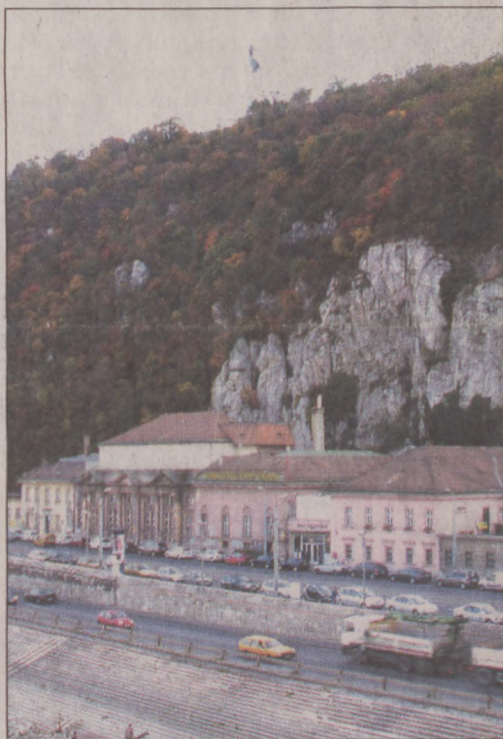
A Rudas fürdő a rekonstrukció előtt

Véget ért egy több mint tíz éve tartó rekonstrukciós program a Rudas fürdőben. Az idén tavasszal indult beruházási szakasz keretében a homlokzatot és a tetőszerkezetet az 1800-as évek végi állapotnak megfelelően felújították, az épületet akadálymentessé tették, korszerűsítették a fűtési, a szellőztetési és a világítástechnikai rendszereket, az ablakokba pedig a legmodernebb hőálló üveget szerelték be. A megszüpült előcsarnokban felszedték az oda nem illő metlachi-lapokat, amelyek helyére elegáns, szürkés színű gránit került – utalva arra, hogy az uszoda és a gőzfürdő