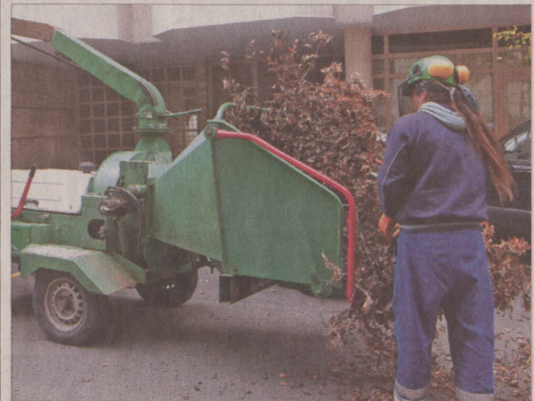
A lakók kérésére idén is szerveztek ingyenes gallyaprítást

Az év tizenkét hónapjában zajlanak a kerületi kezelésű közterületeken a park- és fasorfenntartási, valamint növényvédelmi munkák. Ennek keretében az utóbbi időszakban a fák, cserjék szokásos rend szerinti ültetése mellett, a napos játszóterekre, többek között a Donáti utcába és a Bérc utcába kellemes árnyékot adó, nagyméretű növényzetet, elsősorban kórist és hárs