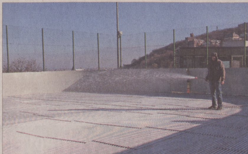
Készül a korcsolyapálya a naphegyi Oxygen Wellness Központban

Januártól további óra- és bérlettipusokat, valamint szezonális akciókat kínál a központ. Továbbra is igénybe vehető az Oxygen Medical és Wellness által végzett életmód felmérés és orvoslás. Ez a Magyarországon még egyedülálló szolgáltatás kitűnő eszköze a prevenciónak, de meglévő alapterületek (például cukorbetegség, magas vérnyomás, mozgásszervi problémák vagy elhízás) esetén is jelentős javulást eredményezhet.