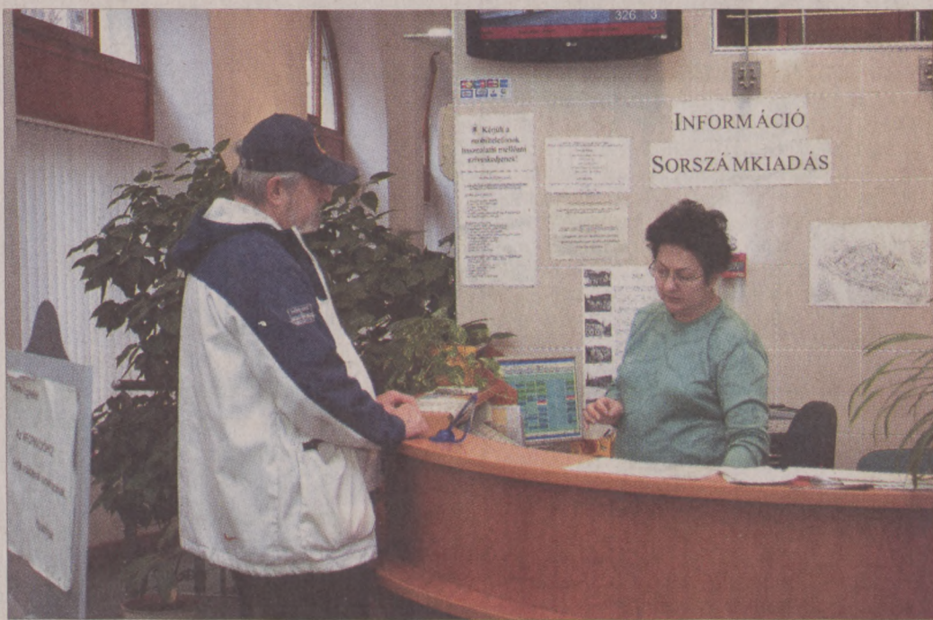
Január 1-től az Attila úton, a jelenlegi okmányirodában várja az ügyfeleket az I. kerületi hivatal (járási hivatal)

Az okmányirodai ügyeken kívül a gyámhivatal által ellátott feladatok, a jegyzői gyámhatósági feladatok, valamint egyes építésigazgatási és szociális feladatok kerülnek át a január 1-jével megalakuló kerületi hivatalhoz. Az új hivatalhoz kerülő szociális feladatok körébe tartozik az egyes juttatások – az időskorúak járadéka, az alanyi és normatív közgyógyellátás, az egészségügyi szolgáltatásra való jogosultság, továbbá a súlyosan fogyatékos, fokozott ápolást igénylő súlyosan fogyatékos illetve a 18 év alatti gyermek gondozásáért igénybe ve-