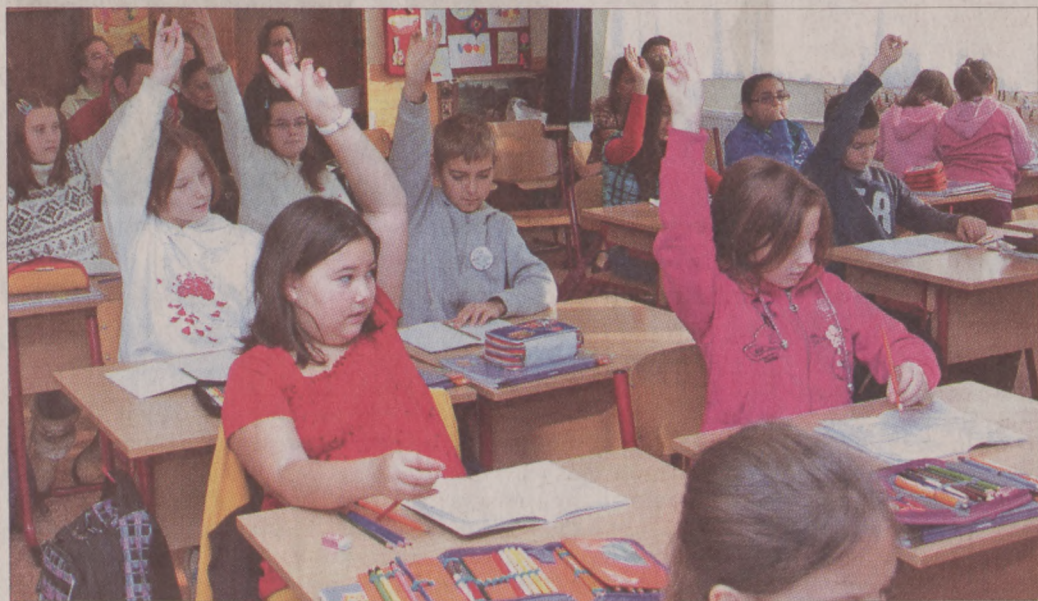
Jövőre az állam veszi át az iskolák szakmai irányítását

Az eredményhirdetéssel nem ért véget a program, a pályaműveket ugyanis tavasszal a FÖKERT megvalósítja. Hogy ez valóban így legyen, a tervek alapján már most elkezdtek a szükséges növények termesztését.