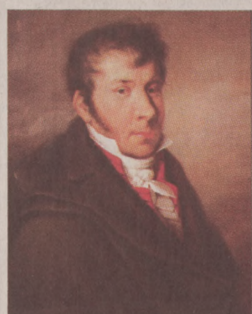
Johann Nepomuk Hummel

zé helyezik őt. Így zeneszerzői és zeneoktatási munkássága kézen fogva jelenik meg a koncerten: az emberi énekhang és a kóruséneklés az együttzenélés legegyszerűbb és talán legrövidebb módja, az elmúlt évek alatt egyre inkább lejáratos és elhanyagolt kodályi szellemiség alapja.