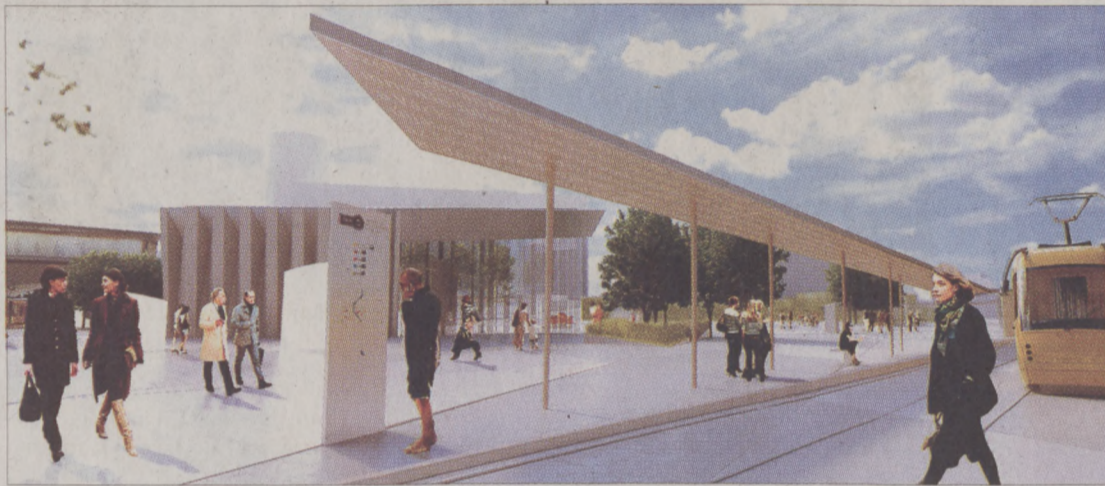
Az üvegfalú metrólejáró minden oldalról megközelíthetővé válik (látványterv)