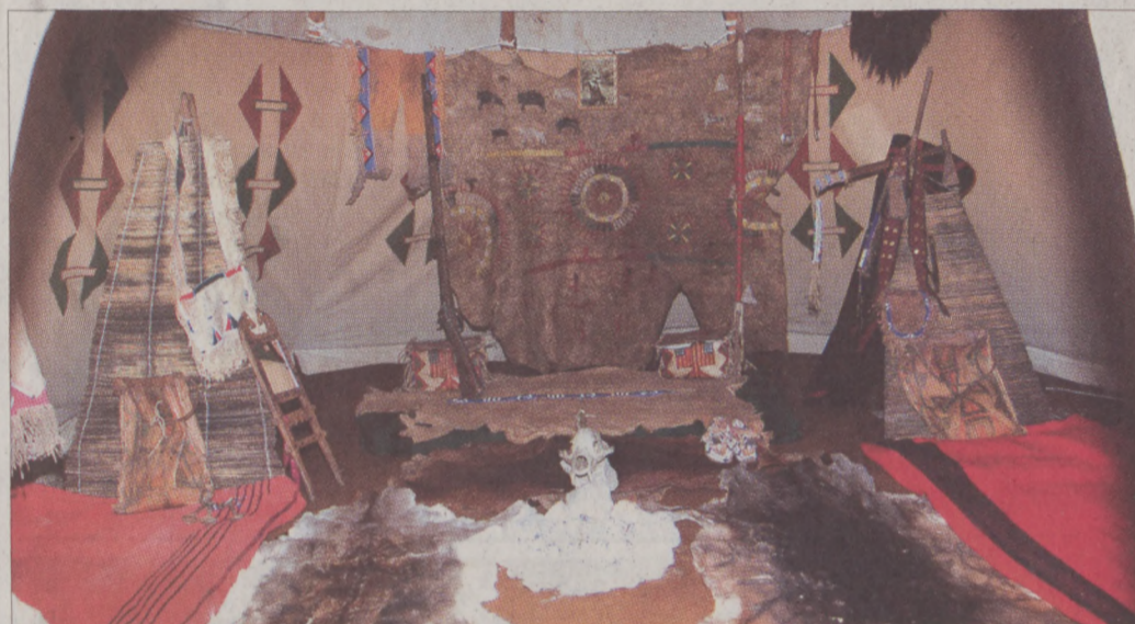
Az archívum egyik jellegzetes darabja az indián sátor