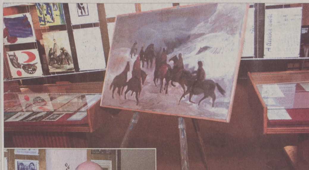
A kották mellett Cseh Tamás rajzait és festményeit is megtekinthették a látogatók a kiállításon