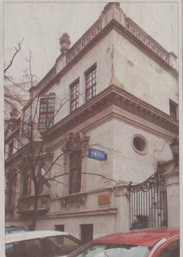
Továbbra is az önkormányzat üzemelteti a Maros utcai szakrendelőt