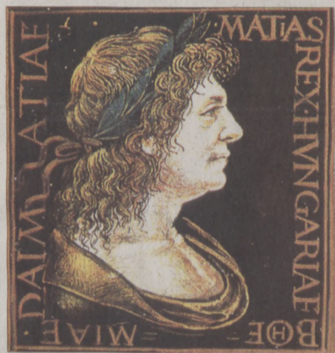
Mutasd be a kedvenc Mátyás-mesédet!

Hunyadi Mátyás születésének 570. és megkoronázásának 555. évfordulója alkalmából a Budavári Önkormányzat rajzpályázatot hirdet kerületi általános iskolásoknak „Mátyás király meséi” címmel.