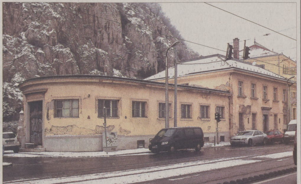
Az épületegyüttes déli részét is felújítják

A fejlesztés, melyhez az elvi építési engedélyt már megszerezték, mintegy 1 milliárd forintba kerülne. A vezérigazgató elmondása szerint ennek felét társaságuk saját erőből elő tudja teremteni, a másik feléhez azonban állami támogatást várnak. Ha a beruházáshoz három hónapon belül megkapják a szükséges támogatást, 2014 őszére elkészülnének a tervezett beruházások.