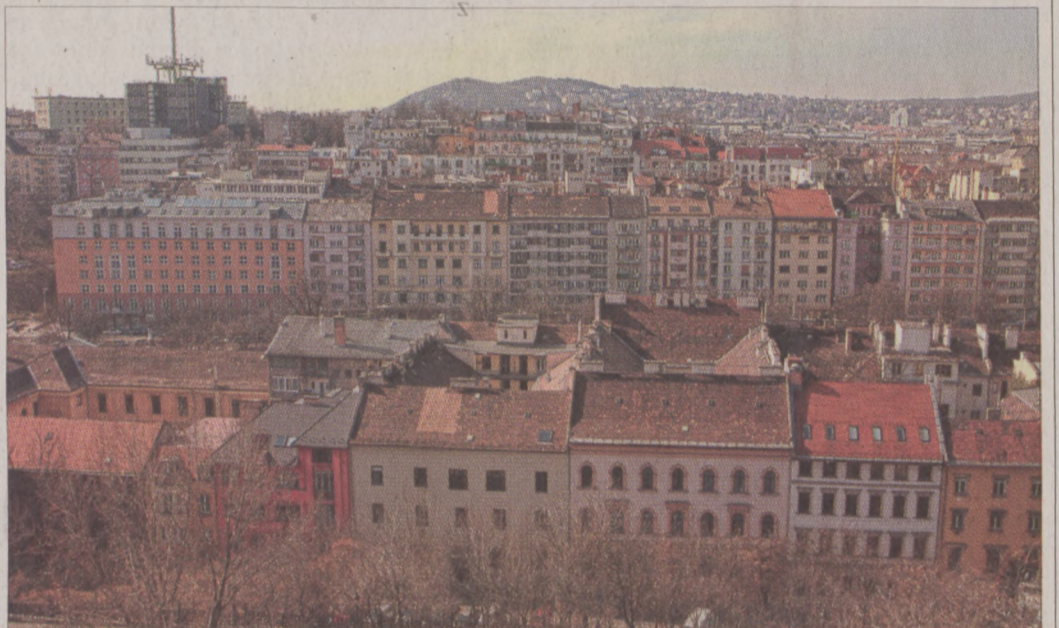
Idén is támogatja az önkormányzat a társasházak felújítását

Händel 1741 augusztusától foglalkozott a téma megzenésítésével, és mindössze huszonegy nap alatt készült el vele (igaz, saját korábbi műveiből is kölcsönzött részeket). Ezzel a darabbal kívánt bemutatkozni Dublinban, ahová Devonshire hercege, Írország kormányzója a helyi kórház és más intézmények javára történő jótékonysági előadás-sorozatra hívta. Händel 1742. április 13-án, a Neal's Music Hall-ban mutatta be művét. A Messiás szövegét Charles Jensens angol költő állította össze. Virágvasárnap korabeli hangszereken csendül fel az oratórium. A kórust és a zenekart Vashegyi György művészeti vezető, karmester dirigálja. A belépés mindkét hangversenyre ingyenes.