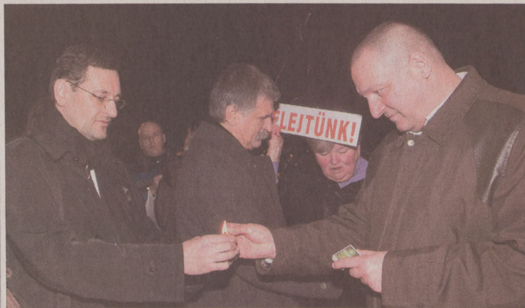
Nagy Gábor Tamás polgármester, Kövér László házelnök és Németh Szilárd Csepel polgármestere a megemlékezésen

Február 25-én este több ezren - köztük az Országgyűlés és a Budavári Önkormányzat képviselői - zárandokoltak el a Lánchíd budai hídfőjéhez, hogy leróják kegyeletüket a kommunista terror áldozatai előtt. A híd két oldalán, a felsőrakparti sétány kórkolójánál meggyújtott mécsesekkel az emlékezők nyomatékosították: a nemzetellenes bünteteket az idő sem homályosíthatja el.