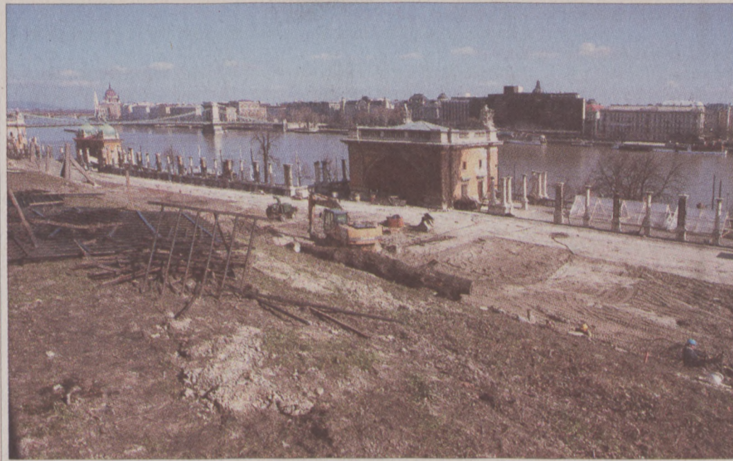
Június végéig fejeződik be a föld kitermelése és elszállítása a leendő mélygarázs és rendezvényterem területén

gyalások kezdődtek a feltételeket elfogadó Foundation Kft-vel. Az egyeztetésének eredményeképpen egy olyan, új feltételrendszer alakult ki, amely meglehetősen távol állt az eredeti pályázatban szereplőtől.