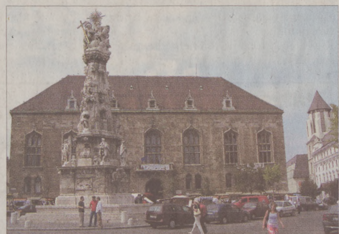
Az eredeti Szentháromság szobor Bernardo Feretti alkotása

Bár a szobor fontos szerepet játszott az egyházi ünnepségeken, az 1709-ben ismét kitört járványtól rettegő budai polgárok úgy döntöttek, hogy egy nagyobb fogadalmi oszlopot emelnek a térre. Kezdetben ezen is Feretti dolgozott, ő azonban egy évvel később meghalt, így a munkát Philip Ungleich kapta meg. 1713-ban szentelték fel az új szobrot, ám kisebb munkákat még a következő években is végeztek rajta. Ennek oka, hogy fo-