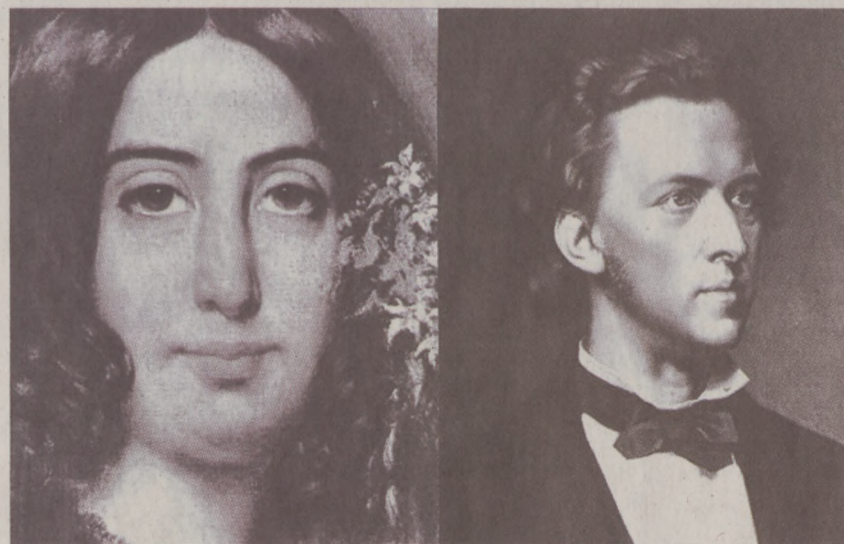
George Sand és Frederich Chopin portréja

Liszt Ferenc Chopin személyiségéről is érzékletes portét vázolt fel, hangsúlyozva, hogy mindaz, ami durva és vad, ellenszenvvel hatott rá. Keveset beszélt és ritkán figyelt mások beszédére. A versekre azonban figyelt, Heine és több lengyel emigráns költő – akiknek nem ritkán a szomorúság és a lemondás jelent meg a soraikban – megihlették a zeneszerzőt. Számos darab született e költeményekből. Frederich Chopin hiába kérték, sohasem akart operát írni. A romantikus történeteket azonban megtaláljuk a c-moll és f-moll noktürnjeiben.