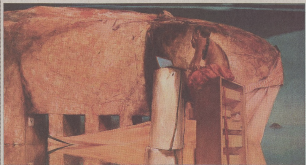
Ince Mózés: Kapcsolat nélkül

A kiállítás megtekinthető május 31-ig, keddtől szombattig 11.00-18.00 óra között. A Várnegyed Galéria elérhetősége: I., Batthyány u. 67.