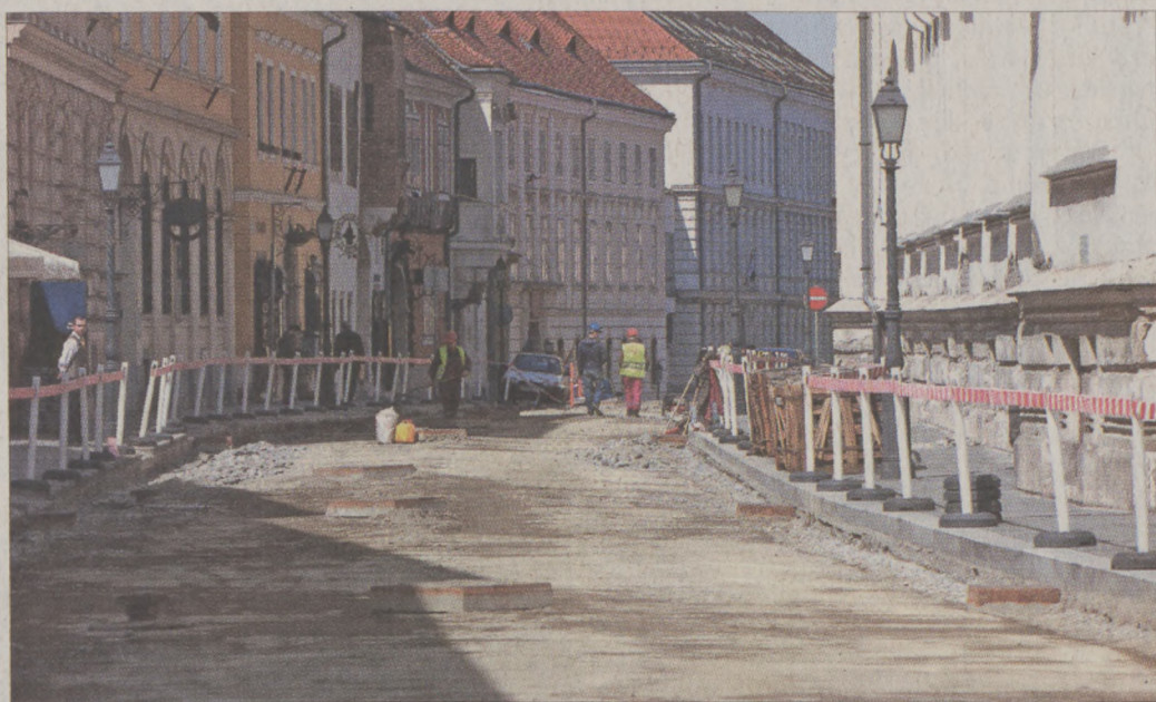
Az útpálya teljes szélességében kicserélik és újrarakják a köveket

A jó munkához idő kell – tartja a mondás, ez azonban, úgy tűnik, nem állja meg a helyét a budavári útpálya-felújításokkal kapcsolatban, amelyek tavaly tavasszal indultak el a főváros megbízásából. Hiába töltötték el a főváros megbízásából kialakításával, az nem bírta a buszok terhelését, a frissen lerakott kövek kifordultak a helyükről. A hibát a Bécsi kapu téren és a Nándor utcában már az elmúlt év során kijavította a kivitelező Penta Kft., az Országház utcában viszont most, április elején kezdték el a garanciális javítást.