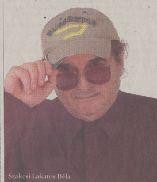
Szakcsi Lakatos Béla

A komolyzenei dzsessz-improvizációk mindkét műfaj népszerűsítését segítik. A közönség szem- és fültanúja annak, hogy miként alakul át a dallam és a stílus. Lehet, hogy furcsán hangzik – hiszen elsősorban muzsikusként vagyok és nem komponista – de én minden nagy zeneszerzővel közösséget érzek, hiszen Beethoven, Liszt és Chopin is híres volt az improvizációs készségéről. Biztos vagyok benne, hogy a műveik alapján készülő improvizáció nekik is tetszene. Dohnányi Ernő annak idején nem vett