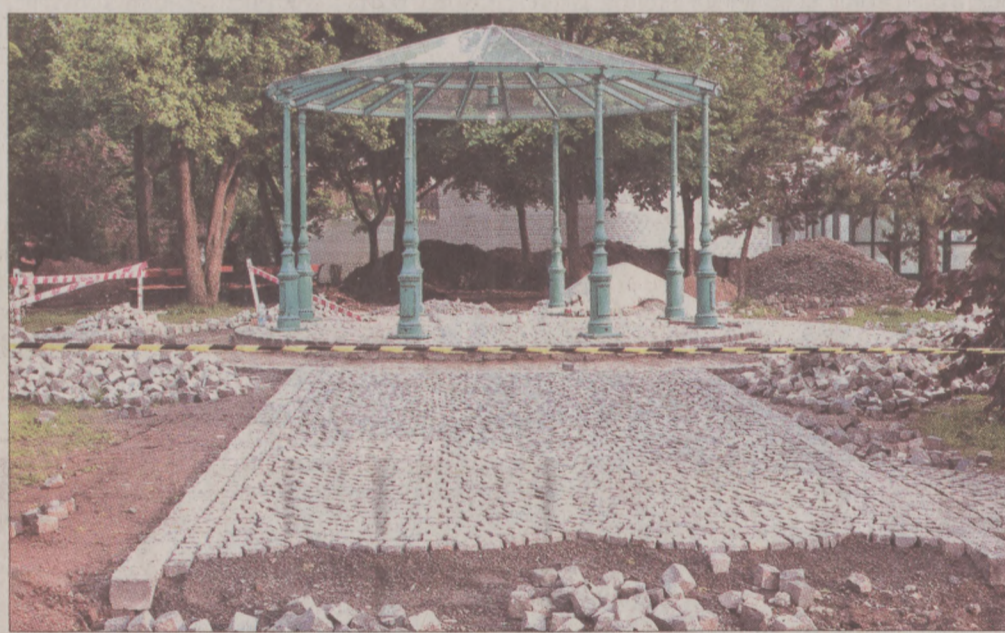
Bazaltkőre cserélik a gyöngykvacsokat a Szentháromság téren. Ezzel a nyárra tovább szépül a közkedvelt idegenforgalmi csomópont, s a zenepavilon és az üzletek is könnyebben lehet megközelíteni.