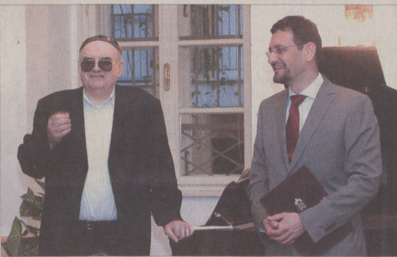
Szakcsi Lakatos Béla zongoraművész dr. Nagy Gábor Tamás polgármester köszöntötte

Szakcsi Lakatos Béla közel kétórás koncertjén a legnépszerűbb Beethoven műveket idézte fel. Szinte elmaradhatatlan baseball sapkáját ezúttal ünnepi fejedőre cserélte. Saját improvizációit az eredeti darabok, illetve részletek lejátszása után, az ismert dallamsorokhoz kötötte. Egy könnyed dallal indított, majd az V. (Sors) szimfónia zongoraátírata következett, amelyben tételről tételre variálta a klasszikus zeneszerző muzikáját. Az eredeti kotta mellett mindig készenlétben volt az előre lejegyzett improvizációs vázlat is.