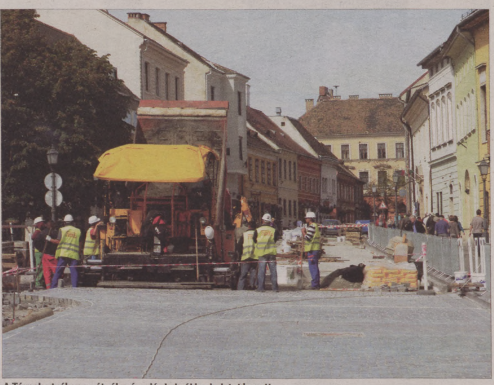
A Tárnok utcákon az útpálya és a járda is új burkolatot kapott

Csatlakozva a főváros útfejlesztési programjához a Budavári Önkormányzat kicseréli a vári járdák burkolatát, valamint saját beruházásában elkészíti a Szentháromság tér és környékének közterületi fejlesztését. A Tárnok utca teljes szélességű átépítésének első üteme szeptember második felében befejeződött, jelenleg az útpálya bal oldalán, illetve az ehhez csatlakozó járdán zajlanak a munkálatok.