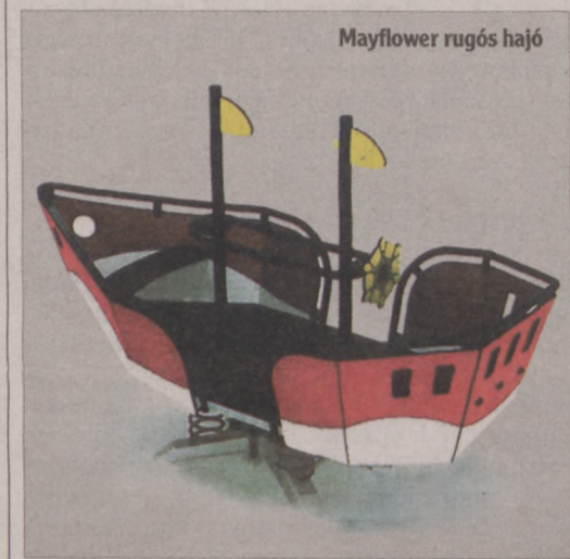
Mayflower rugós hajó