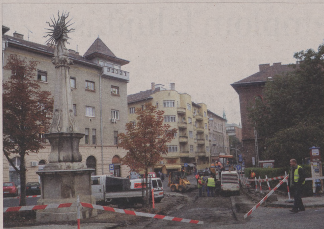
A Rumini játszótér építésével párhuzamosan pihenő és sétalórészt alakítanak ki a Mária szobor környékén

Szeptember végére elkészül a kerületi fenntartásban lévő játszótérekben a játszóelemek felújítása, egyes játékok köré pedig öntött gumiburkolat kerül.