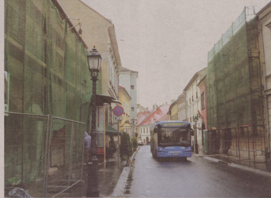
Az Uri utcában több műemlék épületet is felújítanak

A nagyszabású vári lakóház rekonstrukciós program keretében már elkészült a Móra Ferenc utca 2/a tetőszerkezetének felújítása, a beruházás részeként az épület a Várban megszokott antikolt hódfarkú cseréphéjazatot kapott. A nyár folyamán elkezdődött az Uri utca 58. átfogó renoválása, amelynek keretében a házasságkötő teremnek is otthont adó évszázados épület utcai és udvari homlokzata, illetve belső udvara és tetőzete két részletben újul meg. Ennek során a díszítő kőelemek, a kapu feletti címer és a fali szobrok restaurálása is megtörténik.