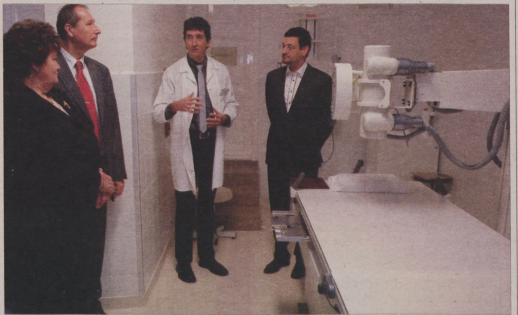
Korszerű berendezések és felújított vizsgáló várja a betegeket a radiológián

„Amikor orvoshoz megyünk elvárjuk, hogy mindent megtegyenek értünk. Az önkormányzat ehhez a jogos kívánsághoz járul hozzá, amikor nem csupán fenntartja, hanem fejleszti, modernizálja a kerület szakrendelőjét és egészségügyi intézményeit” – hívta fel a figyelmet dr. Nagy Gábor Tamás polgármester, hozzátéve, hogy a mostani fejlesztés egy jól átgondolt stratégia újabb fejezete. Az önkormányzat ugyanis a kisebb, de biztos lépések politikáját folytatja, hiszen nem tud egyszerre