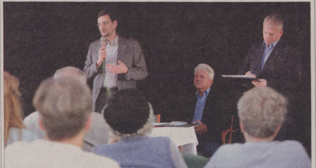
Időseknek tartottak közbiztonsági fórumot a Budavári Művelődési Házban

Bizakodásra adhat okot ugyanakkor, hogy harminchégy esetben - részben az otthoniak érélyes fellépésének köszönhetően - meghiúsult a bűncselekmény. A trükkös tolvajok általában nem erőszakosak, óvakodnak attól, hogy valaki tanúja