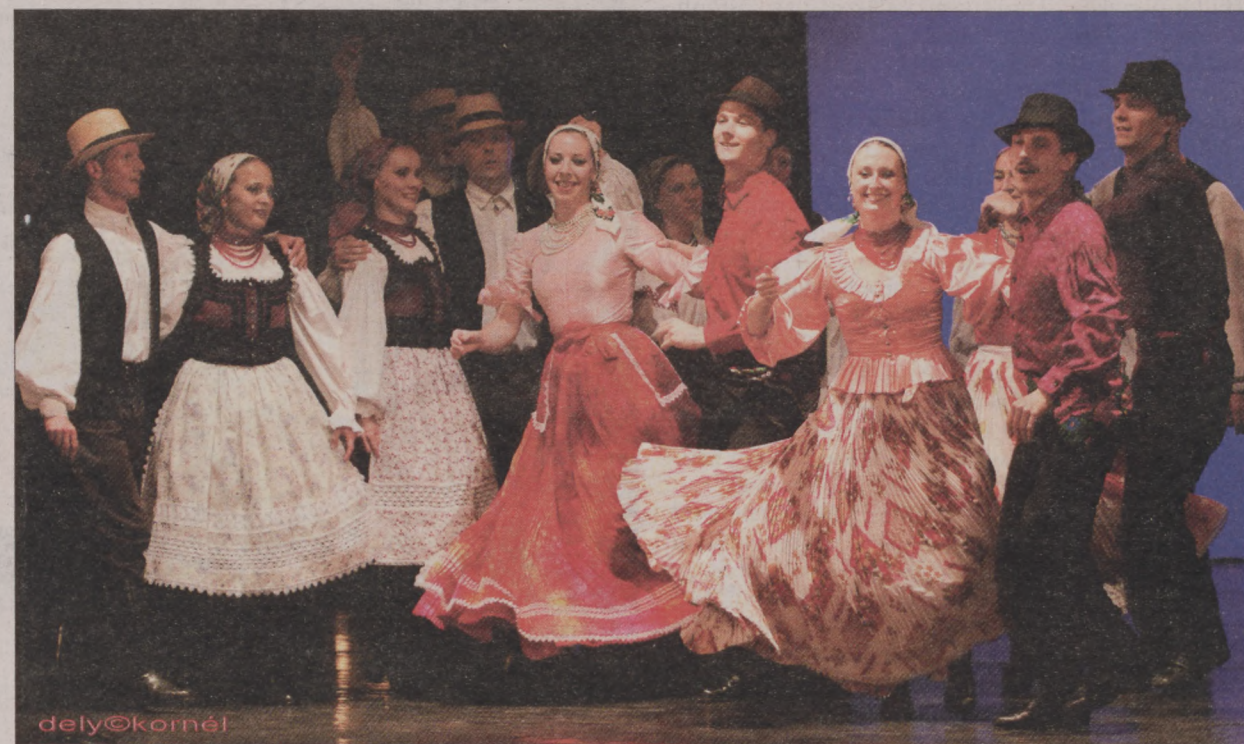
Észak-Amerika hetven városában mutatta be műsorát a Magyar Állami Népi Együttes

A Magyar Állami Népi Együttes tánc- és zenekara most már ismét itthon játszik: február 25-én és 26-án a Hagyományok Házában az itthoni közönségnek is bemutatják az Amerikában sikerre vitt Magyar rapszodiát. A produkció – ahogy az alkotók fogalmaznak – „nem csak művészi élmény, virtuóz látványosság, megérintő líra, mely érzelmeiket kiváltó zenei gazdagság, hanem a néptáncos-népzenei hagyományokat tisztelő, de abban új lehetőségeket látó és kereső előadás, mely által az a modern ember érzelmeinek, gondolatainak, egyéni vagy közösségi identitásának kifejezőeszközévé válhat. Az előadás üzenete pedig segíthet abban, hogy a 'ma embere' ne gyökértelen, számkivetett, érzelmeitől, hagyományaitól megfosztott túlélő legyen a XXI. század kopárra fűsült szigetén.”