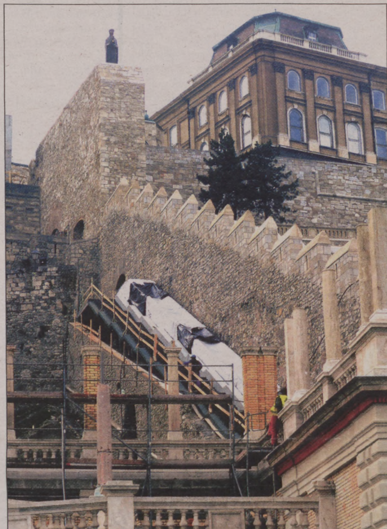
Helyére emelték a mozgólépcsőt, amelyen a Várkert Bazárból a Várba lehet majd felmenni

A szakmai konferenciák sorát az MTA Bölcsészettudományi Kutatóközpont Művészettörténelmi Intézete, Budapest Főváros Levéltára, a BME Építészettörténelmi és Műemléki Tanszéke,