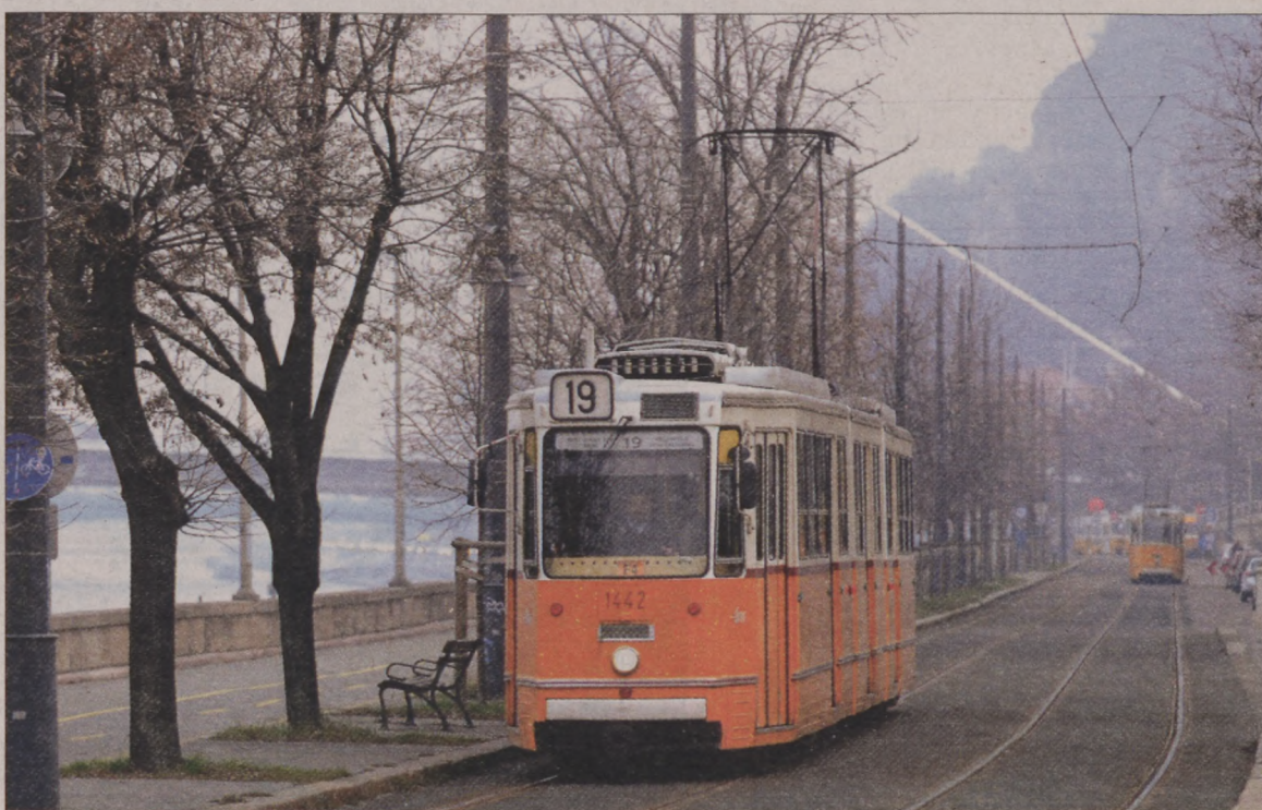
A Bem rakparton egy kilométer hosszan új villamospályát építenek

Jelentősen megváltozik a Bem rakpart, ahol a halszállás parkoló helyén mintegy egy kilométer hosszan vadonatúj villamospálya épül. Megmarad a fasor és a jelenlegi kerékpárút is, utóbbit korláttal választják el a villamosról. Az úttest mindkét oldalán párhuzamos lesz a parkolás, az útpálya azonban ezen a részen egy sávra szűkül. A Margit híd alatt valamennyi sáv három méter széles lesz, itt egy időben csak