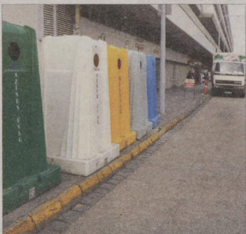
A házhoz menő szelektív gyűjtés kiterjesztése miatt csökkentette az utcai gyűjtőszigetek számát az FKF Zrt.

Több mint 5 milliárd forintos költséggel, ebből 4,8 milliárd forint uniós támogatással az év végére teljes lesz a házhoz menő szelektív hulladékgyűjtés Budapesten – jelentette be György István főpolgármester-helyettes a rendszer jelenlegi kiépítettségét bemutató sajtótájékoztatón. Elmondta, hogy a gyűjtőszigetek száma a fővárosban 930-ról 665-re csökken, a továbbiakban itt csak az üveget gyűjtik.