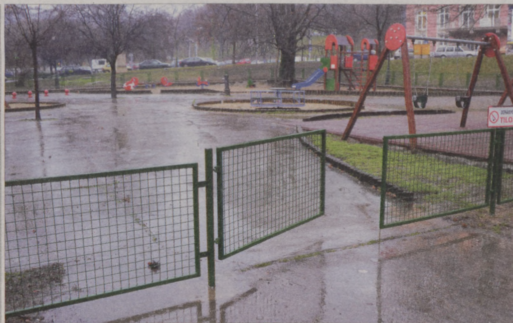
A gyerekek biztonsága érdekében körbekerítették a Horváth-kerti játszótér

Szintén a gyalogosok kényelmét szolgálja a vári útrekonstrukciós program, amelynek részeként az utóbbi időszakban a Dísz téri és a Tárnok utcai járda kapott könnyen járható és esztétikus vágott bazaltkő burkolatot. Jó hír, hogy felújították a busz megállóiban található padokat a Clark Ádám és a Szentháromság téren, illetve a Dísz téren, utóbbi helyszínen a korábbi leszerelt kandelaberek is végleges helyükre kerültek. A lámpatestek elrendezése igazodik az érintett járdák új nyomvonalához.