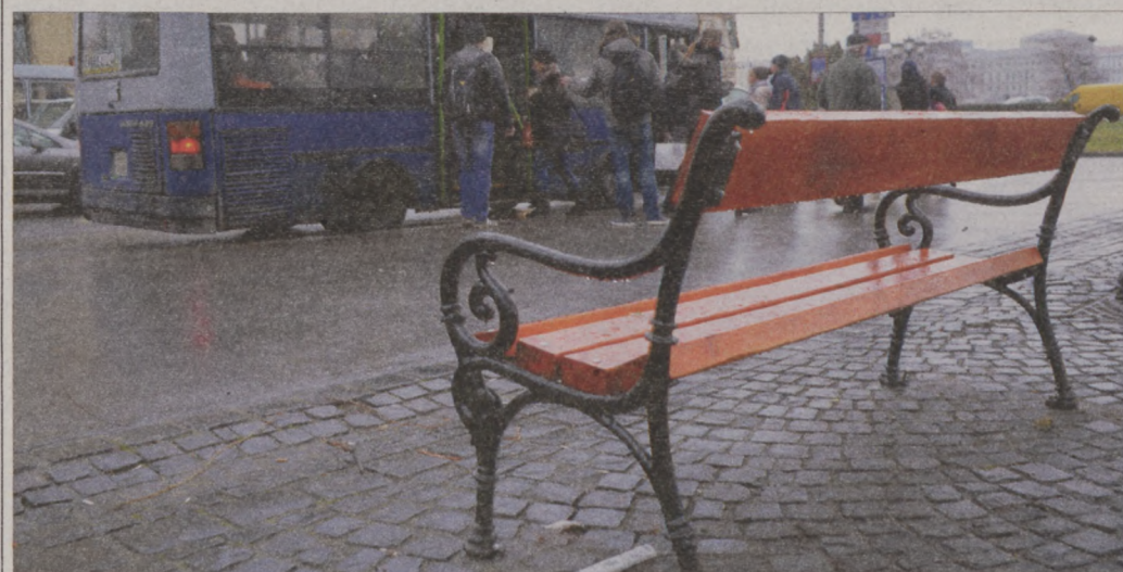
Felújították a padokat a Clark Ádám téren, a Dísz téri és a Szentháromság téri busz megállóiban

A gyerekek legnagyobb örömeire tovább épül a tavaly Mikulás napon átadott Mária téri Rumini játszótér, a hamarosan elinduló munkálatok során különleges dekoráció kerül a játszóeszközöket összekötő járdákra és a határoló falakra. Lesznek új játszóelemek is, ezek a már megszokott módon Rumini, a csavargóból hajósinná lett bátor és agyafűrt kisegér kalandjait elevenítik fel.