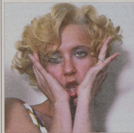
A Skorpió megessi az Ikrekkel reggelire, 1992