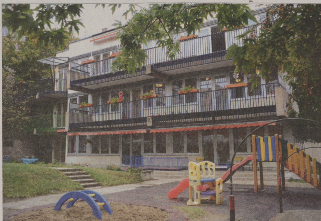
A korszerűsítéssel jelentősen csökken majd a kerületi bölcsődék és óvodák energiafogyasztása

A Budavári Általános Iskola energetikai korszerűsítésére szintén 2010-ben nyert támogatást az Önkormányzat, összesen 107 millió forintot. A sikeres pályázat eredményeként itt is megtörtént az iskola külső falainak és a padlásfödémek-