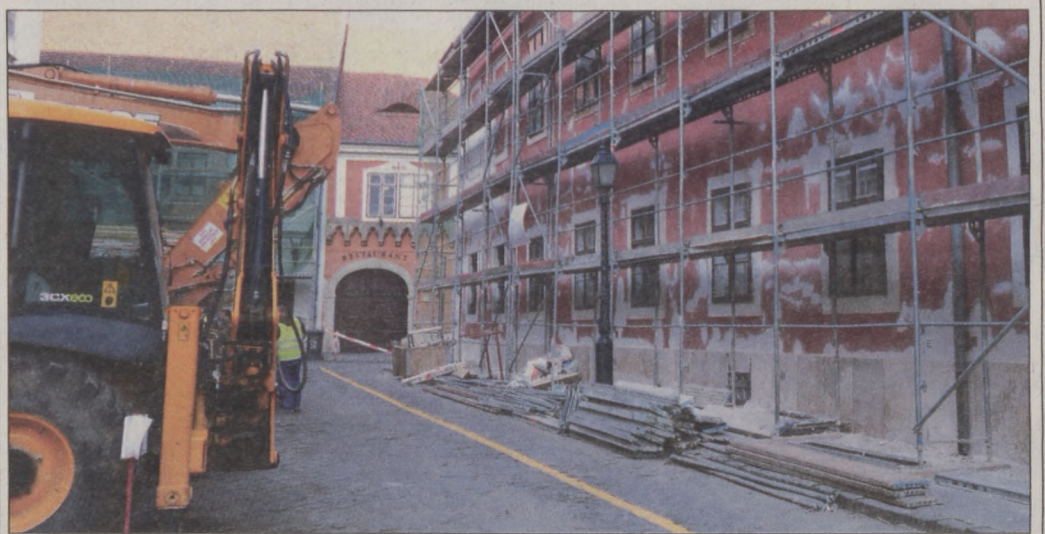
Idén is több épületet újítanak fel az önkormányzat beruházásában

Ugyancsak zajlik már a Móra Ferenc utca 2a és 2b jelű épületek külső homlokzatának felújítása is. Tavaly a két épület tetőszerkezetét építették újjá. A mostani felújításra 20, illetve 30 millió forintot fordít a kerület. A közeljövőben kerül sor Budapest ma is álló és használatban lévő legré-