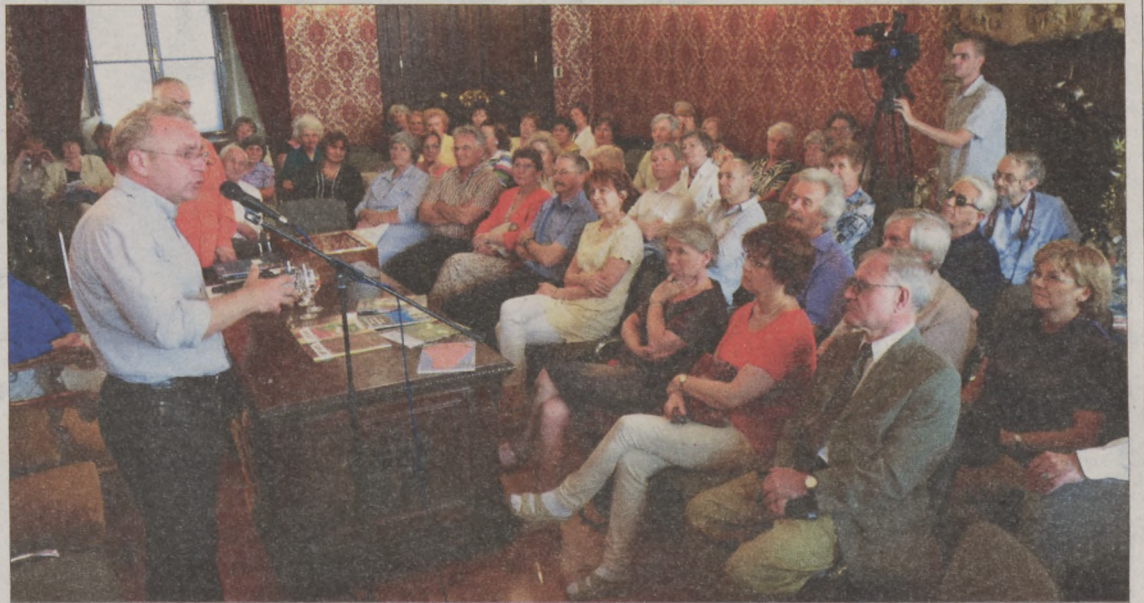
Pokorni Zoltán a Hegyvidék polgármestere, a Fidesz alelnöke volt a Márai Szalon egyik vendége

A Márai Szalon történetében kevés alkalommal fordult elő, hogy egész este közéletről, politikáról folyt volna a szó. Ezúttal azonban – két nappal az európai uniós választások után és egy héttel a Nemzeti Összetartozás Napja előtt – Pokorni Zoltán a Fidesz alelnöke, a Hegyvidék polgármestere volt a vendég.