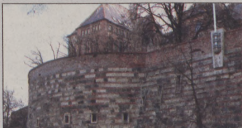
Murad pasa bástyájához is kapcsolódik majd egy lift

A Lovas utcai parkolónál kialakításra kerülő Murad lift (a létesítmény a Murad pasa bástyához kapcsolódik) engedélyezési tervei is elkészültek, a közbeszerzési eljárás jelenleg is zajlik, a kivitelezés még ebben az évben megtörténik. Közvetlenül a Várkert Bazárhoz csatlakozik az Újvilág kert felé vezető átjárótól