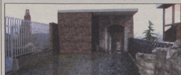
Látványterv a Korlát utcai liftről (iskola lépcső)

induló és az Oroszlános udvarhoz vezető lift, amely várhatóan 2015-ben készül el. A felvonó segítségével a gyalogosok az újonnan létesített kikötőtől, a Várkert Bazár mozgólépcsője és liftje közbeiktatásával eljuthatnak a Palota udvarra.