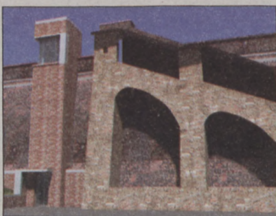
Lift épül a Gránit lépcsőnél

Szintén a közlekedési fejlesztés keretében, az akadálymentes vári kapcsolatot biztosító négy lift valósul meg. Ezek közül már zajlik az engedélyeztetése a Gránit lépcsőnél létesítendő tizenhárom személyes liftek, amely a Lovas út és a Tóth Árpád sétány (Szentháromság utcánál) között szállítja majd az utasokat. Lift épül a Korlát utcában az Iskola lépcsőnél is, az ehhez szükséges engedélyezési tervek már rendelkezésre állnak, a kivitelezésre vonatkozó közbeszerzési eljárás folyamatban van. A szintén tizenhárom személyes Iskola-lift a Halászbástyától északra, a későbbi Iskola-lift közvetlen környezetében valósul meg. A munkálatok a tervek szerint az év végéig befejeződnek.