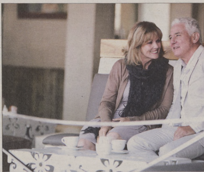
A hallókészülékek elfogadottsága érezhetően javult az elmúlt években.

gyorsult járműforgalom következtében az autózás és a gyalogosként való közlekedés egyaránt maximális odafigyelést igényel. A járdáról lelépve érzékelnünk kell, hogy milyen irányból jönnek az autók, a buszok vagy éppen a kerékpárosok. Ahhoz, hogy ezt meg tudjunk állapítani, működni kell az úgynevezett irányhallásunknak. Ennek alapvető feltétele pedig az, hogy mindkét fülünkkel jól halljunk. Tény: számos kisebb-nagyobb baleset elkerülhető lenne, ha a hallásproblémák kezelése lennének. „Nem szabad, hogy valaki azért döntsön úgy, hogy nem használ hallókészüléket, mert szégyelli azt. A hallás nem játék, a hallásproblémákat komolyan kell venni, és minél hamarabb kezelni kell őket” – hívja fel a figyelmet a főorvosnő. A Budapest, II. kerület, Margit körút 31-33. szám alatt található Amplifon Hallásközpontban a teljes körű, ingyenes hallásvizsgálat mellett lehetőséget biztosítanak arra, hogy a világ vezető hallókészülék gyártóinak a termékeit kipróbáljuk és akár otthoni környezetben teszteljük. A vizsgálatokra nem kell várni, hiszen mindenki időpontot kap, és személyre szabott ellátásban részesül. Érdekes tehát most bejelentkezni!