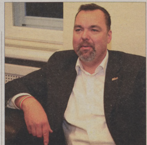
L. Simon László államtitkár, miniszterhelyettes

Az elmúlt években végre elkészültek a legégetőbb helyreállítási munkálatok a Várnegyedben. Az első Orbán-kormány felújította a Sándor-palotát, a második pedig a Várkert Bazárt, de a Dísz tér 17. sem éktelenkedik már a Vár közepén. A közeljövőben megkezdődhet a királyi palota és a Polgár város megújítása is, az erről szóló tervet a Nemzeti Hauszmann Terv tartalmazza majd. Az elképzelésekről beszélgettünk L. Simon Lászlóval, a Miniszterelnökség parlamenti államtitkárával, miniszterhelyettesével, akitől azt is megkérdeztük: elveszik-e a vári lakásokat.