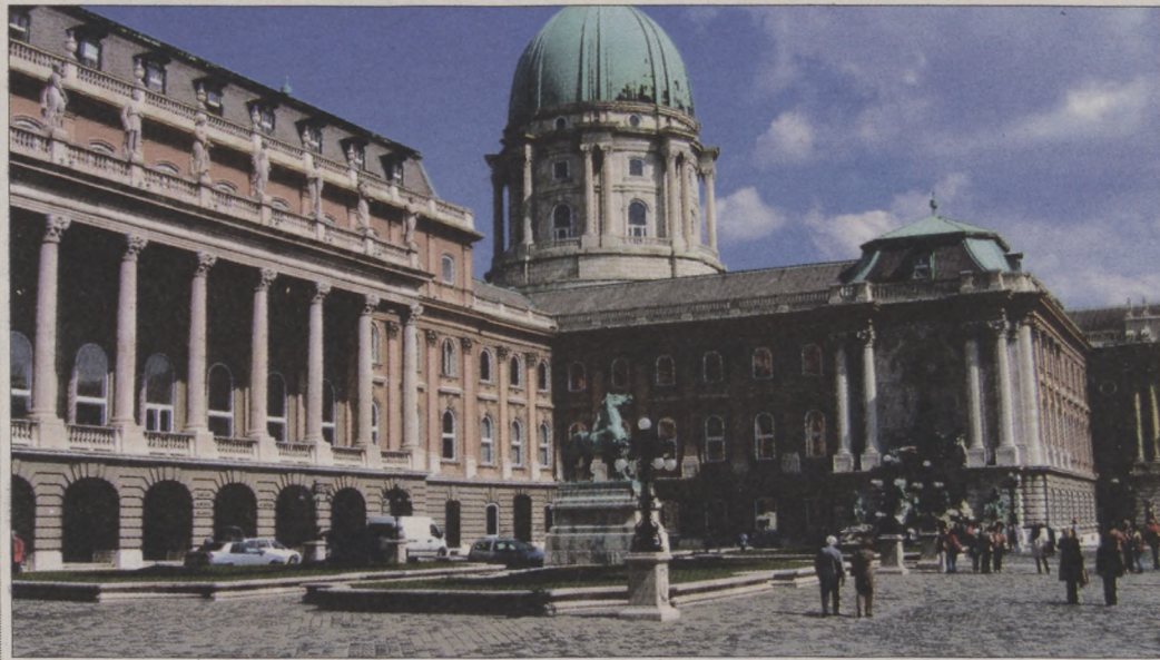
A közeljövőben megkezdődhet a Királyi Palota és a Polgárváros megújítása is

Nagyon sok terv készült az elmúlt években, mit és hogyan lehetne a Várba költöztetni, melyik épület kaphatna a jelenlegitől eltérő funkciót. A sok elképzelés közül csupán egyetlen dolog dőlt el, ez pedig hosszú távon a Palotaszállás állami reprezentációban való hasznosítása. Így a Karmelita kolostor felújítása után a miniszterelnök a szűkebb apparátusával ide költözik. Szeretnék mindenkit megnyugtatni, nem célunk a forgalom növelése. Sőt, éppen hogy csökkenteni akarjuk. A Várkert Bazár alatt megépült egy 300 férőhelyes mélygarázs, a Vár nyugati oldalán pedig épül a másik, szintén 300 férőhelyes garázs. Ezek kényelmesen kiszolgálják majd a Miniszterelnök-