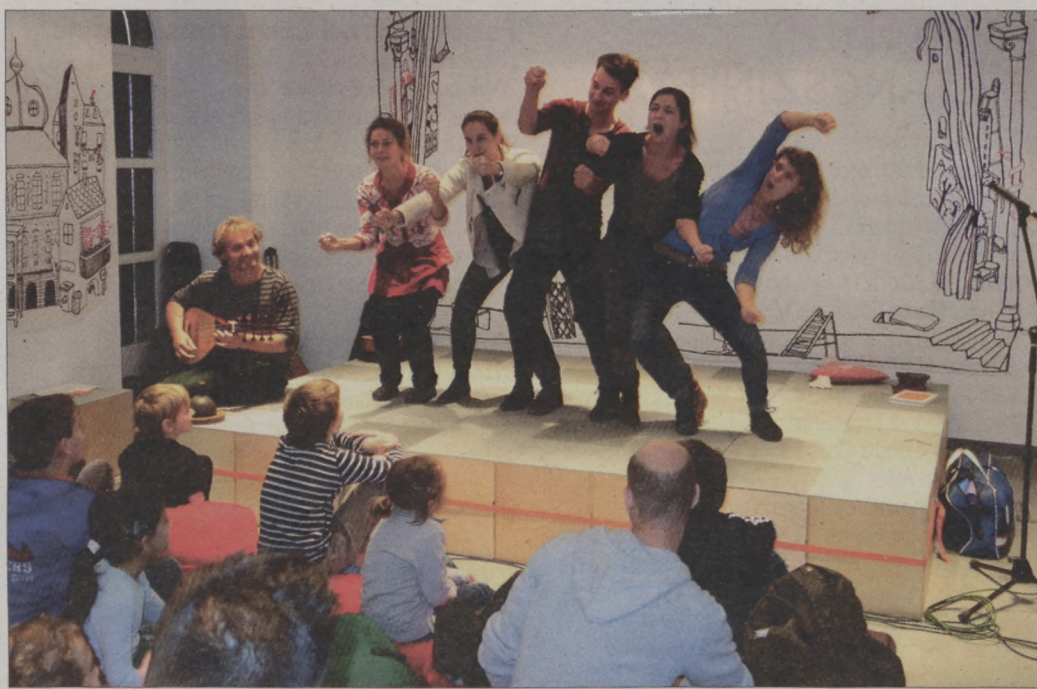
A Mesemúzeum 2. születésnapján a Kompánia Színházi Társulat vidám műsorral szórakoztatta a gyerekeket