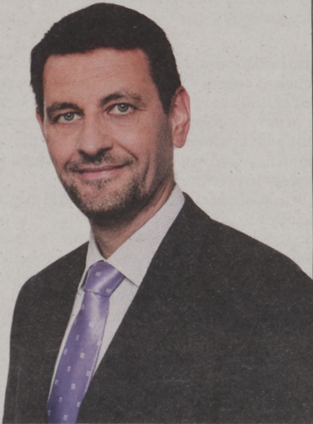
Ismét dr. Nagy Gábor Tamást választották polgármesternek az I. kerületiek

Főlényes győzelmet aratott a Fidesz-KDNP az önkormányzati választáson. Október 12-én ismét dr. Nagy Gábor Tamás polgármesternek szavaztak bizalmat a választók, aki 1998-tól áll az I. kerület élén. Kerületünk valamennyi egyéni választókerületében a kormánypártok képviselőjelöltjei győztek, így a 14 tagú testületben a Fidesz-KDNP 10 képviselője, valamint az LMP, az MSZP-MLP, az Együtt-PM és a DK egy-egy listáról bejutott képviselője dolgozik majd. A főpolgármesteri választást nagy többséggel Tarlós István nyerte. (A választási eredményeket a 3. oldalon közöljük a Nemzeti Választási Iroda adatai alapján.)