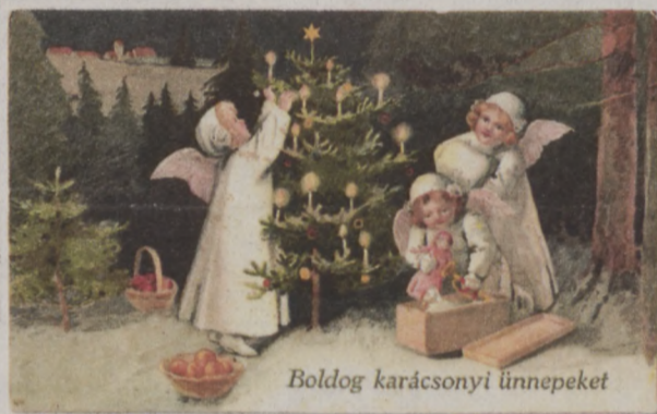
Boldog karácsonyi ünnepeket

Várjuk és ünnepeljük a Fényt, a Megváltó eljövételét emelkedett lélekkel úgy, hogy a hétköznapokon se feledjük: a mi sorsunk értelme, szépsége, győzelme, nagysága nem a külső körülményekben, hanem, belső hitünkön és meggyőződésünkön alapuló tette-