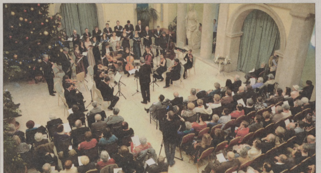
Bach karácsonyi kantátáit az Orfeo zenekar és a Purcell Kórus előadásában hallgathatta meg a közönség