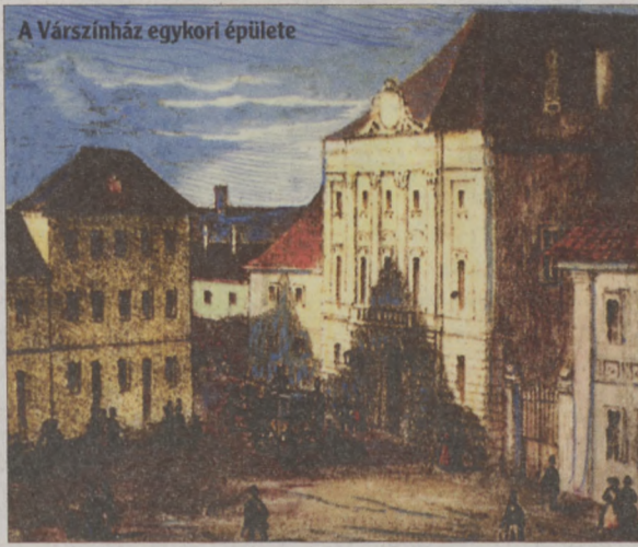
A Várszínház egykori épülete

Kelemen Budán kívánta megrendezni az első magyar nyelvű színháztörténeti előadást. A Várszínházban akkor már egy német támo-