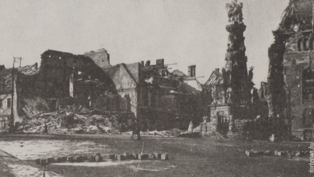
A Szentháromság tér az ostrom után

nya is. Vigasztaló szimbólum mindnyájunk számára. Nagyboldogasszony ezúttal is megőrizte kedves templomát a Vár romjai között. Három temploma közül egyedül maradt meg úgy, hogy pár héttel az ostrom befejezése után már misézni lehetett benne.