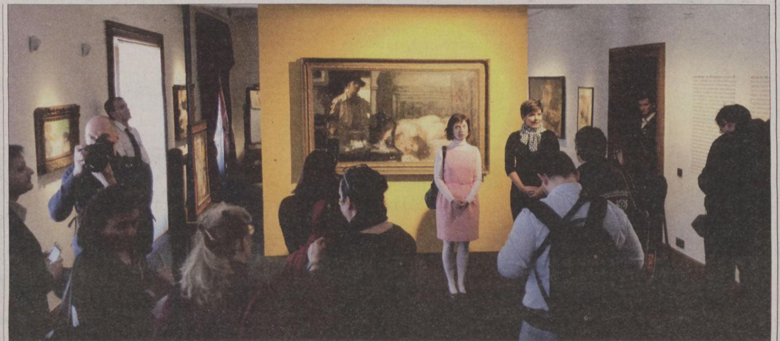
A kiállítás műtermi részében számos szép aktképet tekinthetnek meg a látogatók