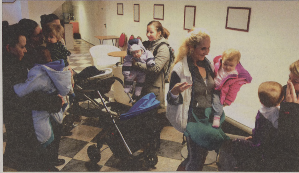
Érkeznek a résztvevők a baba-mama jógára

A fizikai frissességet különböző típusú, ingyenesen igénybe vehető tornafoglalkozások segítik. Kedd délután 15, illetve 16 órától és csütörtök