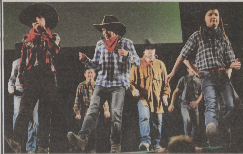
Alapításának 143. évfordulóját ünnepli idén a Batthyány Lajos Általános Iskola. A Millenárison tartott gálán minden osztály nagyszerű produkcióval lépett fel a lelkes és népes közönség előtt. Képünkön az 5.b. osztály cowboy táncot ad elő.