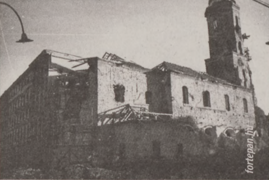
A Mária-Magdolna templom romos épülete