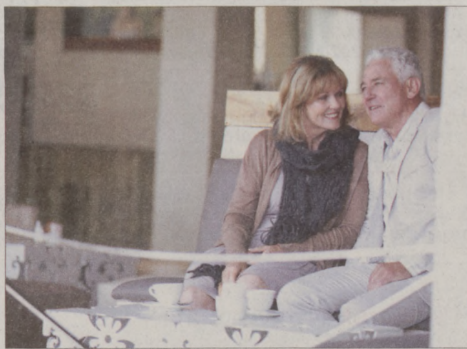
Ha túl sokat várunk, akkor lehet, hogy már késő lesz

A halláscsökkenés okozta következmények hallókészülék segítségével a legtöbb esetben orvosolhatóak, ennek ellenére manapság még mindig nagy az ellenállás az emberekben. Ahelyett, hogy segítséget kérnének, inkább visszahúzódnak. Sajnos az is közrejátszik, hogy nem is olyan könnyű észlelni a tüneteket. „A halláscsökkenés általában lassan és fokozatosan jelentkezik, így egy megszokott állapotot válik, mely nagyban megnehezíti felismerését. Kezdetben csak néhány hang tűnik el, nem az összes. Ezért is érdemes évente ellátogatnunk egy szűrővizsgálatra,