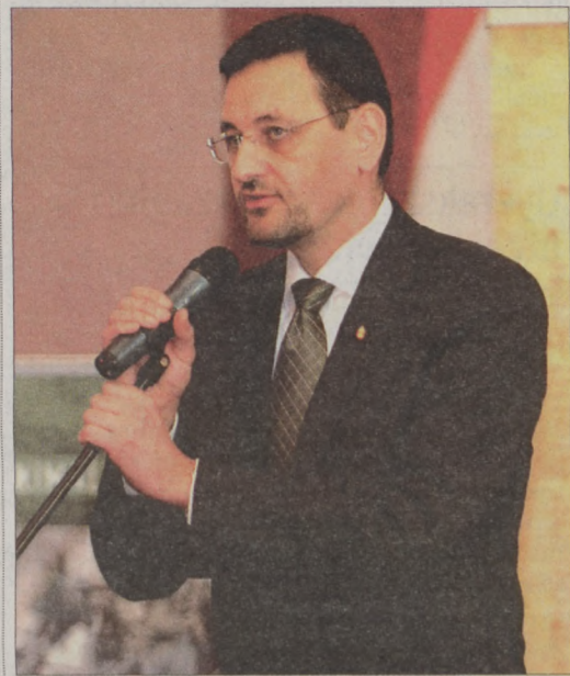
A több fordulóval vetélkedő döntős csapatait és a felkészítő tanárokat dr. Nagy Gábor Tamás, Budavár polgármestere köszöntötte

kialakulására, hiszen milyen más alapra lehet a jövőt építeni, mint a múltra? A történelem ismerete minden hivatáshoz nélkülözhetetlen. Magam is úgy vélem, hogy ha nem ismerjük a felmenőink, családunk történetét, akkor érzelmi stabilitás nélkül élünk. A történelem egyik fontos üzenete arról szól, hogy mi az, amit el kell kerülnünk. A 20. század történelme olyan tragikus volt, hogy fel kell ismernünk nem lehet háborúkkal megoldani a nemzeti konfliktusokat. Szeretném, ha a jövő generáció számára ez lenne a legfontosabb. Azáltal, hogy a vetélkedő kapcsán a gyerekek emberi sorsokkal foglalkoztak, jobban megértik a történelmet.