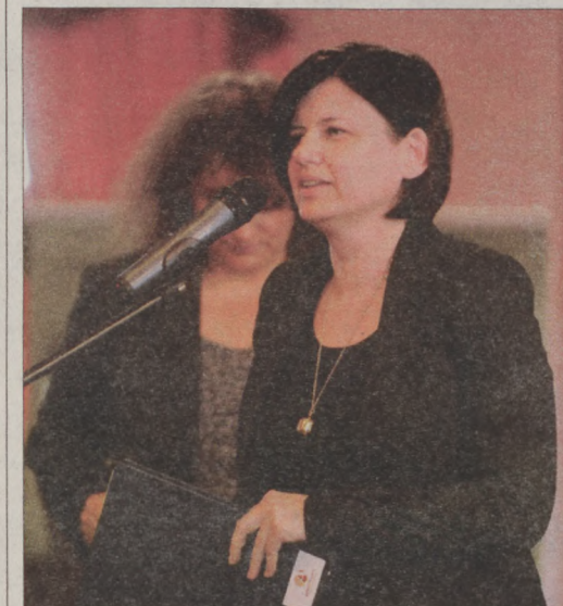
A több forduló vetélkedőn résztvevő csapatok munkáját Apáti Zita, a Magyar Nemzeti Levéltár főlevéltárosa, a zsűri elnöke értékelte

A csapatok által készített valamennyi kisfilm, a Történelmi verseny Budavár címet beírva, megtekinthető a youtube csatornán.