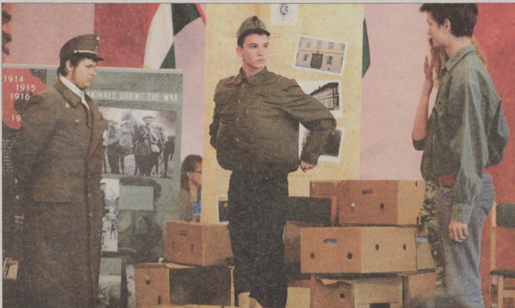
Hašek: Svejik című regényének dramatizált jelenetét a Kosztolányi Dezső Gimnázium diákjai adták elő