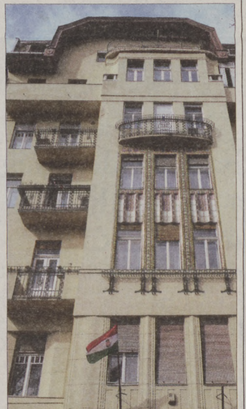
Érdekes programokkal várják a látogatókat a Szilágyi Dezső tér 4. szám alatti házban

Április 18-19. között immár ötödik alkalommal rendez meg a Kortárs Építészeti Központ a száz éves épületeket bemutató Budapest 100 programot, amelyhez idén is több I. kerületi lakóház és intézmény csatlakozik. Köztük van a Szilágyi Dezső tér 4. alatti ház, amely helytörténeti különlegességekkel várja az érdeklődőket.