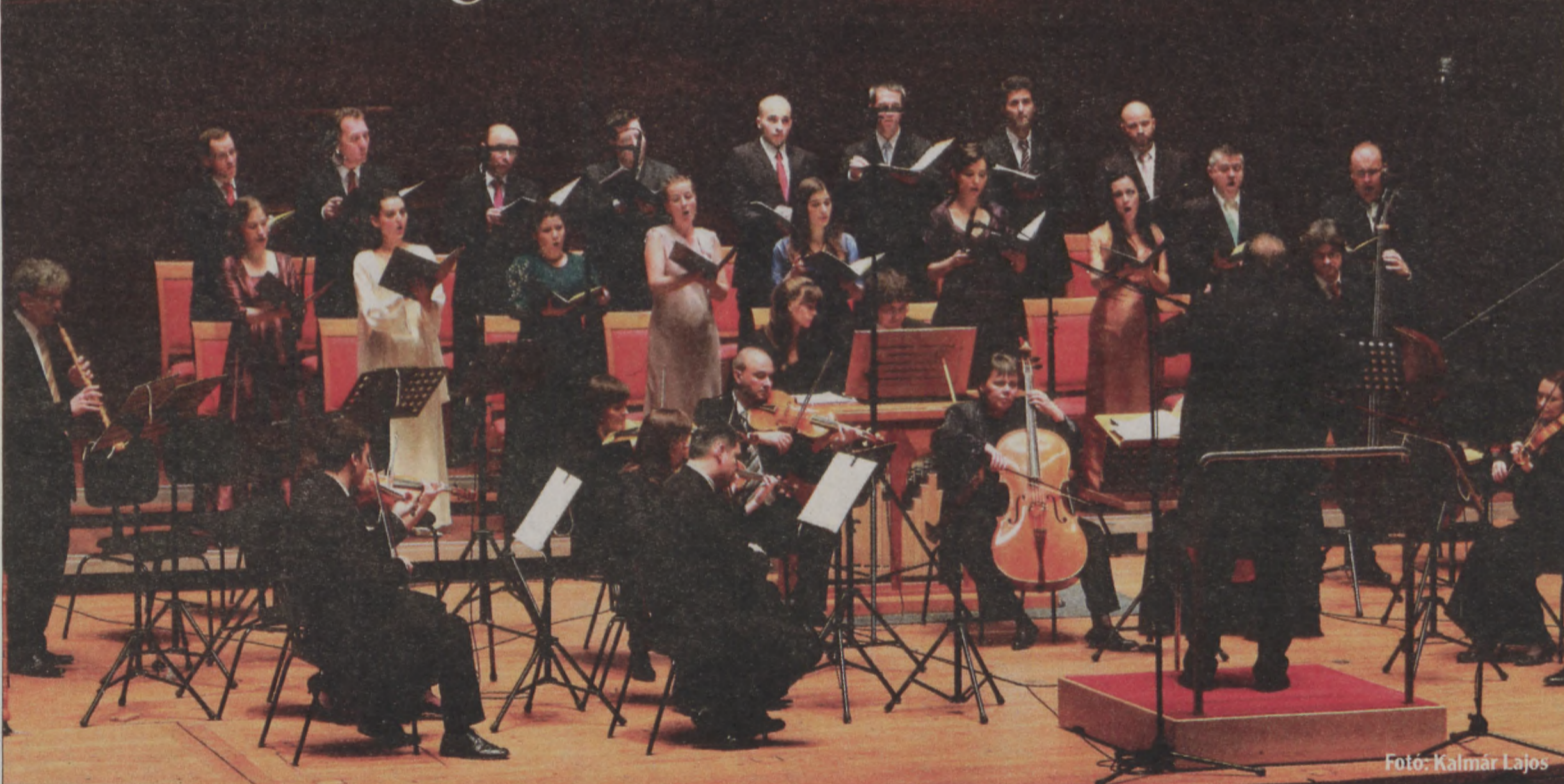
Az Orfeo zenekar műsora hasonló felépítésű lesz mint a Beethoven korabeli koncertek