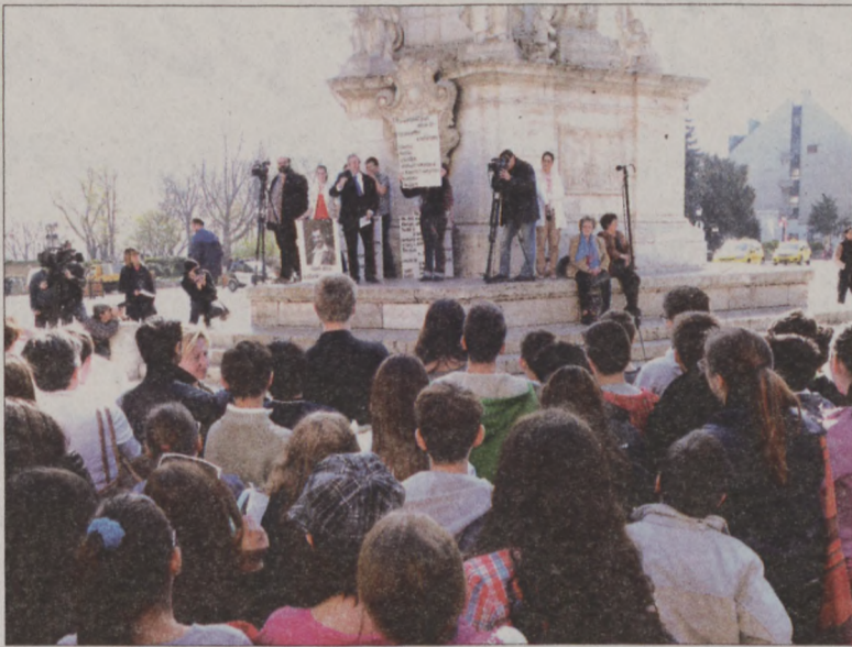
Több száz diák szavalt együtt József Attila Születésnapomra című versét a Szentháromság téren