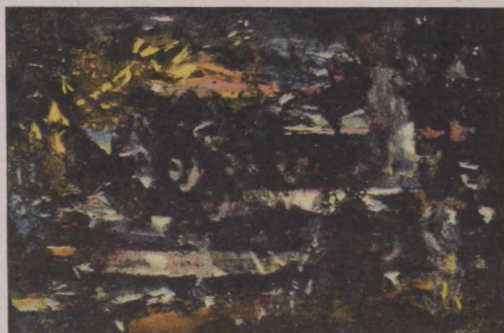
Rozsda Endre festménye (cím nélkül)

- Sokat áldozunk arra, hogy a látogatók számára megkönnyítsük az eligazodást, a nem mindenki számára könnyen érthető kortárs műfajban. Nálunk a művek kiállításához hozzá tartozik, hogy kiegészítő írásos anyagokkal segítjük értel-