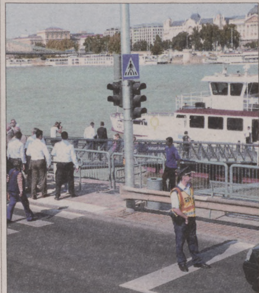
A Várkert Bazárnál új kikötő is épült

mint az önkormányzat finanszírozásában befejeződött a vári buszvonalak felújítása, a vonalon üzembe álltak a modern Karsan midibuszok, amelyeket szintén a közlekedési program keretében vásárolt az önkormányzat. Elkészült a Hilton alatti buszforduló, a Disz téri busz le- és felszálló a Hunyadi út végére került. Fontos eleme a közlekedésfejlesztésnek a parkolás szabályozása, ennek keretében korszerűsítették a vári behajtási rendszert, új parkoló automatákat telepítettek, amelyek eurót és bankkártyát is elfogadnak. Valamelyest csökkent a parkolóhelyek száma a Döbrentei utcában, a Lánchíd utcában, az Öntőház utcában, valamint a Hess András és a Szentháromság téren, ugyanakkor felépült egy közel 300 férőhelyes mélygarázs a Várkert Bazár alatt, amihez parkolásiirányító és foglaltság jelző rendszert is kiépítettek.