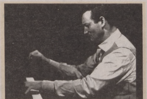
Cziffra György (1921 Budapest – 1994 Párizs)