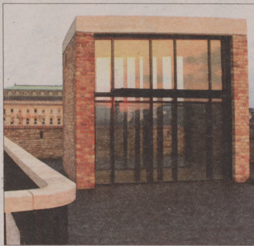
A Lovas útról a Murad lifttel lehet feljutni a Várba, az Anjou sétányra

A BUDA VÁR 360 mobil applikáció is működik, az ingyenes alkalmazáson keresztül közérdekű adatokhoz, közlekedési információkhoz, programajánlókhoz juthatnak a felhasználók. A közlekedésfejlesztési projekt 11 milliárd forintos költségét teljes egészében az Európai Unió finanszírozta, az önkormányzati fejlesztések értéke 2,5 milliárd forint.