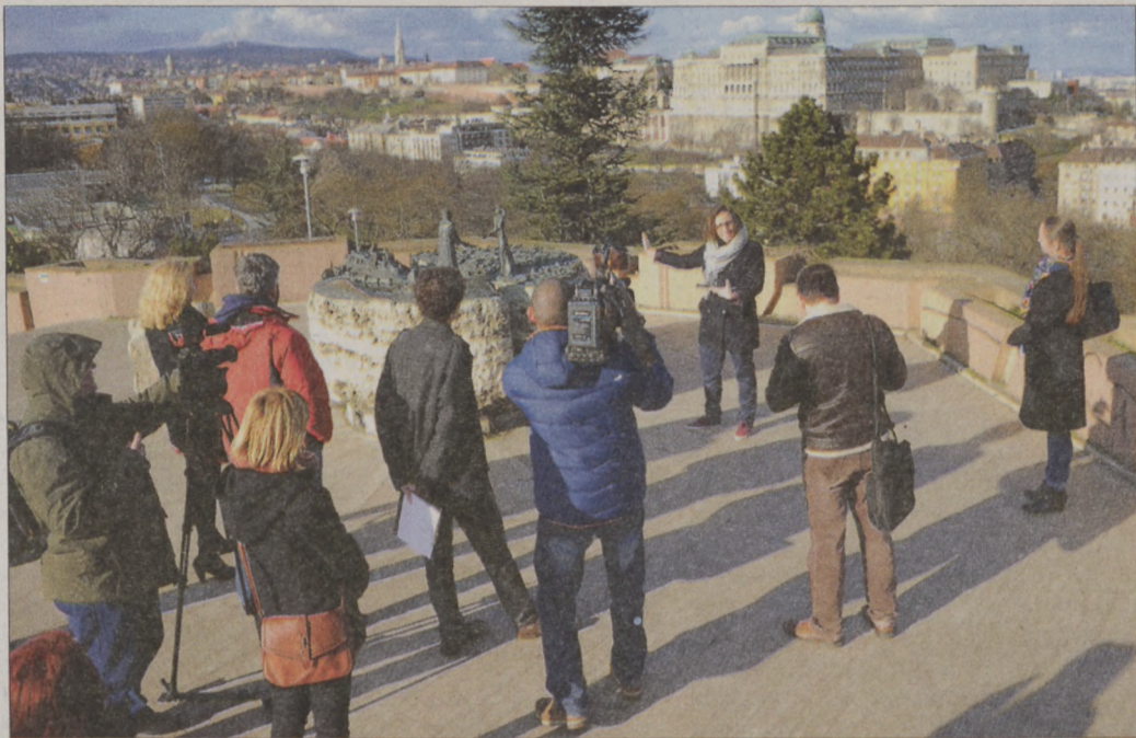
A kiállítást városismereti séta egészíti ki

Az 1873-as egyesítés után Budapest lett az ország szellemi, kulturális és gazdasági központja,