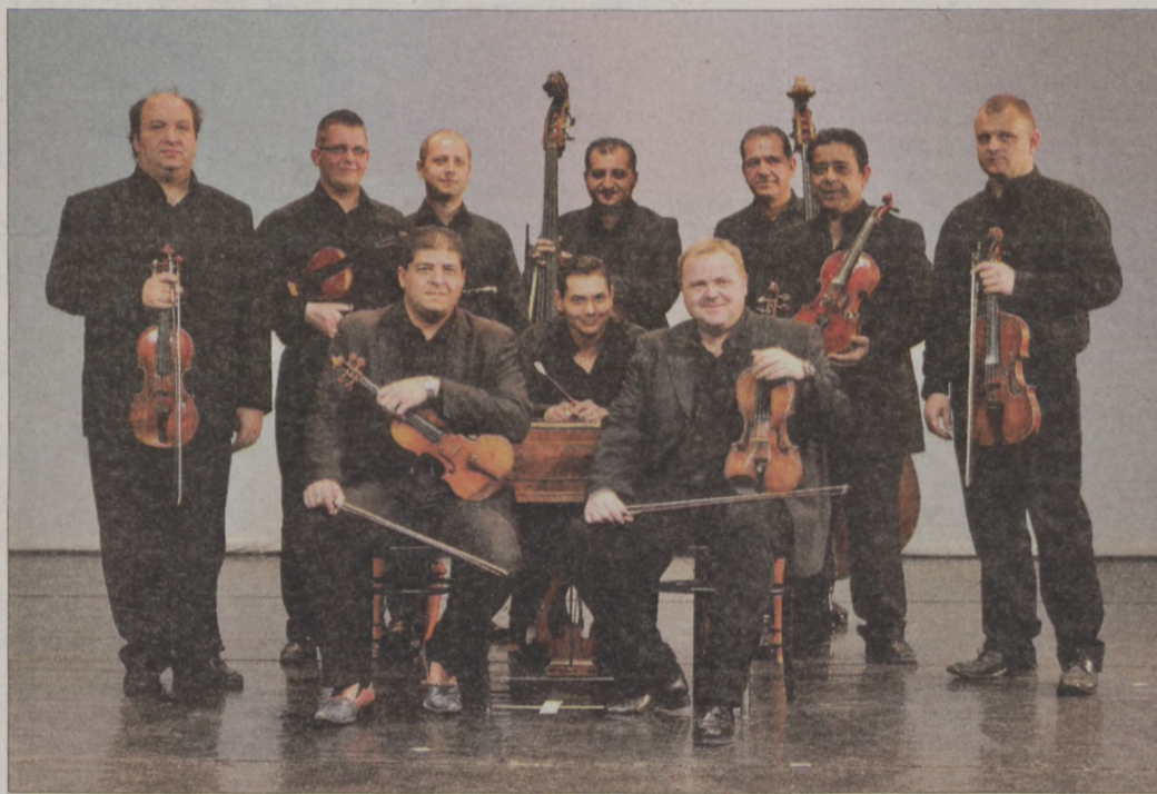
A Magyar Állami Népi Együttes zenekara