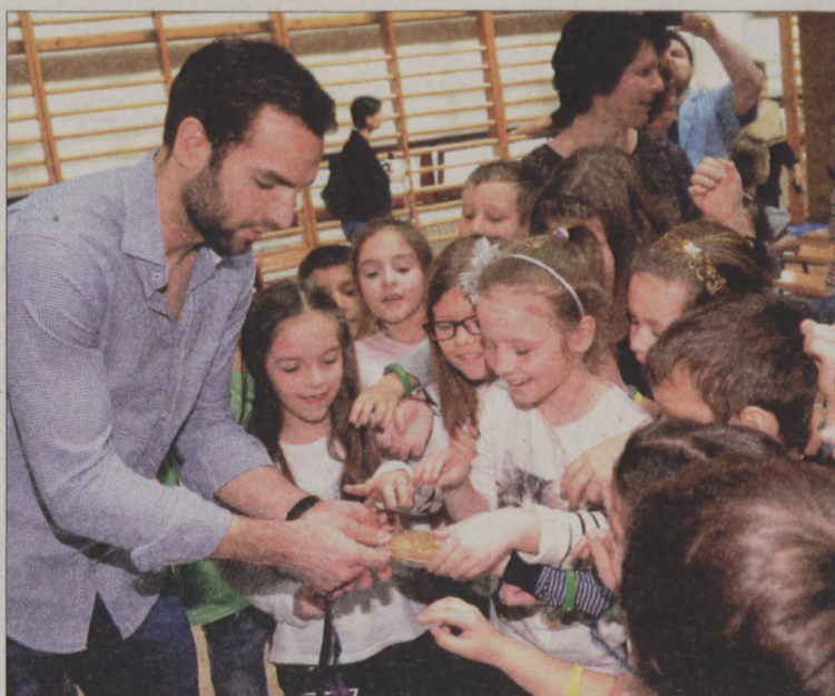
Szilágyi Áron olimpiai bajnok vívó volt a Budavári Általános Iskola vendége

– A gimnáziumot magántanulóként végeztem, mivel már délelőtti edzésekre is jártam – elevenítette fel emlékeit a bajnok, aki jelenleg