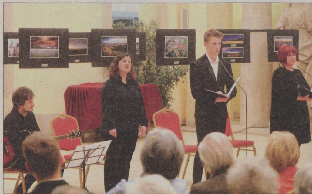
A fotókiállítás megnyitóján a vendégek a műveket tekintik.

A határon túlról érkezett vendégeket, a muravidéki magyarság művelődését, irodalmát, könyvkiadását, valamint tudományos tevékenységét segítő Lendvai Magyar Nemzetiségi Művelődési Intézet munkatársait és az érdeklődő közönséget dr. Nagy Gábor Tamás polgármester köszöntötte. A gyümölcsöző testvérvárosi kapcsolatok egy-