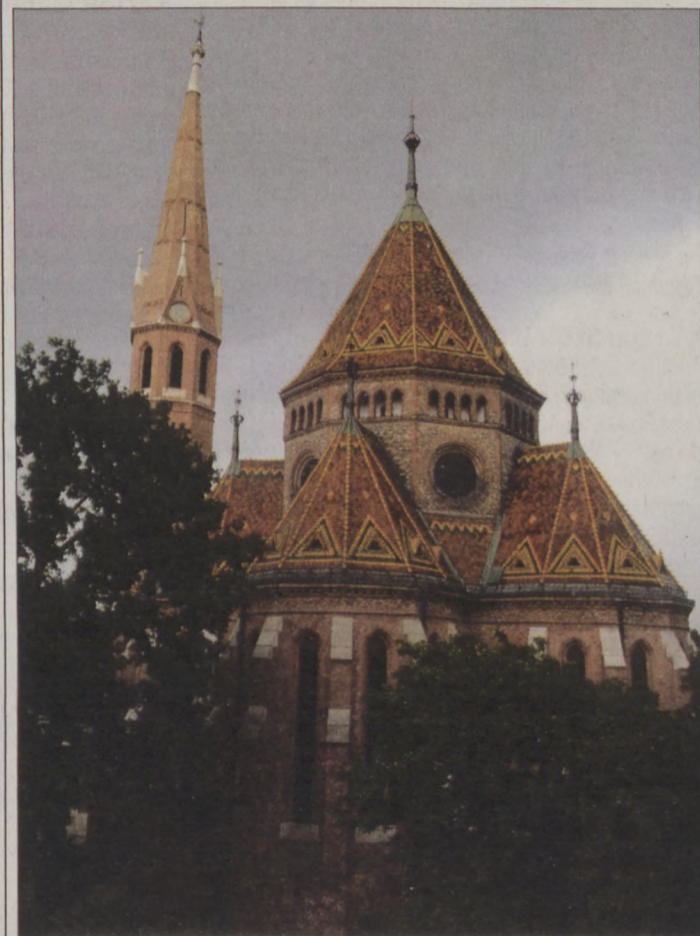
120 éves a Szilágyi Dezső téri református templom

A pesti egyház nem támogatta a templomépítési szándékot, s a viták 1883-tól két esztendőn keresztül akadályozták a leányegyház létrehozását. 1885 tavaszán, az időközben 2300-ra növekedett I. és II. kerületi reformátusok gyűjtést szerveztek leendő templomuk javára. Ügyük mellé állt a miniszterelnök felesége, Tisza Kálmánné gróf Degenfeld-Schomburg Ilona, aki sorsjátékot, jótékonysági és felolvasó esteket, koncerteket szervezett. 1890-ben az egyháztanács végül kiírta a tervpályázatot. Ebben meghatározták, hogy az épületet román, gót, vagy reneszánsz stílusban kell megtervezni, továbbá a fűthető, 600 főt befogadó templom keltsen ünnepélyes hatást. A pályázaton Pecz Samu terve győzött, többek között, mivel tartalmazta az épület körüli tér rendezését is. E teret a főváros 1900 és 1904 között parkosította.