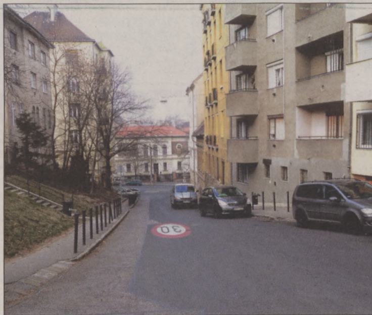
Folytatódik a Naphegy utca felújítása

A költségvetésben többek között szerepel a Ponty utca Szalag utca - Fő utca közötti szakaszának felújítása, hiszen az útburkolaton jelentős süllyedések vannak, a szegély több szakaszon sérült. Tervezik a Halász utca útburkolatának cseréjét is a rakpart és Fő utca között. Itt - a tervek szerint - kiszélesítik a meglévő járdát is. A Franklin utcában sor kerül a lépcsős járda megújítására a Donáti utca és Toldy utca közötti szakaszon. Folytatódik a Naphegy utca felújítása is, 2017-ben a Mészáros utca-Orvos utca közötti szak-