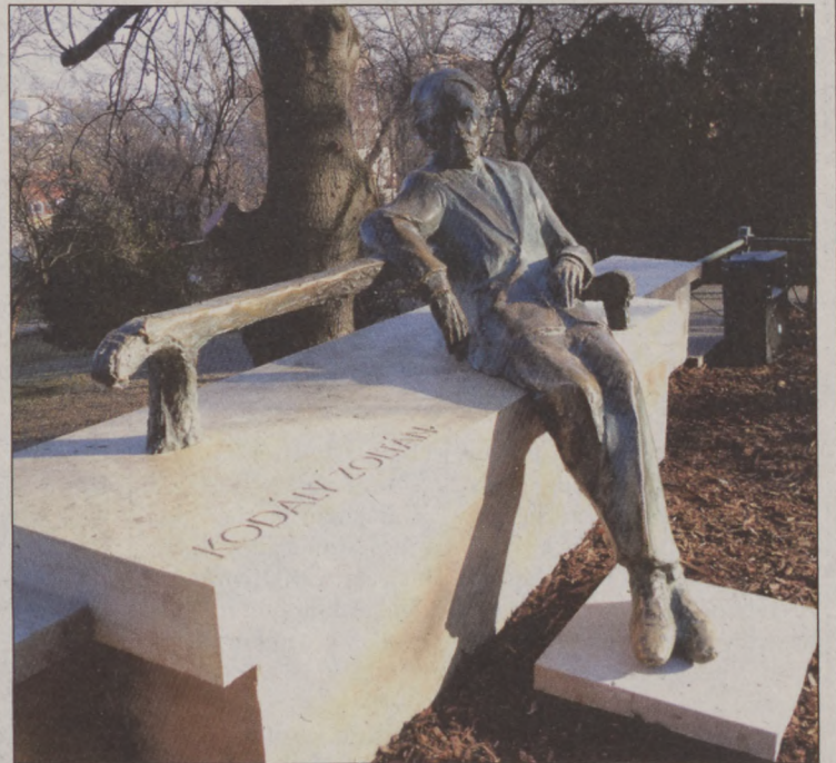
Az Európa liget rendezésének első lépéseként tavaly decemberben visszakerült eredeti helyére Kodály Zoltán szobra

Nagy András, a Gazdasági Iroda vezetője összefoglalójában azt emelte ki, hogy a bevételeket megalapozottan, az óvatosság elvét követve, a kiadásokat pedig a közfeladatok ellátásához indokolt mértékben tervezték meg. A várható bevételek elegendő fedezetet biztosítanak a jelentős fejlesztési és felújítási tervekre, úgy, hogy továbbra is a tartalékok szolgálják majd a biztonságos gazdálkodást. A 15 milliárd forintos főösszegű költségvetésben ugyanis 5,5 milliárd tartalék szerepel. Kiemelte azt is, hogy a feladatokat és a különböző ellátásokat továbbra is magas színvonalon biztosítja az önkormányzat, és az eddig megfogalmazott prioritások mentén folytatódik a munka.