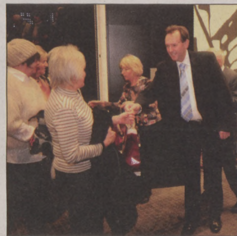
A kerület képviselői is részt vettek az ajándékozásban

A karácsonyi műsoros délutánról senki sem távozott üres kézzel. A Budavári Önkormányzat képviselői és a hivatal munkatársai karácsonyi finomságokkal lepték meg az időseket.