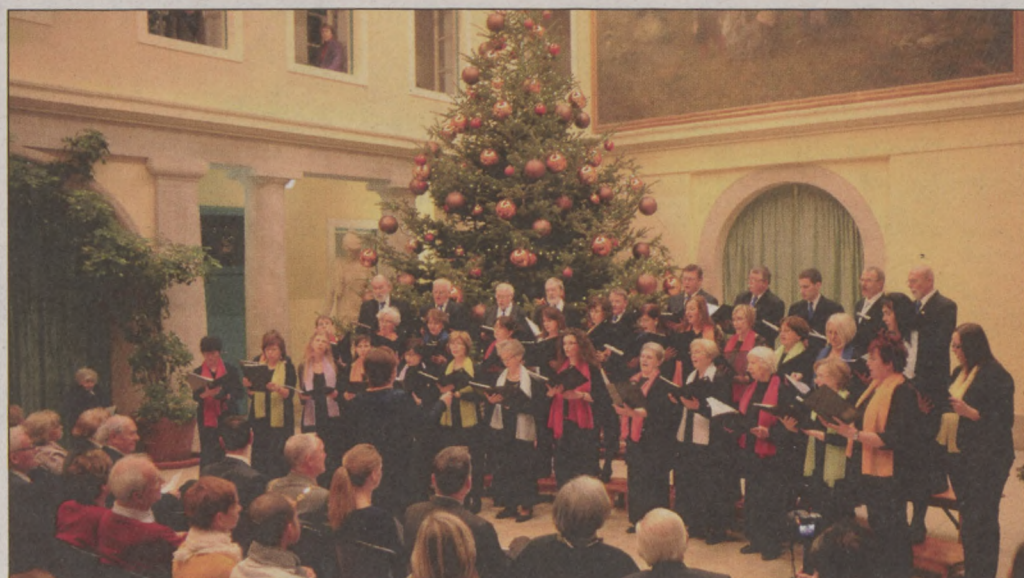
A Kalevala kórus nagyszerű adventi koncertje a Városházán