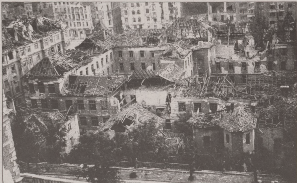
A Krisztinaváros romos épületei a Budai Várból nézve

Budapest 1944-1945-ös ostroma a legvéresebb városostromok közé sorolható. A városban rekedt polgári lakosság az ostrom alatt, illetve annak elhúzóda miatt kénytelen volt elviselni a minden korábbi mértéket meghaladó nélkülözést. Az átlagnapi 3-4 légiradót fölvaltotta az állandó fegyverrohogás. Tudomásul kellett venniük, hogy házaik, otthonaik napok alatt hadszíntérre, majd rommá váltak. Az utcákon mindenütt lótetemek hevertek, a köztér és a parkok temetőkké váltak. Sem a német, sem a szovjet alakulatok nem kímélték a várost.