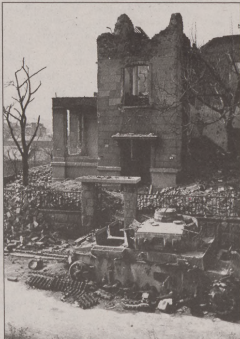
Tigris utca 19.