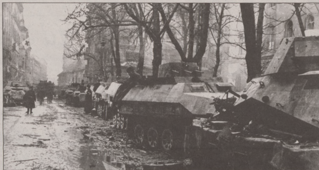
A Fő utca a Halász utcából a Clark Ádám tér felé nézve