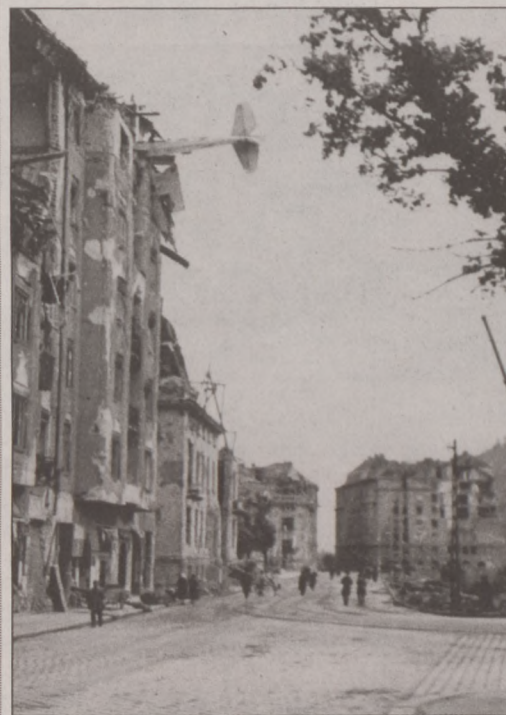
A repülőgép az Attila út 35. számú épületbe csapódott be

A 10-esbe óvóhelyen egy anya az éjjel sötétségben véletlenül párnával agyonnyomta 4 hónapos gyermekét.