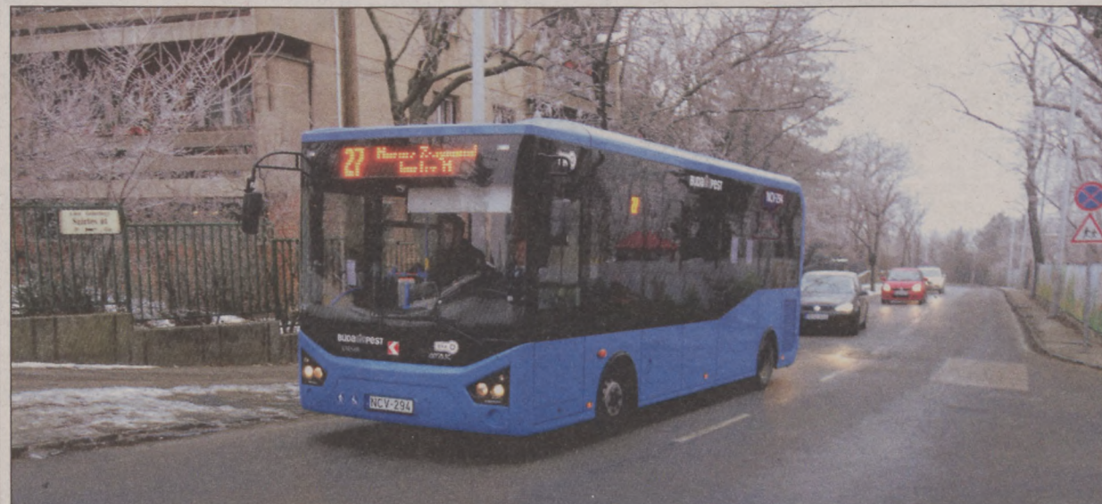
Már a Gellérthegyen is modern, környezetkímélő buszok járnak

nehézséges volt a le- és felszállás, főleg az időseknek, a gyermekocsival közlekedőknek vagy a mozgásukban korlátozott utasoknak. A klímaberendezés hiánya pedig a nyári napokon okozott kellemetlenséget az utasoknak, köztük a turistáknak is, akik ezzel a járáttal utaznak a Citadellához.