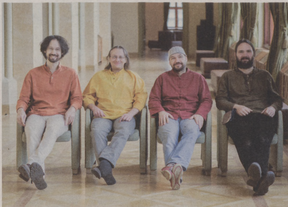
Misztrál együttes - Már a kezdetektől tudtuk, hogy mi verseket szeretnénk énekelni.

Tamás: De nagyon is. Am mi ezt választottuk, szerelemből csináltuk és csináljuk ma is.