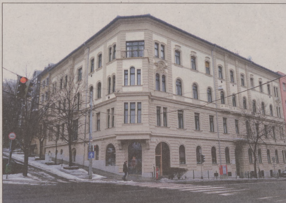
A HÁZGA segítette az Attila út 79. szám alatti ház felújítási pályázatát