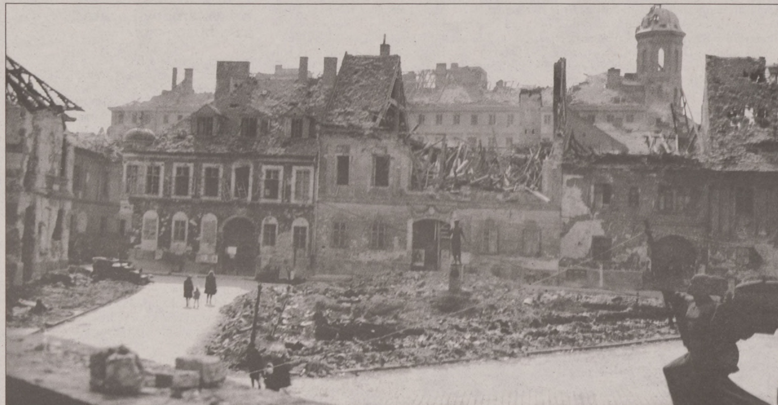
Bécsi kapu tér

Éjjel-nappal hallottuk az ágyúsót, bombázást. Elképzeltük, hogy mekkora lehet a pusztítás. De amit aztán később az ember a szemével látott, azt nem tudta előre elképzelni. Hársorok, terek, utcák tűntek el, város helyett hóba-sárba-földbe taposott romok, hullák, dögök, roncsok mindent.