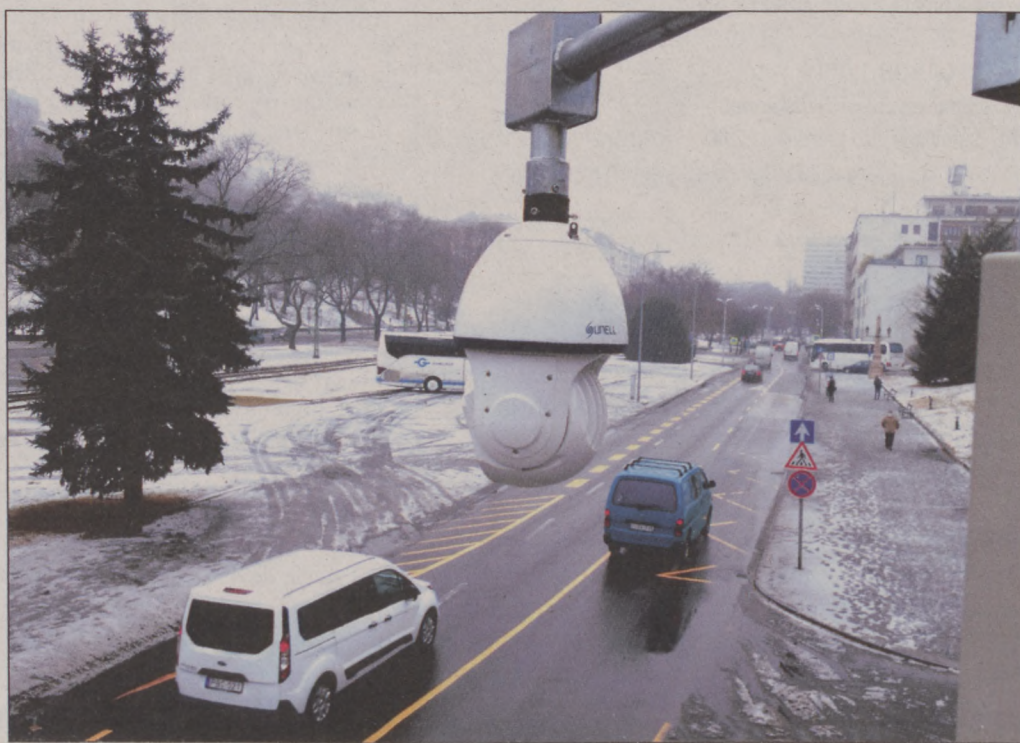
Térfigyelő a Dózsa György térnél

A tapasztalatok alapján a Budavári Önkormányzat az idei évben újabb modernizációt hajt végre: a legmodernebb, IP-alapú rendszert építik