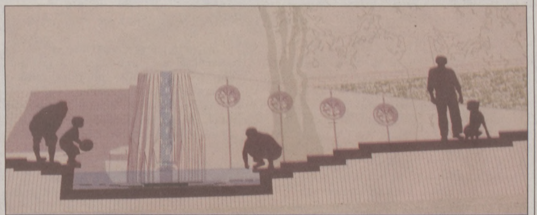
Látványterv az emlékkútról

Az emlékkút tervezésére a Budavári Önkormányzat meghívásos tervpályázatot írt ki, amelyre a Magyar Művészeti Akadémia (MMA) Építész tagozata által javasolt 6 neves építész, illetve táj- és kerttervező szakembert hívtak meg. A tervezők feladata az volt, hogy egy olyan forrást vagy kutat jelenítsenek meg a területen, amely utal a reformáció céljára, visszavezet a tiszta