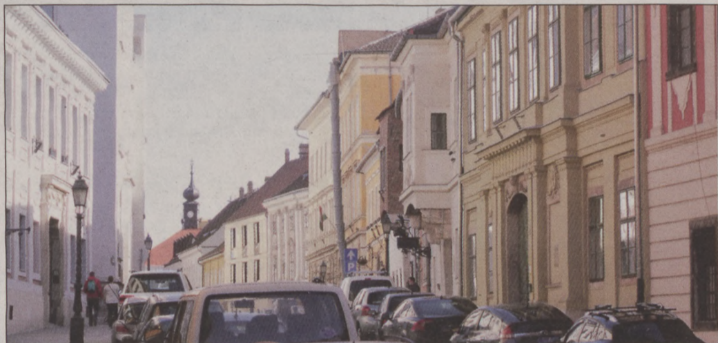
Az önkormányzat elkötelezett abban, hogy polgárok éljenek a Polgárvárosban és megőrizték annak egyedi hangulatát

Hosszan tárgyalta a Képviselő-testület a lakások és nem lakás céljára szolgáló helyiségek bérbeadásáról szóló rendeletet. Mint ismert, az elmúlt hetekben több alkalommal is az a vád érte az önkormányzat vezetését, hogy a lakásgazdálkodás nem átlátható a kerületben. Nagy Gábor Tamás polgármester a napirend tárgyalásakor elmondta, hogy a lakásrendelet mostani felülvizsgálata és módosítása jó alkalom a felmerült félreértések, tudatos félremagyarázások és vádak tisztázására is. – Speciális helyzetben van az önkormányzat a lakásgazdálkodás területén, hiszen a lakásállomány nagy része – a mintegy 1400 önkormányzati tulajdonú lakásból 800 – világorökségi területen van és műemléki védelem alatt áll. Ezeket a lakásokat a rendszerváltoztatás után az önkormányzat úgy kapta meg az állami vagyonból, hogy a műemlék lakóházak nem alakíthatók társasházzá, azaz tulajdonképpen nem adhatók el – mondta felvezetőjében. Ezért az itt élők – szemben más bérlőkkel – az 1990-es években nem tudtak élni azzal a lehetőséggel, hogy megvásárolják a lakásokat. A különleges helyzetben, éppen a bérlők érdekeinek figyelembevételével speciális rendszert dolgoztak ki azzal, hogy az úgynevezett örökbérleti jog, amely vagyoni értékű jog, örökölhetővé vált. A másik elem – folytatta –, hogy ezen lakások bérlőinek bérleti díját az önkormányzat nem emelte fel önköltségi szintre, hiszen a megnövelt költség-