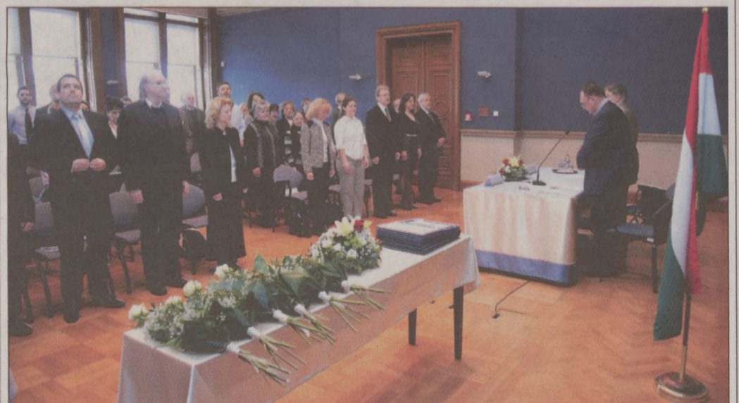
A Pedagógus Kutatói Pályadíjak ünnepélyes átadása