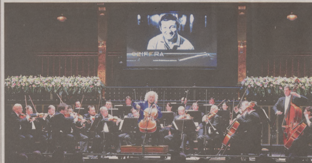
Mischa Maisky csellóművész koncertje