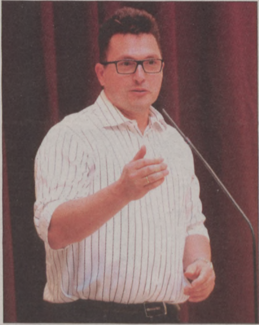
Ákos volt az est meglepetés-vendége

– Imre Géza párbajtőrívó, olimpikon tehetségével, szorgalmával, emberi helytállásával és sikereivel dicsőséget szerzett a magyarságnak, példát adva ezzel a fiatalabb nemzedéknek kitartásról, szerénységről, sportszerűségről – olvasta fel a polgármester a díszoklevél szövegét. – Budavár új díszpolgárát valóban a kardja teszi azzá, ami, mégpedig úgy, abban az értelemben, ahogyan azt Wesselényi gondolhatta. A hűség, az igazságérzet, a megbízhatóság, a józanság és az állhatatosság – ez áll a kivételes sportteljesítmény mögött is, amelyért mi, magyarok és budaváriak köszönettel tartozunk – méltatta a kitüntetettet. Elmondta, külön öröm számára, hogy Egerszegi Krisztina és Puskás Öcsi után ismét egy sportoló vált a kerület díszpolgárává, hiszen a sport olyan eredményekre nevel, mint a tisztességes versenyszellem, az önfeláldozás és a közös siker érdekében végzett csapatmunka.