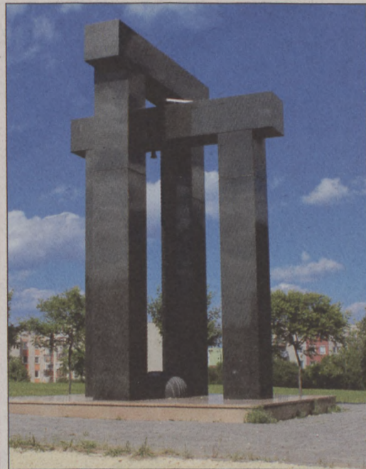
A kettős kapu Oláh Szilveszter szobrász és Szűcs László építész alkotása (XVII. kerület, Széchenyi utca 35.)

– Amikor felkértük őt, hogy mondjon köszöntőt a kiállításon, az első szava az volt: „Na, végre!”. Ő ugyanis – mint mesélte –, már több fórumon el-