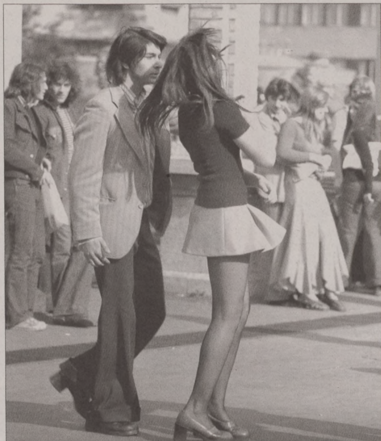
Az egykori Ifipark hangulata

Ha kedd, akkor Mini és P. Mobil. Ez volt a rendszeres program. Minden hét második napján otthon azt mondtuk, hogy moziba megyünk. Helyette irány az Ifipark. Miért lódtotunk? Mert a hetvenes évek végén túl fiatalok voltunk a koncertre járásához. Szerencsére a park este tizkor szigorúan bezárt, így komoly késéssel, de hazaért az ember (mobil nem lévén) aggódó családja körébe.