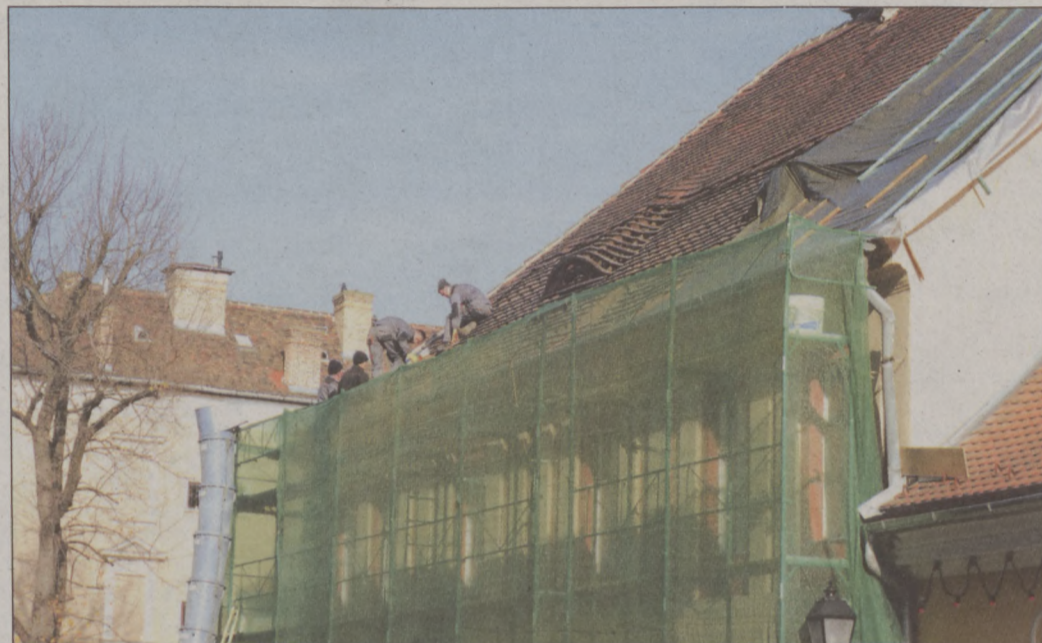
Országház utca 19. – Új tetőt kap a saroképület

A Fortuna utca 8. szám alatti épületben felújították a tetőt és az udvari homlokzatot, a lépcsőházban még zajló munkálatokkal ebben a hónapban készülnek el. A kétemeletes copf lakóház eredeti formájában középkori maradványok felhasználásával épült a 18. század elején. Az épület egyik érdekessége, hogy a helyén állt középkori ház maga is kétemeletes volt, egyike a Budán azonosítható kevés ilyen épületnek. A házban a Magyar