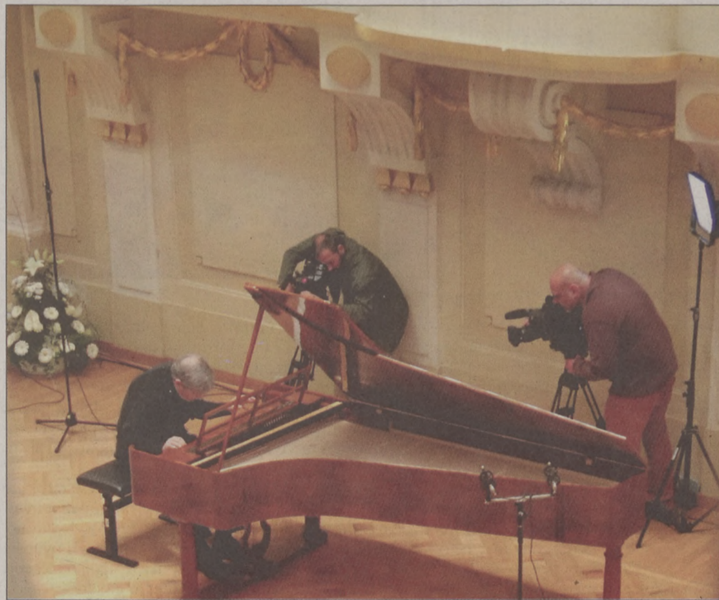
Malcolm Bilson koncertje a Graf fortepianoon 2016-ban

November 12-én, vasárnap 19.00 órakor Budavári Dalestek címmel rendezik meg Szutrély Katalin (ének) és Berecz Mihály (Graf fortepiano) közös koncertjét a Városháza aulájában (Kapisztrán tér 1.). A koncert egyik különlegessége, hogy ismét hallható lesz az Graf fortepiano kópia, amelyet az önkormányzat hiánypótló szándékkal készíttetett, hiszen Magyarországon nincs még egy ilyen hangszer.