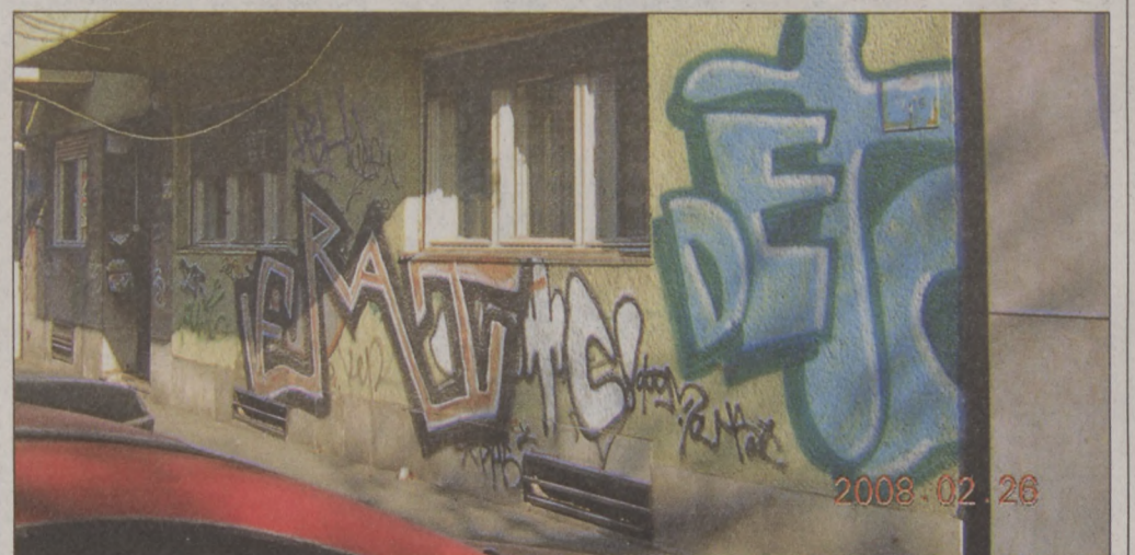
Ma már csak emlék... – egykoron mindennapos látvány volt a graffiti az Attila úton

Bár mára már sikerült visszaszorítani a nagyobb falfirkákat, a munka itt nem áll meg. Az önkormányzat a közelmúltban újabb 3 éves szerződést kötött a graffiti-mentesítő céggel, az Ifotech Kft.-vel. Az itt élőket pedig továbbra is arra kéri a kerület vezetése, hogy legyenek partnerek a falfirka elleni küzdelemben. A házfalakon megjelenő graffitikről haladéktalanul tájékoztassák a Polgármesteri Hivatalt, a károkozásról pedig tegyenek bejelentést a kerületi rendőrkapitányságon. Önkormányzati „zöld szám”: +36-80-204-275 (ingyenesen hívható).