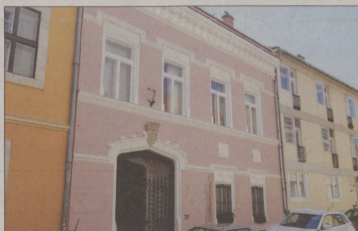
Uri utca 8. – Valódi ékszerdoboz