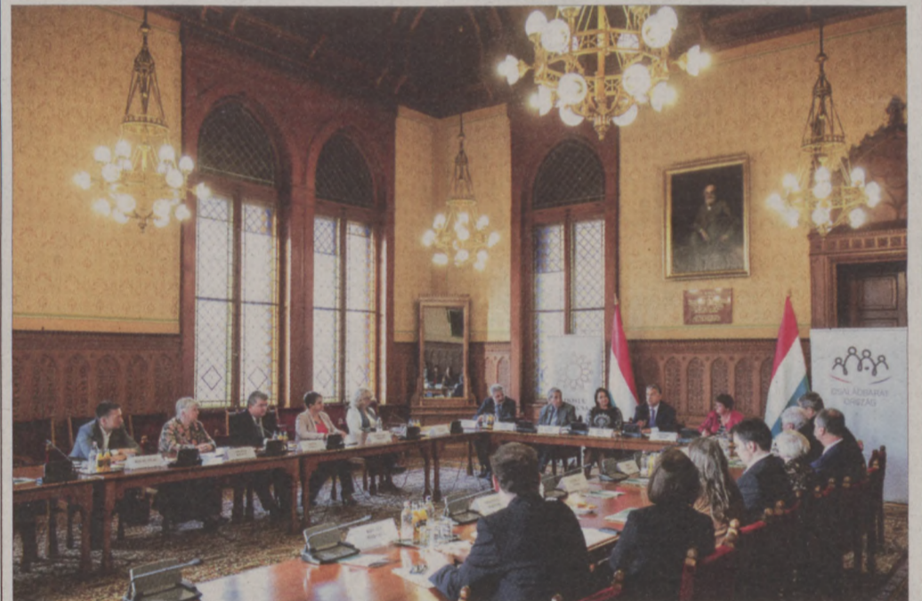
Az Idősek Tanácsa ülésén jelentette be a kormányfő a nyugdíjprémiumot

Először Magyarország történetében nyugdíjprémiumot fizet a kormány novemberben. Az Idősek Tanácsa ülésén a kormányfő elmondta, hogy a nyugdíjprémium kiszámításának alapja a 4,1 százalékra tervezett gazdasági növekedés. A háttérre pedig az, hogy ha a gazdaság jól teljesít - 3,5 százalék fölött -, akkor abból az egész országnak többlet keletkezik, amiből a nyugdíjasoknak is részülniük kell, hiszen az ő munkájuk hozzájárult a most aktívak sikeréhez.