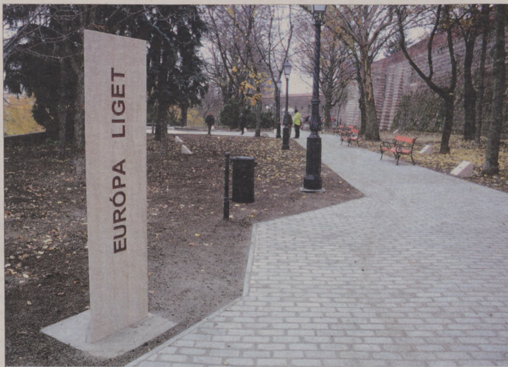
(Folytatás az 1. oldalról)

Az Európa Liget legnagyobb újdonsága vitathatatlanul az új sportpálya és a kültéri fitnesspark. – Olyan biztonságos és barátságos helyszínt alakítottunk ki, ahol a sportolni, mozogni vágyó kerületiek jó levegőn, szép környezetben, kicsit távol a város zajától tudnak kikapcsolódni – mondta a polgármester. A régi, ütött-kopott