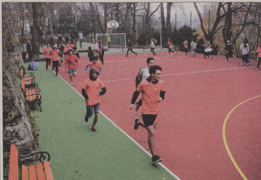
A Hunfalvy János Szakgimnázium diákjai már birtokba is vették a sportpályát: a szabad levegőn tartották a tornaórákat

A polgármester ezzel kapcsolatban elmondta, hogy a délelőtti órákban az iskolák számára biztosítják majd a sportpályát.