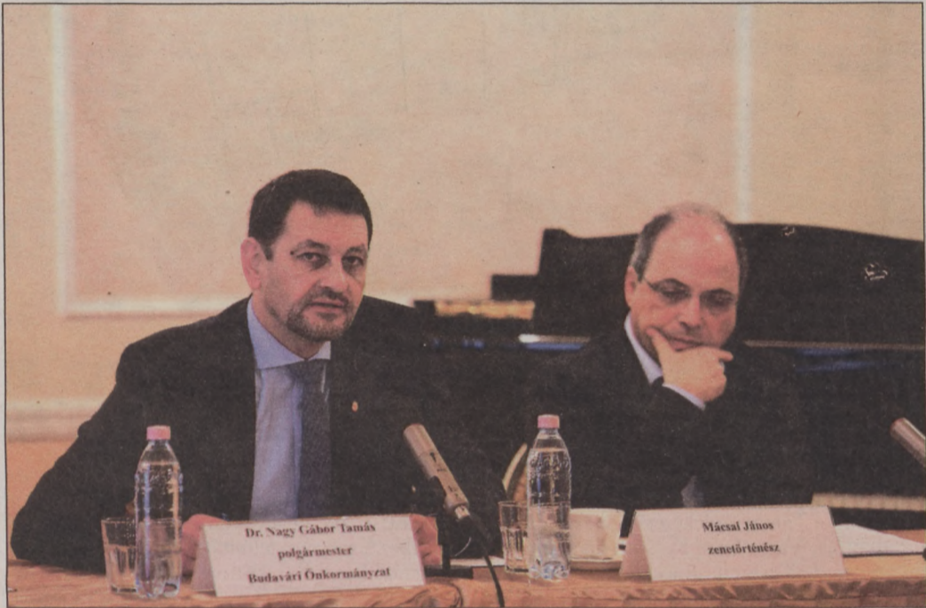
A fesztivál egyik mottója: Lásza Ön is vendégül Beethoven!

A fesztivál sikerét a széles zenei programkínálat és a neves előadók mellett az adja, hogy évről-évre újabb és újabb érdekességekkel, különleges-