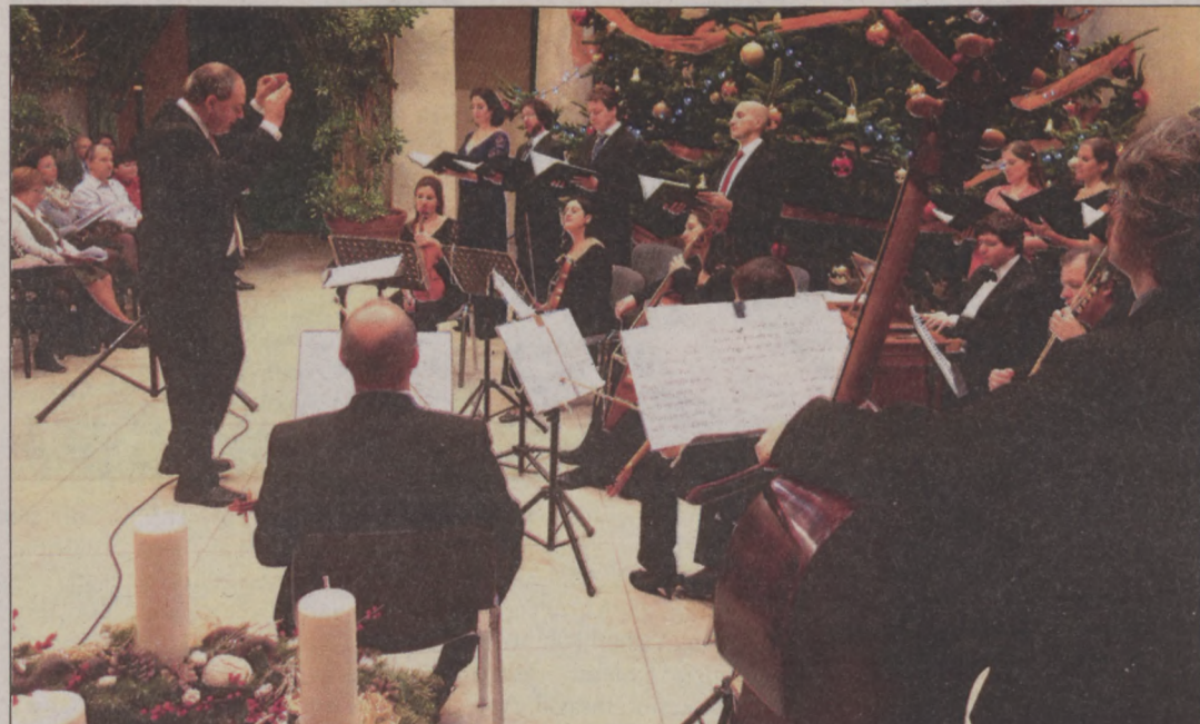
Az Orfeo Zenekar állandó résztvevője az adventi koncerteknek

– Fontos hangsúlyozni, hogy a mai értelemben vett karnagy és karmesteri „szakmák” a 17-18. században még nem léteztek, zenei irányítóra ugyanakkor nagyobb apparátus esetében mindig is szükség volt. Más kérdés, hogy van-e, kell-e lennie különbségnek aközött, hogyan vezényeljen valaki kórust vagy zenekart: én személy szerint úgy gondolom, hogy az e téren meglévő különbségeket sokszor túlhangsúlyozzák. Jó, ha valaki tisztán és világosan tud vezényelni (én e téren rengeteget tanultam az operai árokban). De a lényeg, hogy rengeteget kell tudni: kórus esetében az énekhangról, az éneklés szakmai részleteiről, zenekar esetében a különböző hangszerek jellegzetességeiről, és persze arról, mindezek hogyan épülnek bele egy-egy zseniális partitúrába.