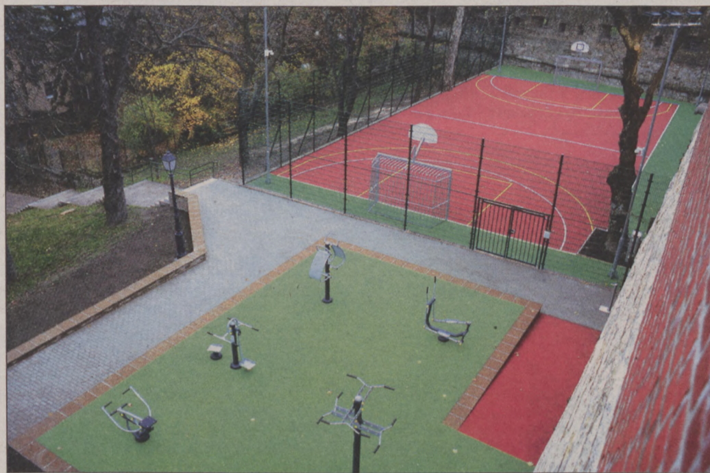
A Budavári Önkormányzat saját költségén, 131 millió forintért újjátotta fel a parkot és a sportpályát

- Az Európa Liget az üzeni nekünk, hogy milyen Európát szeretnénk: olyan békés, nyugodt és barátságos helyet, ahol biztonságban élhetünk. Ez jelképezi az európai városvezetők által elültetett fák is - mondta Nagy Gábor Tamás polgármester, utalva a park történetére.