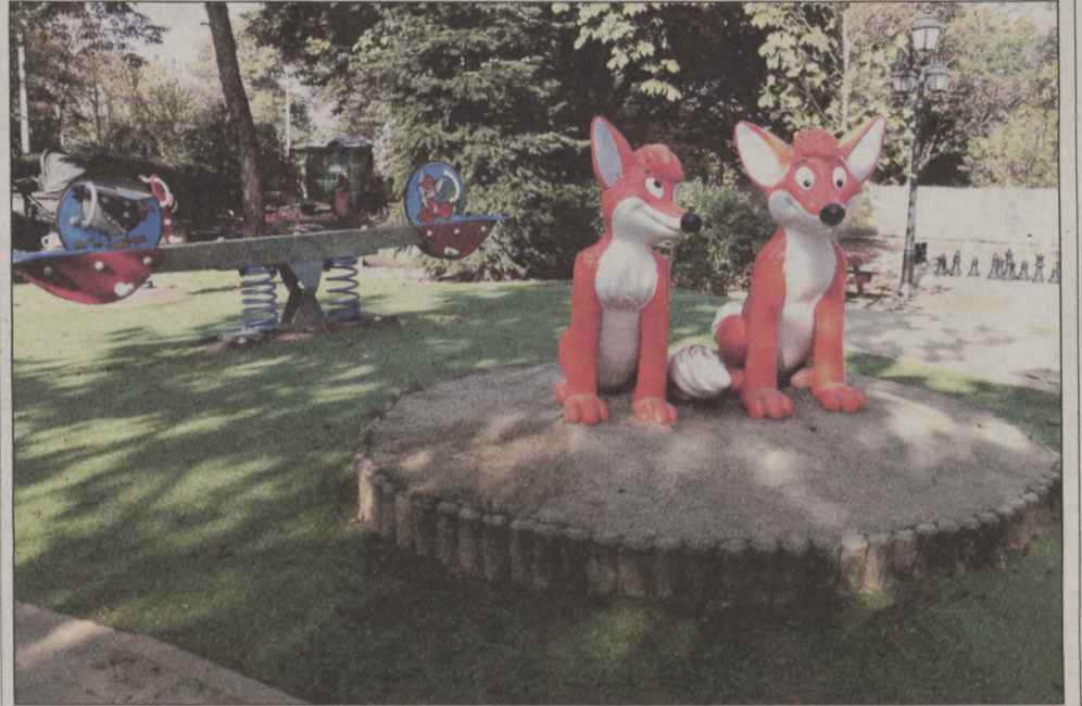
A kikopott zöldfelületeket műfüvel pótolták

– A jó levegőn végzett fogócska, bújócska, a csúszás-mászás élményét, a féktelen kacagás,