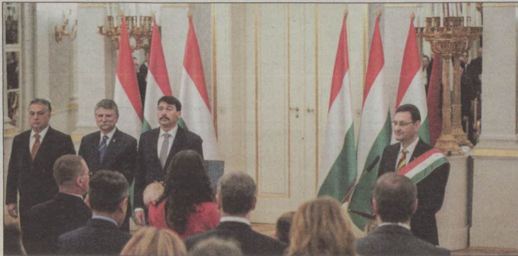
Az eskü ünnepélyes pillanata

és továbbadják ősök hitét és hazaszeretét, hogy magyarul szeretnek, magyarul dolgoznak, magyarul szólnak a gyermekeikhez és magyarul álmodnak – mondta Áder János. Az ünnepségen az emelkedett hangulatról Laklóth Aladár színművész és az Angelica Leánykar műsora gondoskodott.