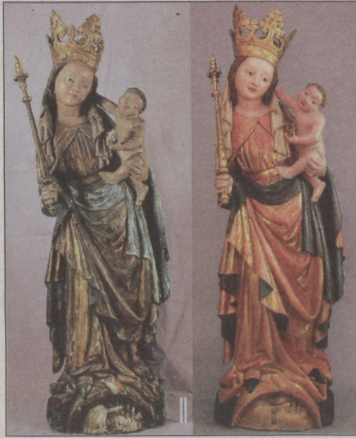
A Budavári Madonna felújítás előtt és után

Az alkotás a bűnt eltaposó Máriát ábrázolja, aki bal karjában a kis Jézust tartja, jobb kezében pedig egy jogart mutat fel. Vállát kendő takarja, fején szőlőlevél mintázatú korona nyugszik. A gyermek a szentlélek szimbólumát, egy galambot tart a kezében.