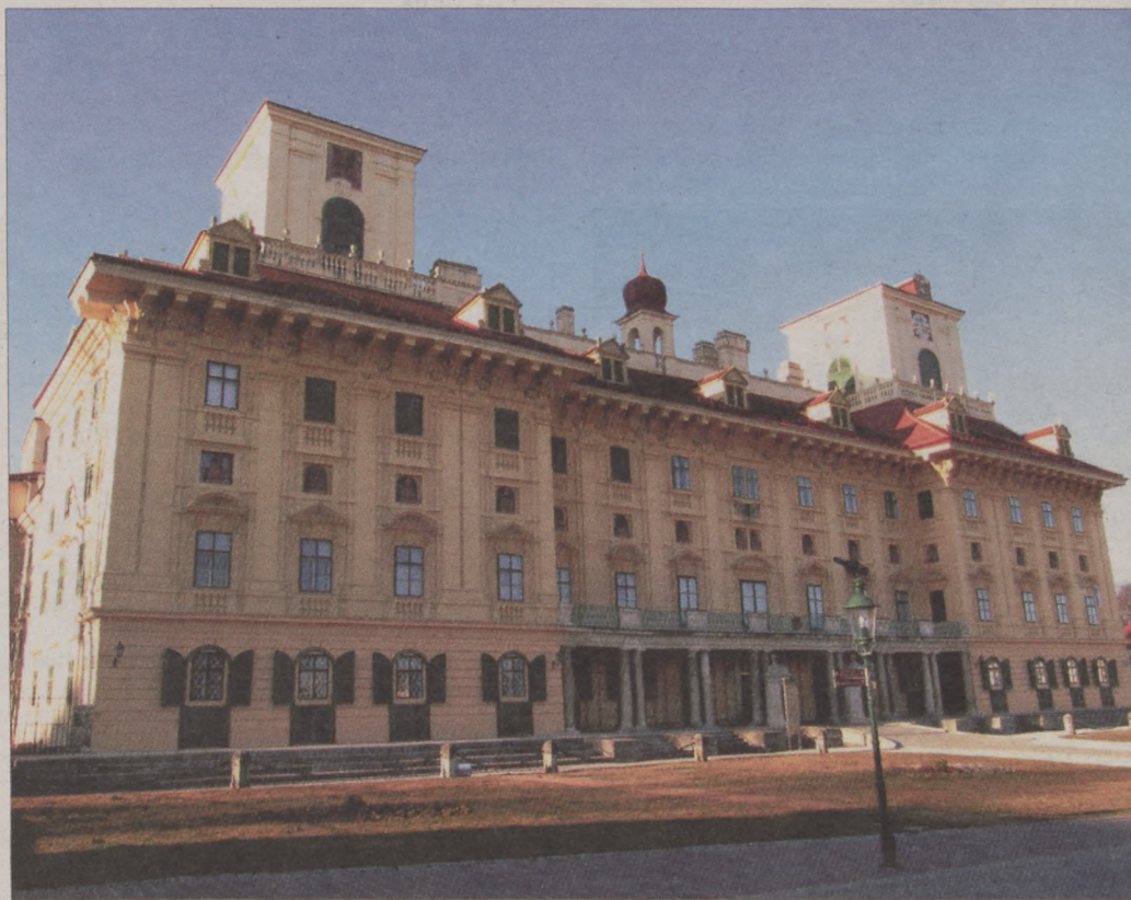
Az Esterházy kastély Kismartonban

A vezetés a Haydn teremben kezdődött. Európa egyik legjobb akusztikájú termében játszották Josef Haydn operáit, szimfóniáit, (Haydn 40 évig állt a herceg szolgálatában) az ismertető alatt is szólt a háttérben a zeneszerző egyik zongoraversenye. A sok-sok teremben bemutatták a család életét, nagyon érdekesek voltak a személyzet tagjainak szobái és azok felszerelése. A falikárpitok nagyrészt megmaradtak, ugyanúgy mint a freskók, és a kályhák. A vezetés a kastély kápolnájában ért véget. Stílszerűen búcsúzóul Haydn