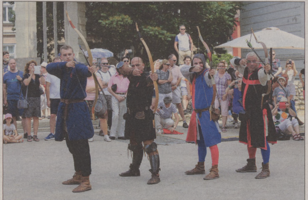
A Szent György Lovagrend haditorna bemutatója

őseink erejéből, vitézeink dicsőségéből. Ezért érdemes visszagondolnunk Buda fénykorára, ezért érdemes most is megidézni azt a korszakot, Mátyás király korszakát, amely talán a legfényesebb volt Buda történetében. Tegyük meg e történelmi sétát úgy, hogy rá emlékezünk, és egyben a jövőre gondolunk – zárta köszöntőjét Budavár polgármestere.