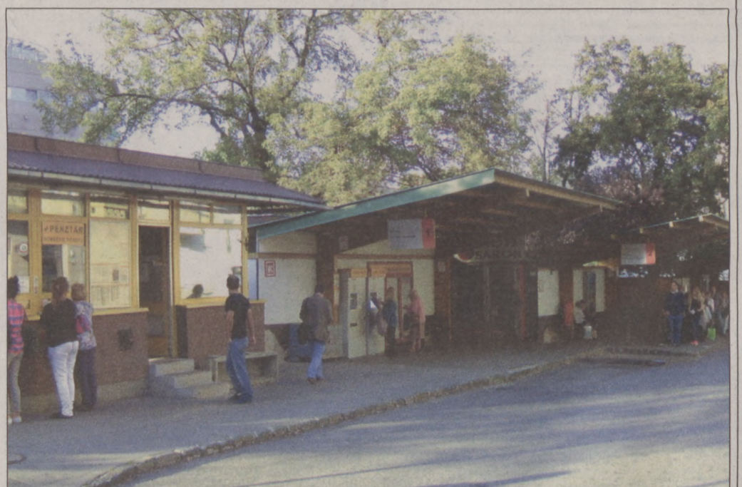
A felújítással megszűnik a buszpályaudvar a Széna téren

A cél az, hogy az autóbusz-végállomás megszüntetésével és a terület átalakításával, felújításával