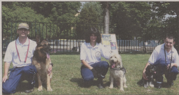
Június 2-án utó-gyereknapot szerveztek a Czákón. A mindig népszerű ugrólóvár mellett most az S.O.S. Mentőkutyás egyesület négy lábú tagjai is rabul ejtették a kicsik – és a nagyok – szívét. Természetesen nem maradhatott el az arcfestés és csillám-tettkők készítése sem.