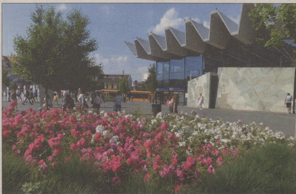
A Széll Kálmán tér már 2015-2016-ban megszépült a főváros beruházásában

A Budavár Önkormányzat a 2000-ben készített, és azóta többször aktualizált Kerületi Építési Szabályzat (KÉSZ) teljes felülvizsgálatával új építési szabályzat készítését kezdi meg. Az új szabályozás elkészítésének alapvető oka, hogy 2017. decemberében olyan nagy mértékben változtak meg a Fővárosi Önkormányzat lényeges településfejlesztési dokumentumai, hogy azok átvezetése a kerületi szabályozásban csak egy új KÉSZ megalkotásával lehetséges. A készülő KÉSZ egyeztetése teljes eljárás keretében, a partnerségi egyeztetési szabályairól szóló 6/2017 (II. 23.) önkormányzati rendelete alapján történik meg. Ennek értelmében a KÉSZ tartalmára, rendelkezéseire vonatkozó javaslatot, észrevételt tehetnek írásban 2018. június 25-ig az önkormányzat polgármesterének vagy Főépítészeti Irodájának címére (1014 Budapest, Kapisztrán tér 1.) megküldve, illetve elektronikus levélben a foepitesz@budavar.hu e-mail címre.