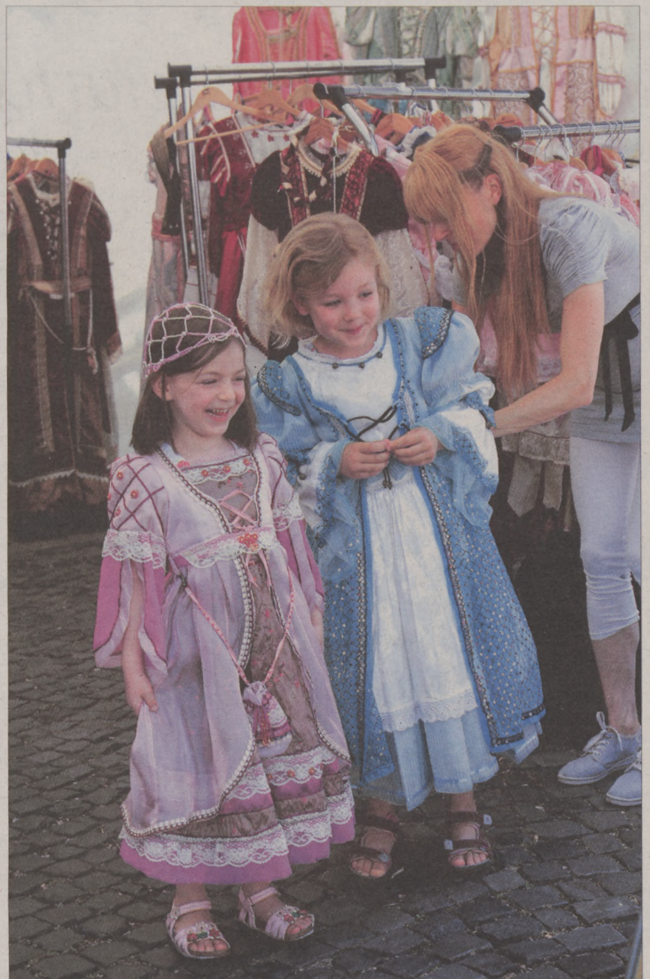
„Igazi” hercegnők a reneszánsz udvarban