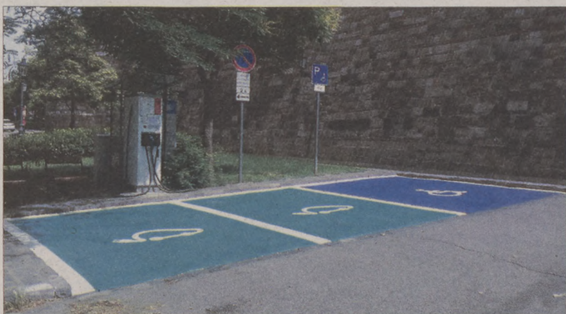
A Budavári Kapu Kft. beruházásában speciális burkolatot építettek a Lovas úti elektromos töltőállomáshoz