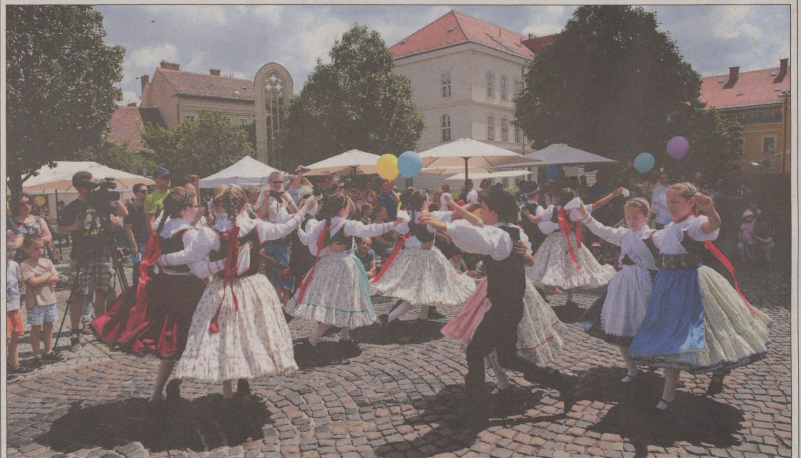
Május utolsó vasárnapján a Budavári Önkormányzat színes programokkal várta a gyerekeket a Kapisztrán téren