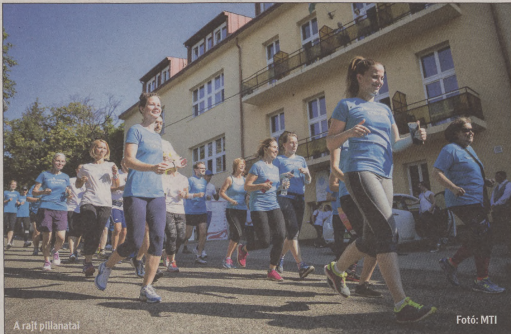
A rajt pillanata

A rendezvényhez csatlakozott a Budavári Önkormányzat is, a Polgármesteri Hivatal munkatársai véradással segítettek az akciót (képünkön).