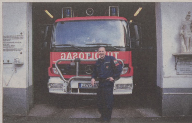
A kerület biztonságáért a katasztrófavédelem munkatársai is sokat tesznek

Sor került az idei költségvetés módosítására is, hogy az időközben felmerült változásokat átvezessék. Többek között plusz forrást biztosítottak a sajátos nevelési igényű gyermekek óvodai ellátására, a Szentháromság téri pavilonsor tervezésére és felújítására, valamint a Budavári Játszótér Üzemeltető Nonprofit Kft. finanszírozására. Ez utóbbira azért volt szükség, mert az állagfelmérés során kiderült, a téli időszakban több eszköz is megrongálódott és rendkívüli karbantartást igényel.