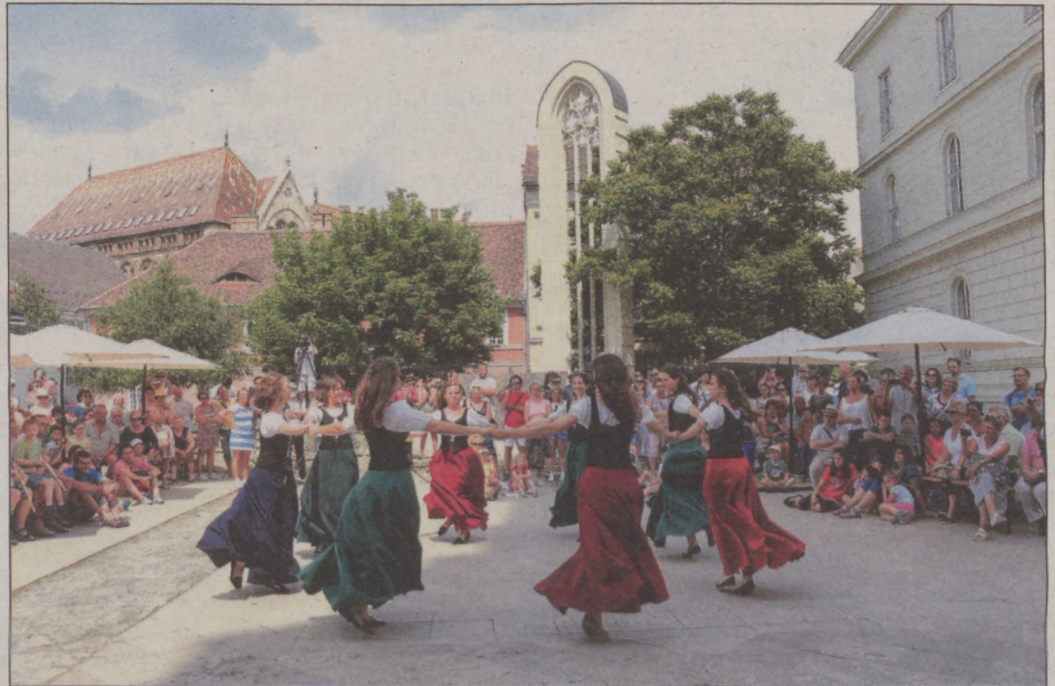
Reneszánsz táncok a Primavera táncgyűttessel