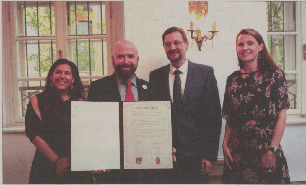
A Carouge-i és a Budavári Önkormányzat vezetése megerősítette a testvérvárosi együttműködést

– Carouge és Buda együttműködése, barátságának ereje nem kizárólag a személyes kapcsolatokról, hanem a közös európai gyökerekből is fakad – mondta a polgármester. Úgy fogalmazott, hogy az európai múlt – időtől és tértől