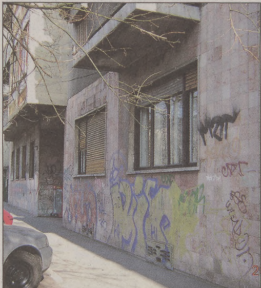
Az Attila út 2008-ban: mindennapos látvány volt a graffiti. Már a múlté.

– Itt van példaként a graffit elleni küzdelem. Sokáig úgy tűnt, csak nekünk szúrja a szemünket. Hosszú évek küzdelme volt, mire sikerült elfogadtatni, hogy a graffitizés nem művészet és nem elfogadott önkifejezési forma, hanem rongálás, amely közösséggellenes, és ezért veszélyes a társadalomra. Még jól emlékszem arra, hogy hogyan nézett ki a város tíz évvel ezelőtt. Mindenhol falfrókák, amely bántotta az emberek szemét. Mióta javaslatomra a Fidesz-kormány rongálásá minősítette a falfrókát, és az nevesítetten bekerült a Büntető Törvénykönyvbe, jelentősen megváltozott a helyzet. Nem mondom, ma is vannak még falfrókák, de jóval kevesebb. Budapest kinötte, maga mögött hagyta a graffiti. Érezhetően tisztább a város, és nem a szlómódóság képét mutatja.