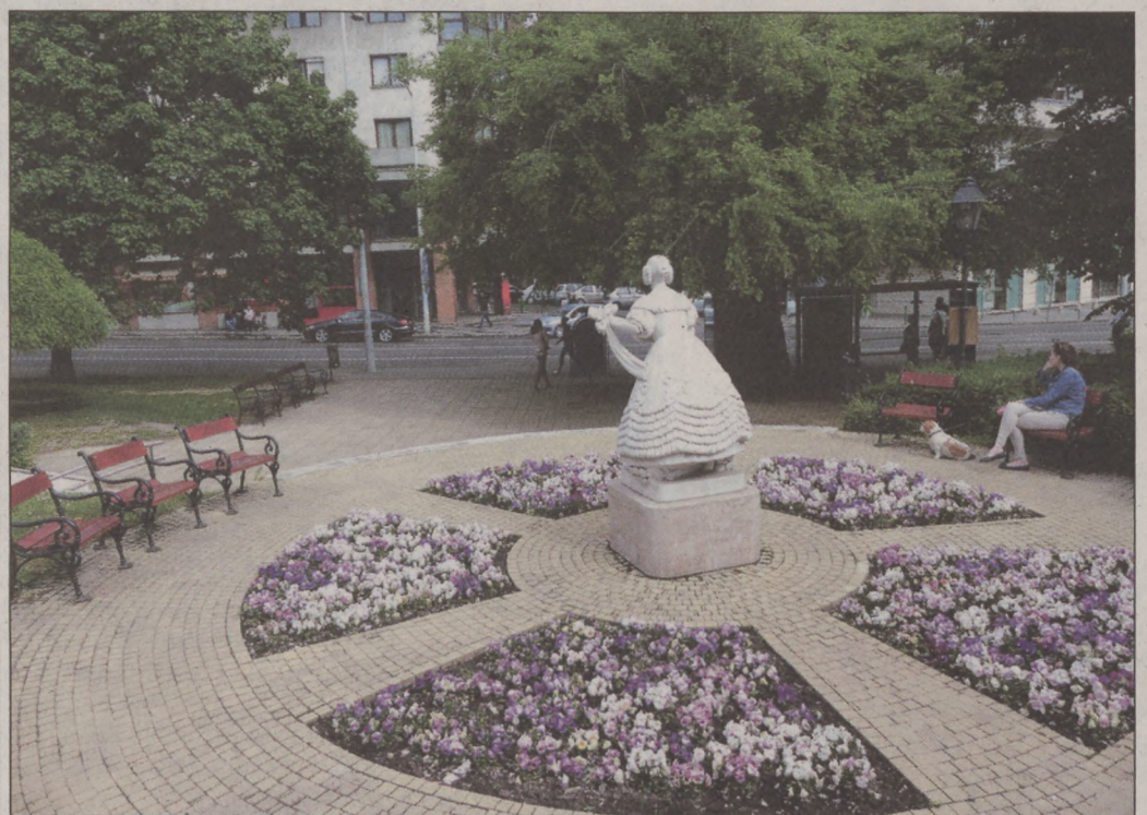
A Horváth-kerti pavilionsort (felső kép) 2010-ben bontották el, ekkor állították fel a népszerű Déryné szobrot