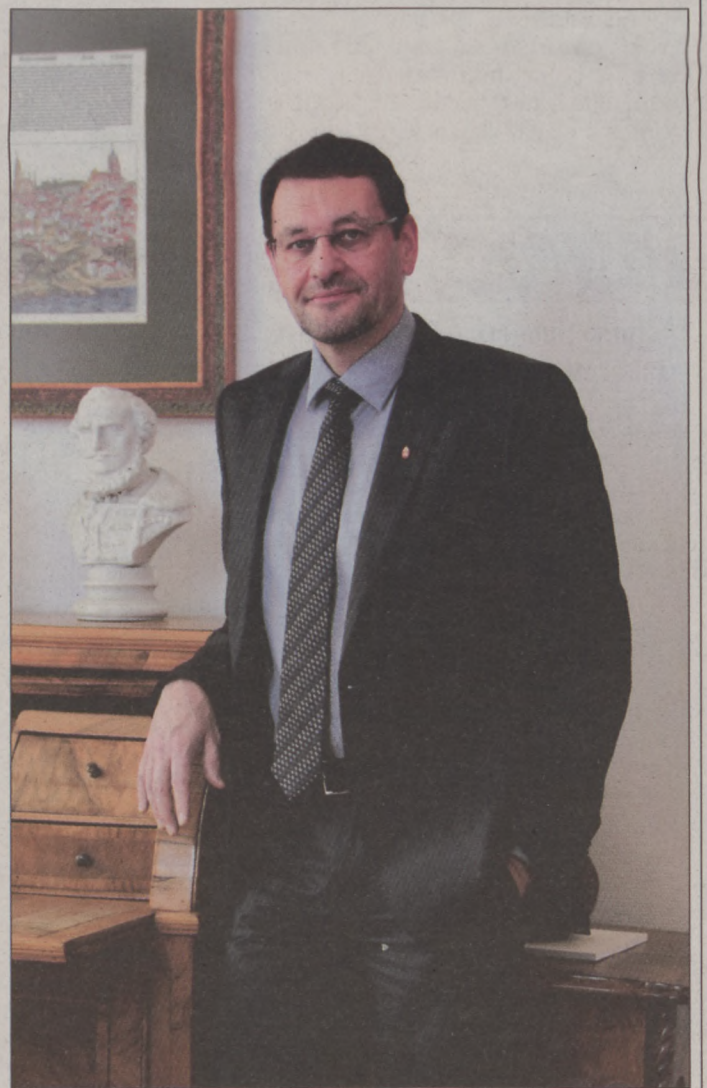
Budán lakni világnézet. Az egészséges lokálpatriótta szemlélettel rendelkező, öntudatos és kulturált, a történelmet, a művészeteket, az emberi kvalitásokat, eredményeket elismerni kész közösség kifejezetten közel áll az én lelki alkatomhoz, kulturális érzékenységemhez. Ez a közösség pedig megérti és támogatja a törekvéseinket. (Folytatás a 4-5. oldalon)

– Biztosan nem. Ma is úgy érzem, szinte sorsszerű, hogy az I. kerület polgármestere lehetek. Mindig is nagyra tartottam azt a budai polgári attitűdöt, amit Márai zseniálisan összefoglalt: