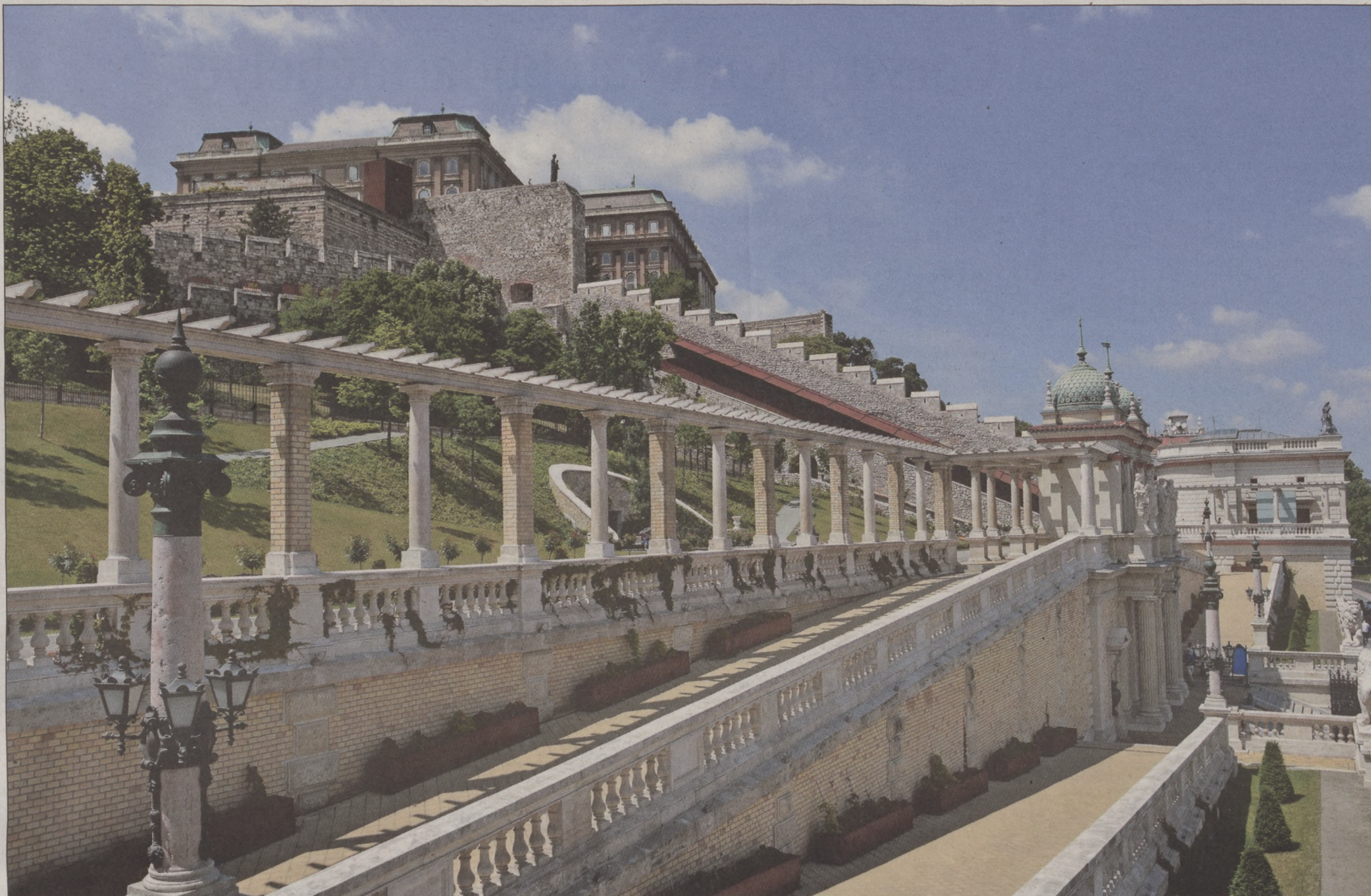
Harminc évig hagyták pusztulni a Várkert Bazárt (lásd alsó kép), az épületegyüttes ma a főváros egyik ékköve

mek, cukrászdák, kávézók, új üzletek nyitnak a Krisztina belvárosában. Már csak emlék az egykori bődésor a körüti villamosmegálló mellett. A Déryné szobor újraállításával a kert visszakapott valamit egykori szépségéből és hangulatából. Jelenleg is zajlik a Mikó utcai gyermekorvosi-rendelő felújítása, és még idén megnyílik a Krisztina