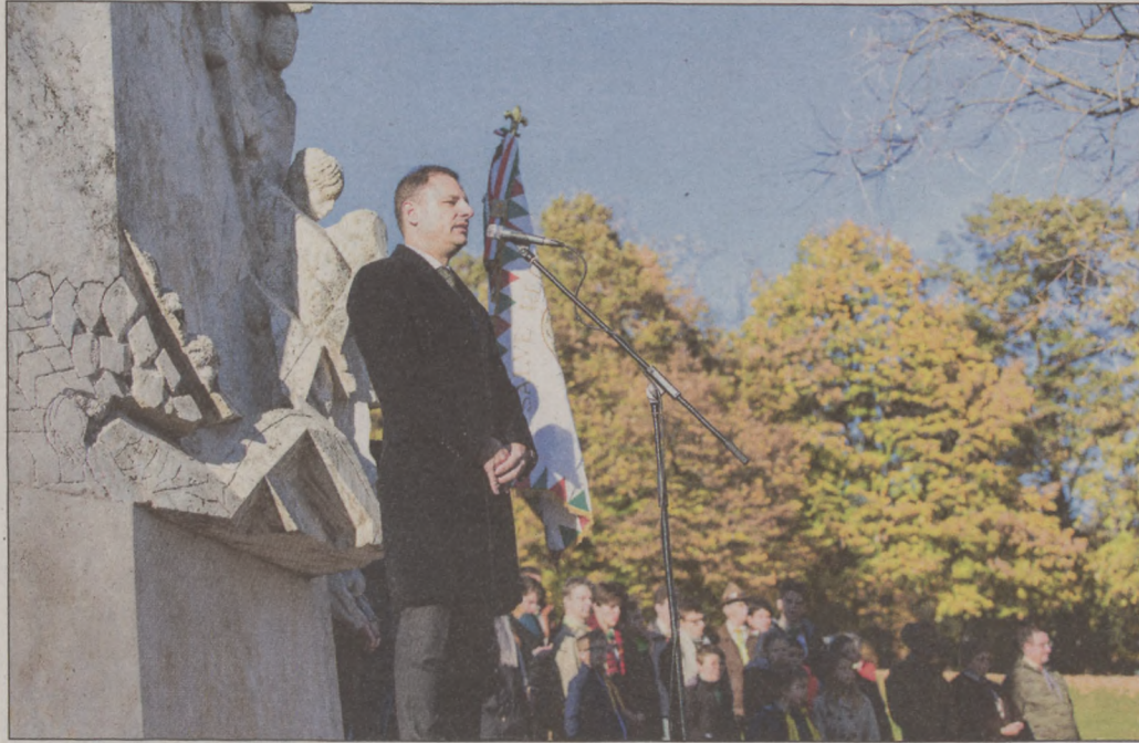
Tuzson Bence államtitkár volt az ünnep szónoka