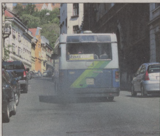
Az elavult Ikarus buszoktól 2015-ben búcsúztunk el

– Nem ezért kezdeményeztem, hogy a kerületben, majd a fővárosban is ingyen parkoljanak a zöld rendszámú autók, hanem azért, hogy ösztönözzük a zéró emissziós autók elterjedését. Az, hogy ezért engem megvádolnak, kicsinyes dolog. Ha ugyanis valaki vállalja, hogy elektromos autót vásárol, és azzal közlekedik, az egyfajta befektetés a jövőbe, hiszen nem szennyezi a levegőt. Arról meg már nem szól az ellenzék, hogy nem pusztán a hivatali autót cseréltük le elektromosra, hanem a kerületkaritógépeink többsége is elektromos meghajtással üzemel, bemutattva azt, hogy milyen sokoldalúan lehet használni ezt a modern technológiát. Sőt, nagyon sokat dolgoztunk azért, hogy elektromos buszok közlekedjenek a kerületben. Évtizedekig kellett elvisszünk a kipufogógáz, a zaj- és rezgésterhelés, amit a kiöregedett Ikarus buszok jelentettek.