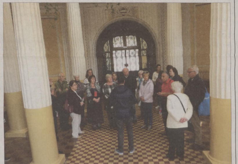
A zentai Városházán

A egyszerűen sikerült látogatást értékelve a buszban arról beszélgettünk, hogy milyen nagyra tartjuk Zenta testvérvárosunkat, sok értékes embert ismertünk meg, és várjuk a következő találkozást. Budavári Kézfogás Testvérvárosi Egyesület