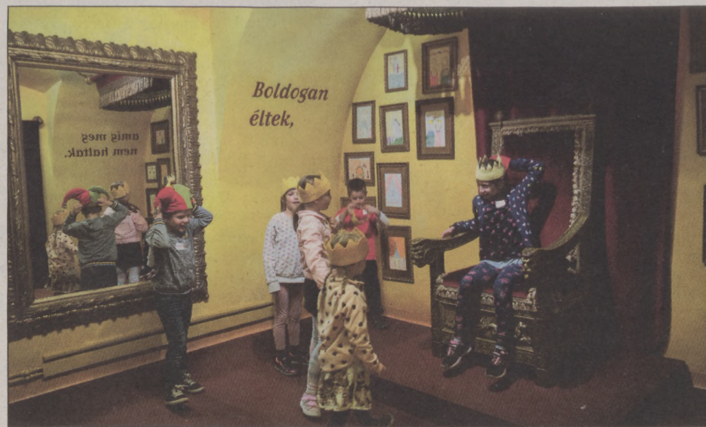
Az egyedülálló Mesemúzeum 2012-ben nyílt meg, már tervezik a bővítését

– Igen, ha rajtam múlik, és a Fidesz továbbra is jelöl, én a magam részről állok elébe. Szeretem ezt a közösséget, és rengeteg tervem van még. Úgy érzem, az itt élők látják, tapasztalják, hogy alapvetően jó irányba mennek a dolgok. Én ennek a folytatásához kérem majd a kerületi választópolgárok támogatását.