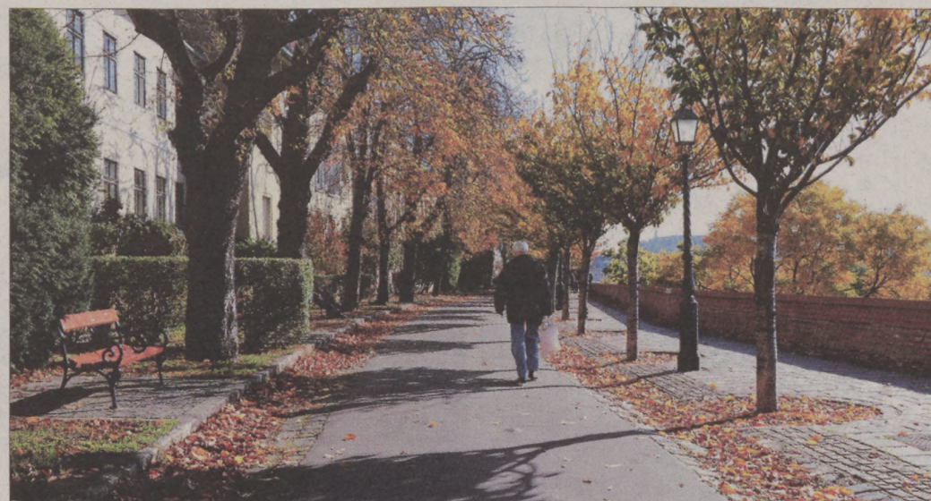
A kisgyermekes családok és az idősek egyaránt jól érzik magukat az I. kerületben