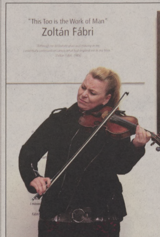
Szirtes Edina Mókus szívet-lelket melengető produkciója a Tér-Kép Galériában

A mester idős koráról András Ferenc elmesélte, hogy semmi sem érdekelte a munkáján kívül, még az elkészült filmek további sorsa sem. Nem