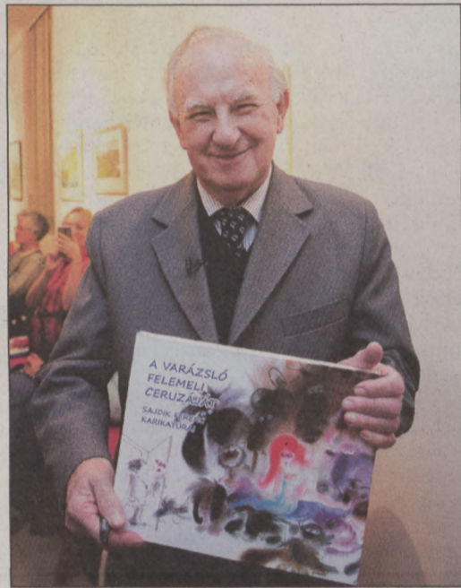
A „Varázsló” az új albummal

A galériába lépve azonnal a Sajdik-univerzumba csöppentünk. Minden kép, minden grafika elvarázsolja a néződőt. Akadnak színes mesevárosok, álomszerű utcák, tájak és karakterek. Ezeket a festett színtereken is százféle esemény zajlik, tucatnyi ismeretlen ismerős tűnik fel és egy-egy apró részlet önállóan is elgondolkoztat vagy mosolyra fakaszt. Külön részt alkotnak a képregények, valamint a háromdimenziós portrék, amelyeken a karikatúrát a Mester még megtoldja egy képből kiemelkedő tárggyal is. Balassi Bálintét például a kép üvegét áttörő ágyúgolyóval, Zelk Zoltánét két egyforma, feliratozott kis csomaggal. Az egyiket ez olvasható: „11 év börtön”, a másí-