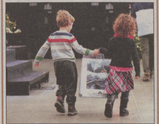
Ajándékok várják a gyerekeket

Érdeklődni a +36-1-356-8363-as telefonszámon lehet.