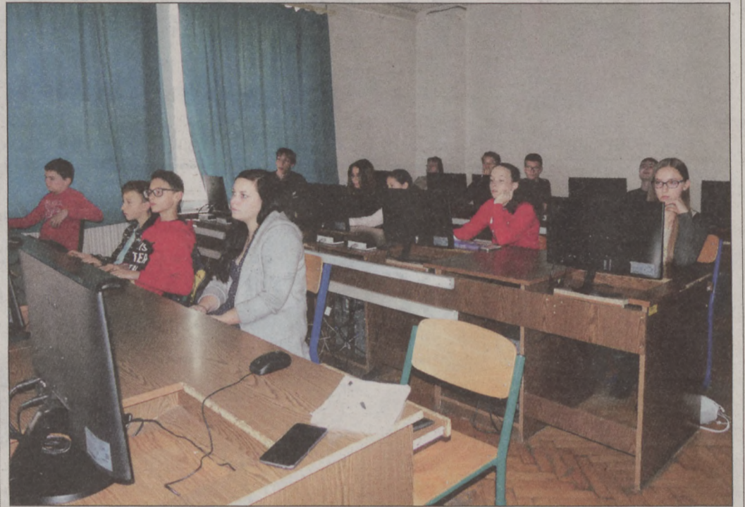
Geomatech óra a Szilágyi Gimnáziumban

A program keretében negyven pedagógus továbbképzése kezdődik meg és 400 tanuló szinte már azonnal részese lehet az eredményeknek, hiszen a pedagógusok a tanultakat akár