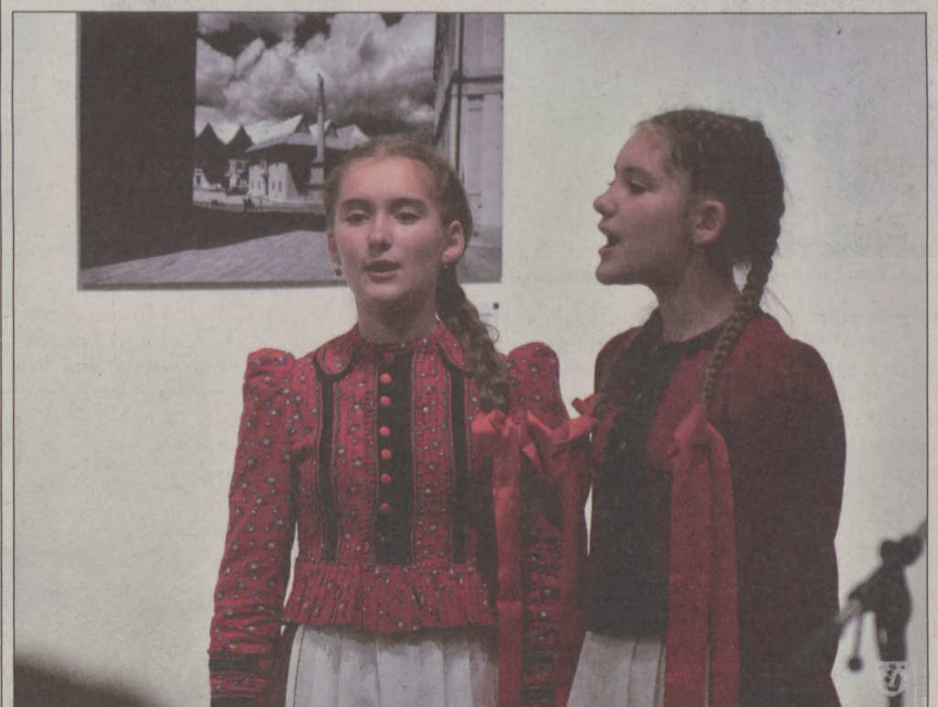
Kiállítás megnyitó Székelyudvarhelyen