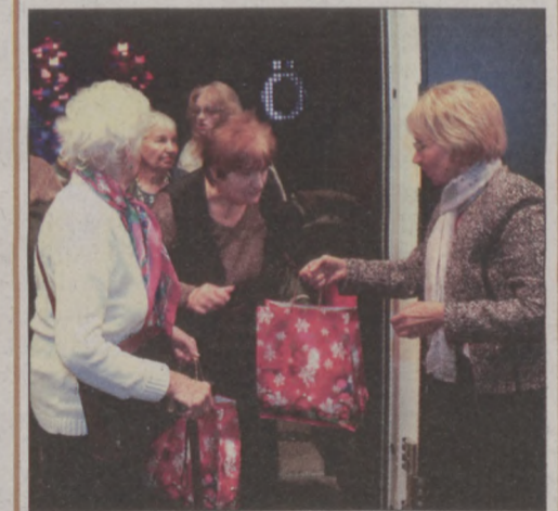
Meglepetés a kerületi időseknek

További információ: a +36-1-356-6584-es telefonszámon (Gondozási Központ).