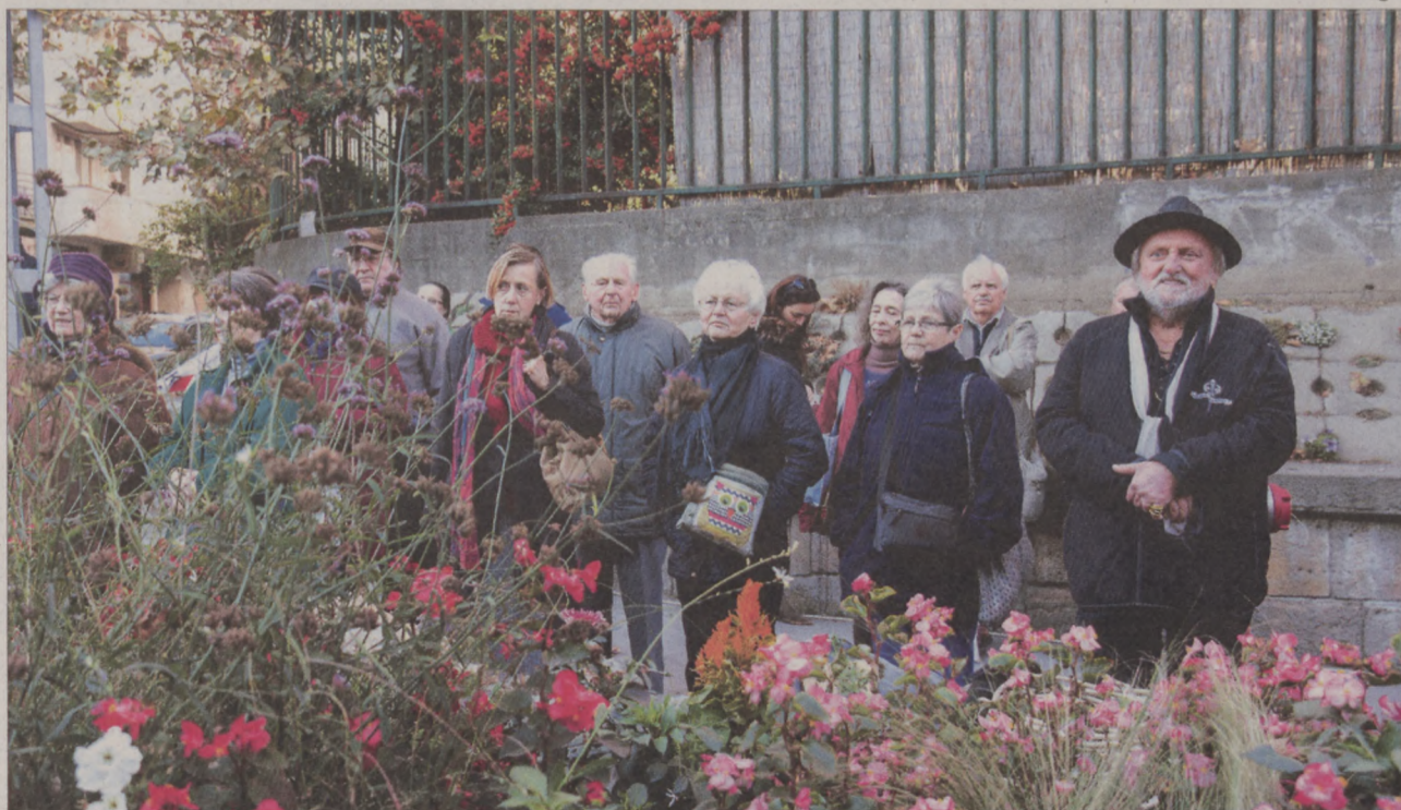
Barátok, pályatársak, egykori szomszédok, a szeretett Krisztinaváros polgárai emlékeztek Gyurkovics Tiborra