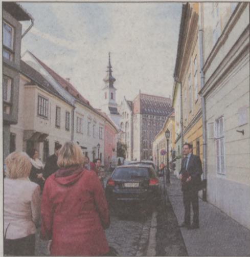
Tóth Árpád egykori lakóháza előtt

90 éve, 1928. november 7-én hunyt el Tóth Árpád, a XX. század legnagyobb magyar elégia-költője, műfordító, aki élete utolsó évtizedében a Táncsics Mihály (akkor Verbőczy) utca 13. szám alatti ház egyik lakásában élt családjával. Nagy Gábor Tamás a Táncsics Mihály utcai Tóth Árpád emléktáblánál erre is felhívta a résztvevők figyelmét.