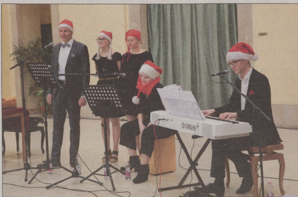
A Savonlinnai Művészeti Középiskola diákjai