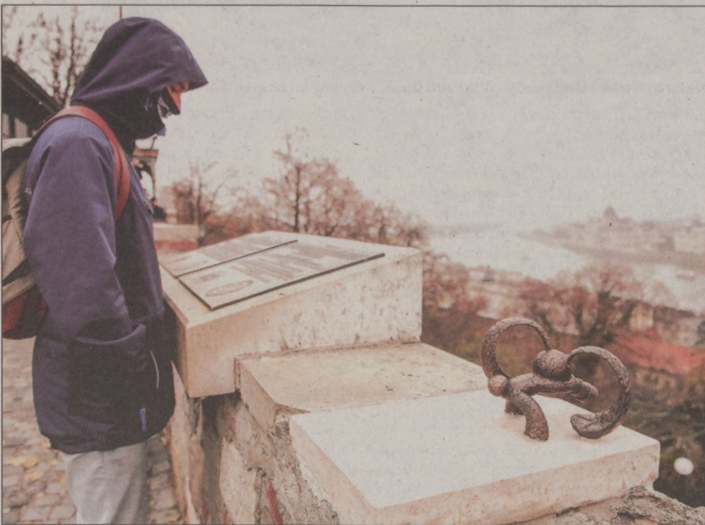
A kockásfülű nyúl mini szobra a Várban